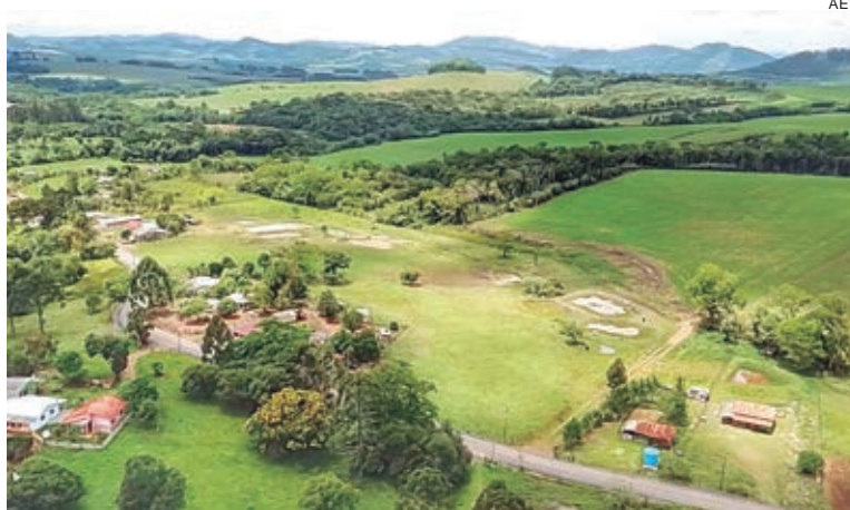
Novas regras do ITCMD têm impacto direto em relação as propriedades rurais