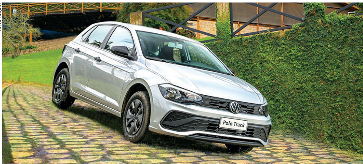
O Polo está sendo produzido há 20 anos no Brasil e substituiu o icônico Gol

“O Volkswagen Polo tem se consolidado como um modelo que atende a todos públicos, desde a versão Track até a versão esportiva GTS, e por isso ele vem se tornando cada dia mais a preferência do con-