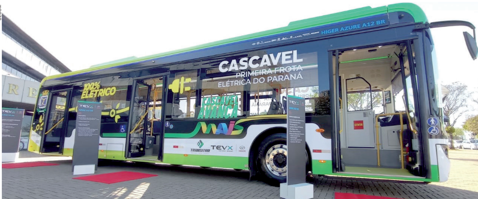
Dentre as novidades e expectativas com o novo contrato está a incorporação dos ônibus elétricos à frota

O acórdão do TCE-PR (Tribunal de Contas do Estado do Paraná) liberando a republicação da licitação do novo contrato de serviços do transporte público de Cascavel foi publicado ontem (7). Com a decisão do Tribunal, a Transitar, responsável pela elaboração do projeto, irá realizar a análise das mudanças solicitadas pelo TCE e pode realizar a republicação da nova licitação em até 15 dias. Com a revogação da cautelar, o TCE autorizou a Transitar a retomar o certame de maneira imediata.