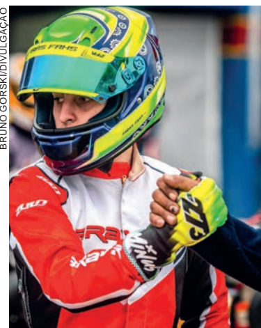
desempenho e esperamos que tenha a mesma performance na Copa São Paulo, no próximo dia 19", acentua Firas.

A vitória também garantiu a Firas a manutenção da liderança das categorias F-4 A e F-4 Geral, com 155 pontos em ambas. "Foi um sábado perfeito. O chassis Bravar teve excelente