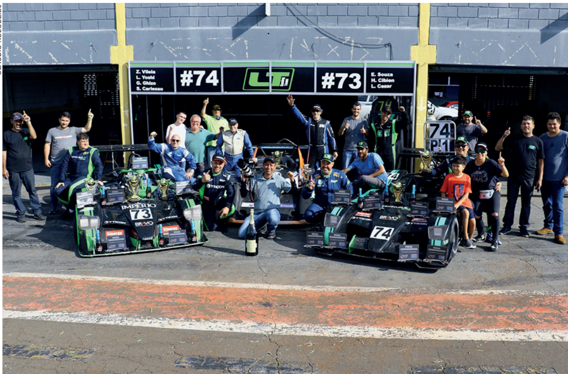
A equipe LT Team terá uma grande estrutura nos 500 Km de São Paulo e colocará três carros à pista