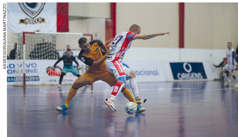
Cascavel Futsal segue na defesa da liderança da Série Ouro