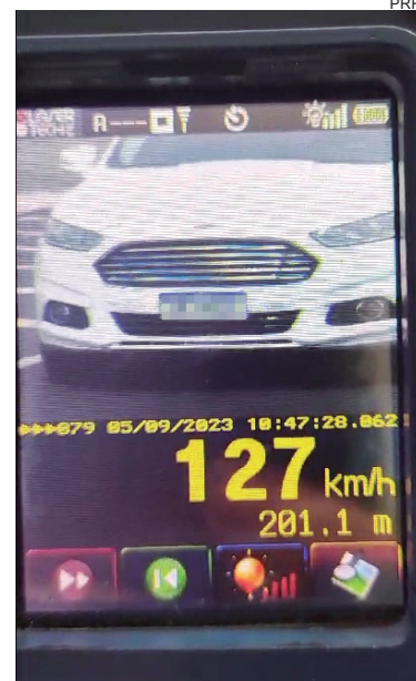
Na maioria dos flagrantes da PRF, a velocidade é acima dos 120 Km/h

quando existe colisão, na maioria das vezes, os acidentes são graves com grandes chances de sequelas e óbitos e, infelizmente, poucas chances de sobrevivência. “As passarelas são sempre a melhor opção e sempre reforçamos isso”, finalizou.