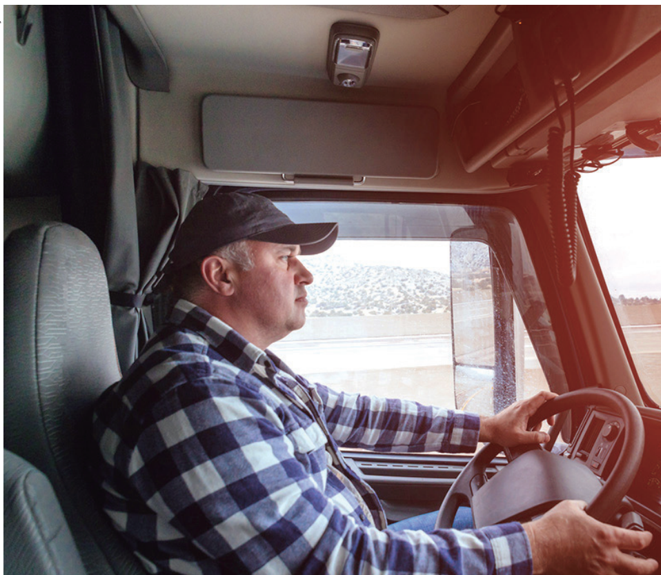
O caminhoneiro desempenha papel fundamental no transporte de variados produtos essenciais em todos os setores da economia no Brasil

Do mesmo modo, está a quantidade de comércio e reparação de veículos. De 2022 para 2023, houve um aumento de cerca de 5,3% das lojas existentes, totalizando atualmente 909.122 empresas automotivas no Brasil.