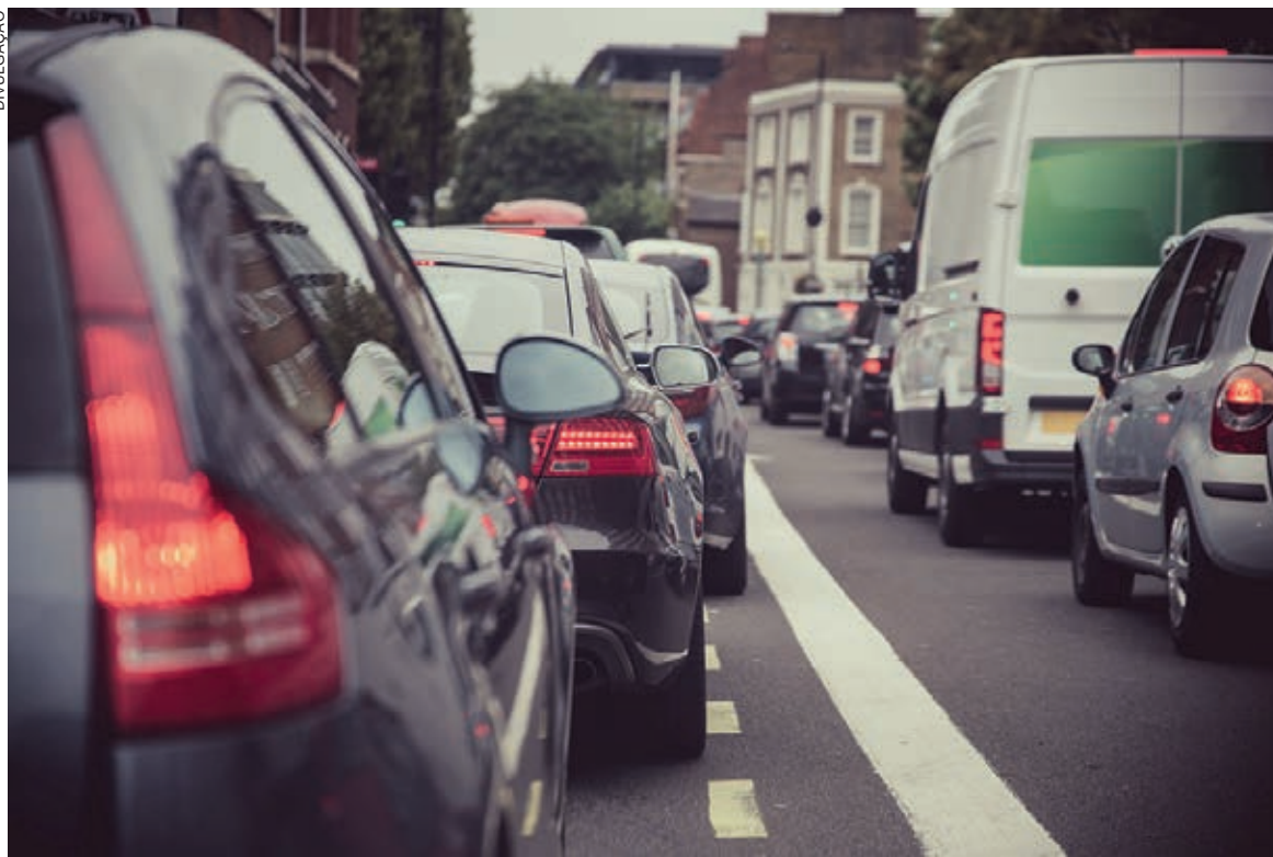
Curitiba está em 37º lugar no ranking das cidades com o pior trânsito no mundo

Fato é que o trânsito nas grandes cidades é um problema que afeta milhões de pessoas em todo o mundo. O aumento significativo do congestionamento no Brasil tem