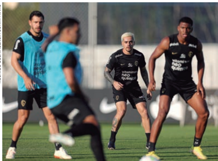
Timão finalizou preparação na tarde de ontem para enfrentar o Fortaleza