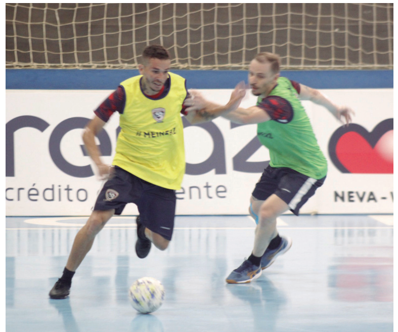
Cascavel segue agenda no estadual para confirmar primeiro lugar