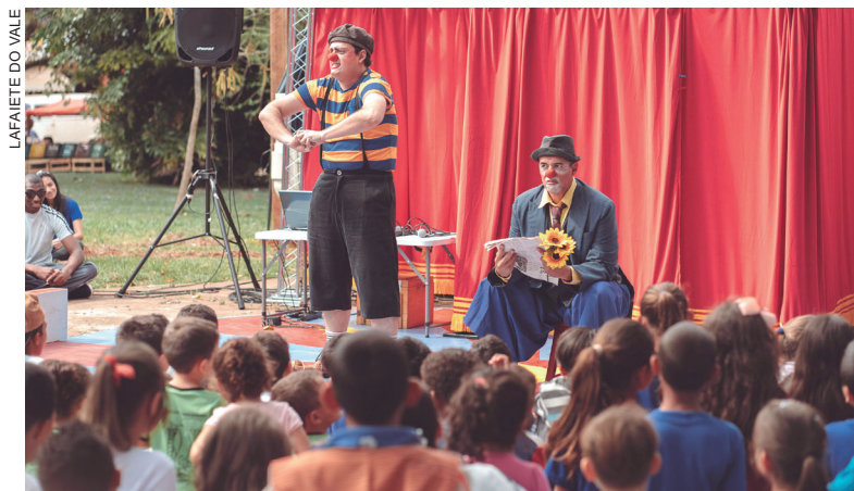
LAFARIETE DO VALE