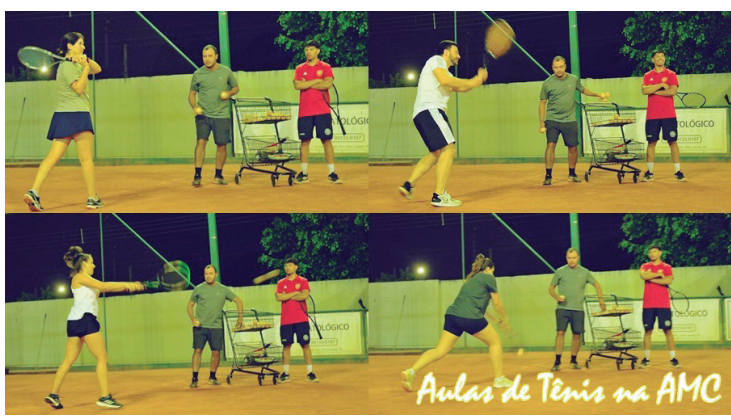
Aulas de Tênis na AMC

A Associação Médica de Cascavel firmou parceria com a Tennis Mania para promover aulas de tênis para os interessados na modalidade. A iniciativa tem sido um grande sucesso, atraindo pessoas de diferentes idades e níveis de experiência. Com a crescente popularidade do tênis em Cascavel, iniciativas como essa são importantes para proporcionar oportunidades para a prática do esporte, bem como para promover um estilo de vida saudável para a população.