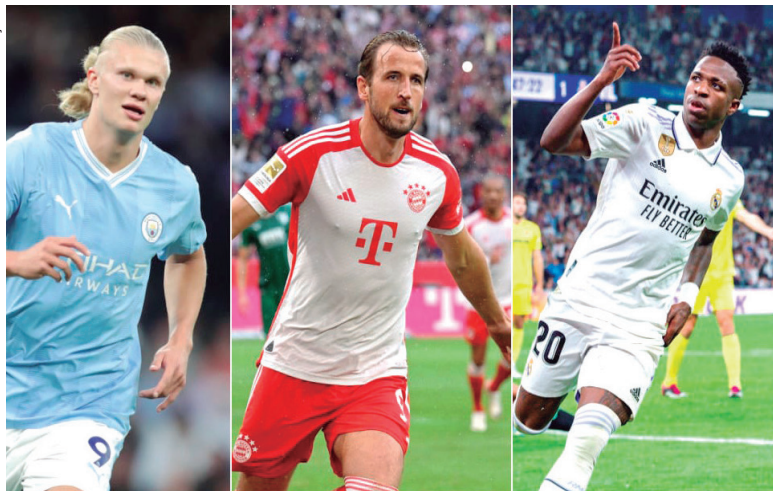
Estrelas da Europa entram em campo a partir de hoje em busca da 'orelhuda'

São Paulo - Nesta terça-feira (19), a Champions League retorna para a disputa de uma nova temporada com o início da fase de grupos. São 32 equipes na disputa pelo título mais cobiçado do futebol europeu. A primeira rodada do torneio ocorrerá com 16 partidas dos oito grupos.