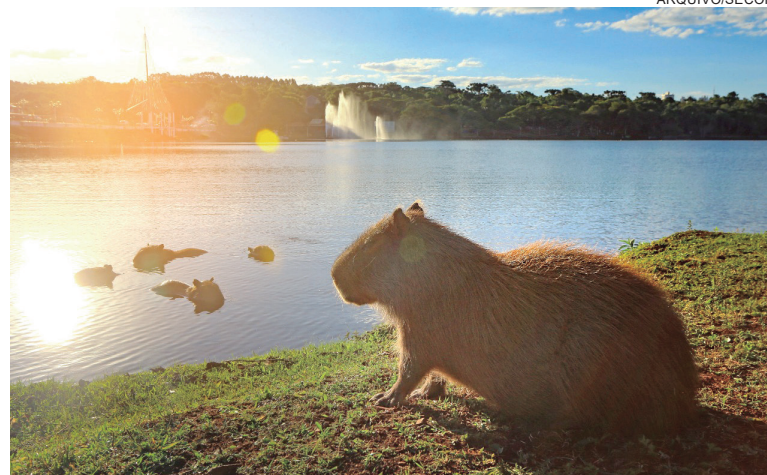
Em Cascavel, no último domingo, a temperatura máxima registrada foi de 34,2° C

O balanço diário de água é controlado por sensores loca-