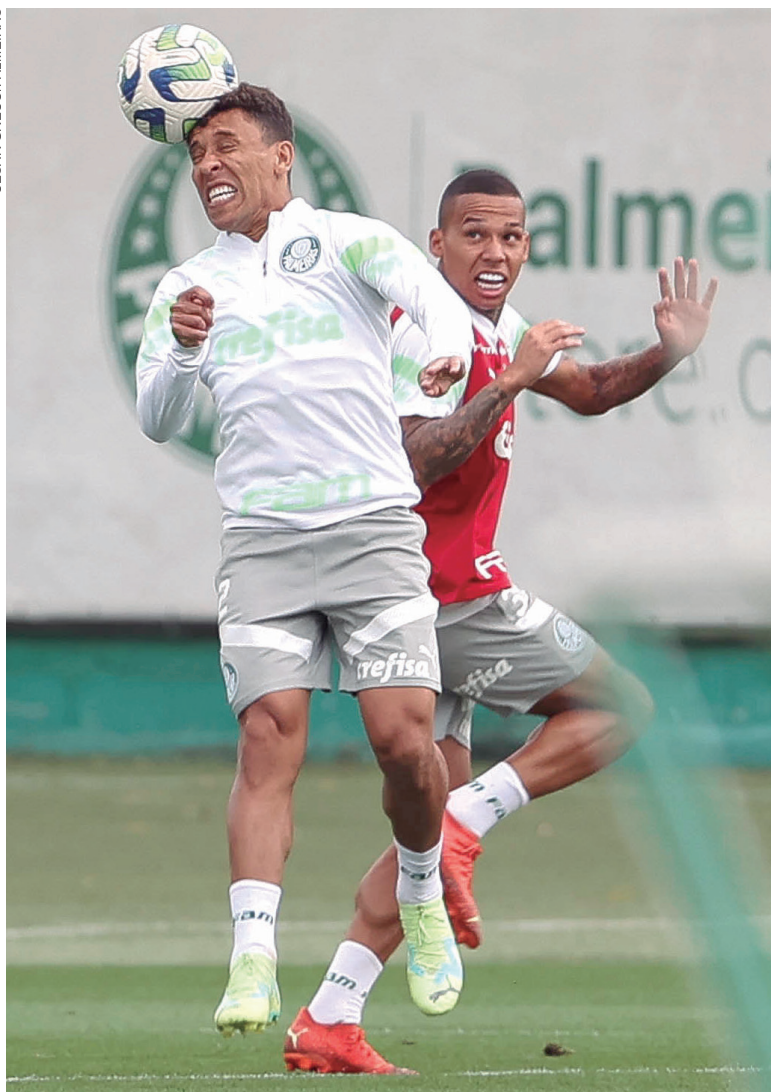
Palmeiras defende vice-liderança do Brasileirão

São Paulo – O fechamento da rodada do Brasileirão, nesta sexta-feira, acabou beneficiando o Palmeiras. Dos times que cederam jogadores para as seleções na Data Fifa, o time foi o único que teve tempo de recuperar os convocados fisicamente e, ainda, realizar treino contando com todos. Assim, o Verdão terá força máxima na partida contra o Goiás, marcada