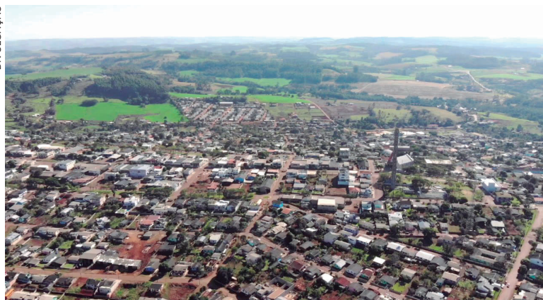
A licitação em Três Barras do Paraná, com população de 11.135 pessoas (Censo de 2022) atraiu 11 interessados

O conselheiro do TCE-PR levou em consideração o fato