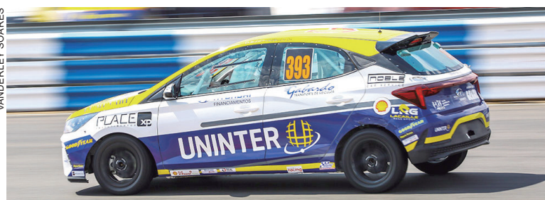
Cláudio Harmuch ocupa a quinta colocação na classificação da categoria Super na Copa HB20

"A última etapa em Goiânia vai ficar marcada nesse ano de estreia na Copa HB20. Depois de quatro etapas com altos e baixos, consegui superar o pelotão intermediário sem receber muitas batidas,