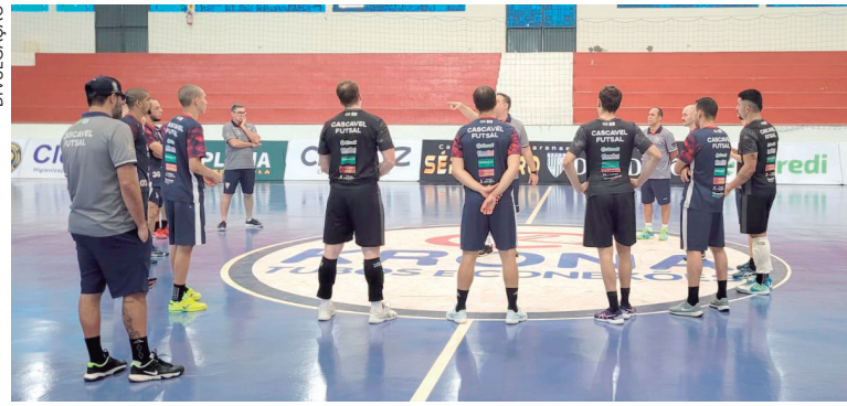
Cascavel Futsal conta com fator casa para ficar com a vaga

As partidas de ida foram disputadas no último final de semana, com duas equipes abrindo vantagem. O Campo Mourão foi até Mangueirinha e venceu por 4x2, conquistando a vantagem de poder empatar o jogo da volta marcado