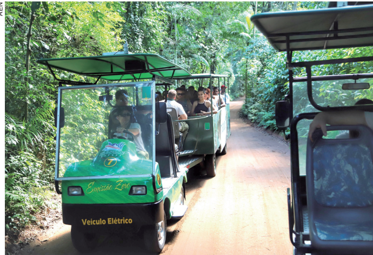
Turismo segue tendo maior impacto positivo do Paraná

Um dos destaques do crescimento do turismo no Paraná tem sido o PNI (Parque Nacional do Iguaçu), onde se encontram as cataratas em Foz do Iguaçu.