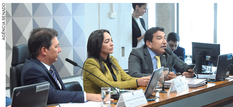
Eliziane Gama atacou Bolsonaro e membros do seu governo; Magno Malta pediu indiciamento de Lula e seus ministros