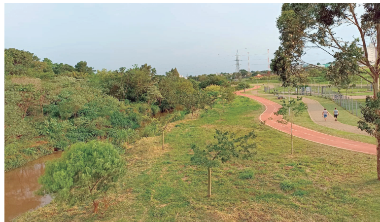
Camisa e chinelo do menino encontrados no riacho localizado nas proximidades do Ecopark, local onde o suspeito cometeu o abuso infantil: aos pais, fica o alerta de que todo o cuidado é pouco

não acompanhem nenhum estranho”, salientou a delegada. Sobre o caso, ela disse que desde que o Nucria soube do ocorrido tem se empenhado na elucidação estando com os fatos avançados. “O caso tramita em segredo de Justiça para preservar a vítima e a família até que todos os fatos sejam esclarecidos”, frisou a delegada.