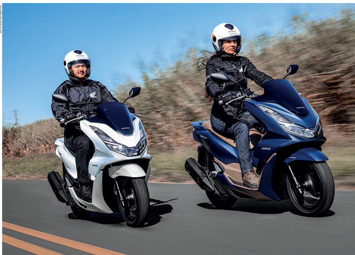
A scooter mais vendida do Brasil teve cerca de 38 mil unidades emplacadas no ano passado

A PCX completa dez anos de seu lançamento no mercado nacional e segue como uma das motocicletas mais relevantes do line up da Honda. O modelo é líder da categoria desde que começou a ser comercializado no país. Somente no último ano, foram cerca de 38 mil unidades emplacadas. No segmento de scooters, a Honda detém 65% das vendas e emplacou 70 mil unidades em 2022. Desde o lançamento, em 2013, já são mais de 280 mil unidades emplacadas da PCX e, no último mês (setembro de 2023), a motocicleta atingiu um recorde: a maior média diária de emplacamentos considerando a série histórica, com 190 unidades por dia. O modelo é produzido na fábrica da Honda, em Manaus (AM), de onde já saíram mais de 500 mil scooters. “Fácil de pilotar e cheia de estilo, a scooter mais vendida do Brasil completa sua primeira década. Com o motor mais potente, novo design, mais tecnologia e segurança, acredito que a PCX é ideal para os diversos perfis de clientes que buscam uma solução de mobilidade, conveniência e economia. O público das scooters busca inovação e é exigente, por isso a Honda está sempre atenta a isso e oferece um line up completo de scooters.”, afirma Marcelo Langrafe, Diretor Comercial da Honda Motos & CRM da Honda South America.