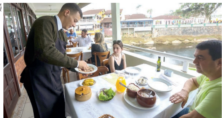
Na região Sul, Paraná é líder em volume total de serviços e também o primeiro no segmento de turismo

Entre os segmentos que puxaram o crescimento do Paraná no período, destaque para a categoria “Serviços profissionais, administrativos e complementares”, que teve variação de 17,1% no acumulado dos nove primeiros meses. Na sequência, vieram “Transportes, serviços auxiliares aos transportes e correio”, com crescimento de 13,9%, seguido por “Serviços prestados às famílias” na terceira colocação, com