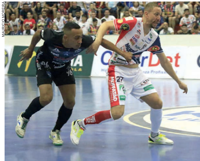
Após duelo na LNF, Cascavel encontra o Pato pelo estadual