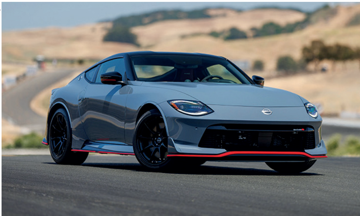
Esportivo Nissan Z é reconhecido na maior feira autopeças e preparação do mundo por seu potencial no mercado de reposição

evento mostra uma ampla gama de veículos de produção e conceitos, incluindo o Nissan Z NISMO 2024, um conceito Z Safari e uma réplica do Datsun 240Z, o bólido de rali que ajudo a consolidar o lugar do Z