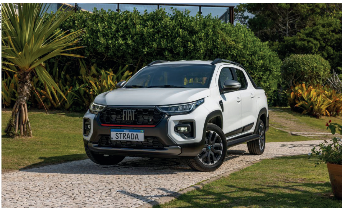
Fiat Strada deve estabelecer novos padrões de referência em termos de tecnologia, design e segurança no segmento de picapes compactas em países africanos

A Fiat Strada, com design inspirado na premiada Fiat Toro, apresenta audácia e