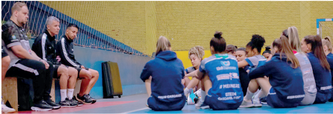
Stein precisa segurar a pressão do Taboão para conquistar o título

“Tem sido um ano muito difícil, cheio de decisões desde o mês de março. Acredito, demais, na força do grupo para encarar um adversário duro. Jogar lá é muito difícil, mas temos boas condições para