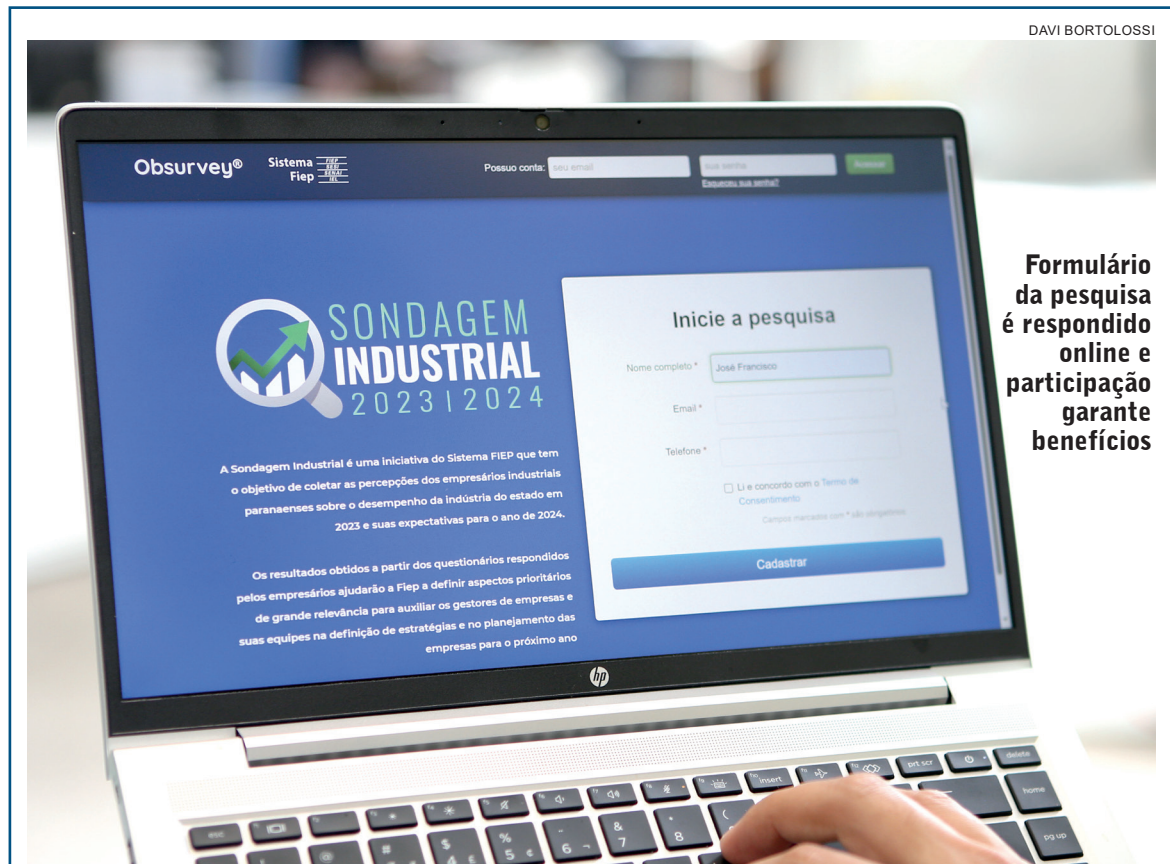
DAVI BORTOLOSI Formulário da pesquisa é respondido online e participação garante benefícios

Do montante distribuído desde a criação do programa, R$ 2,61 bilhões correspondem a devoluções de créditos do ICMS e R$ 371,9 milhões foram destinados aos prêmios dos sorteios mensais.