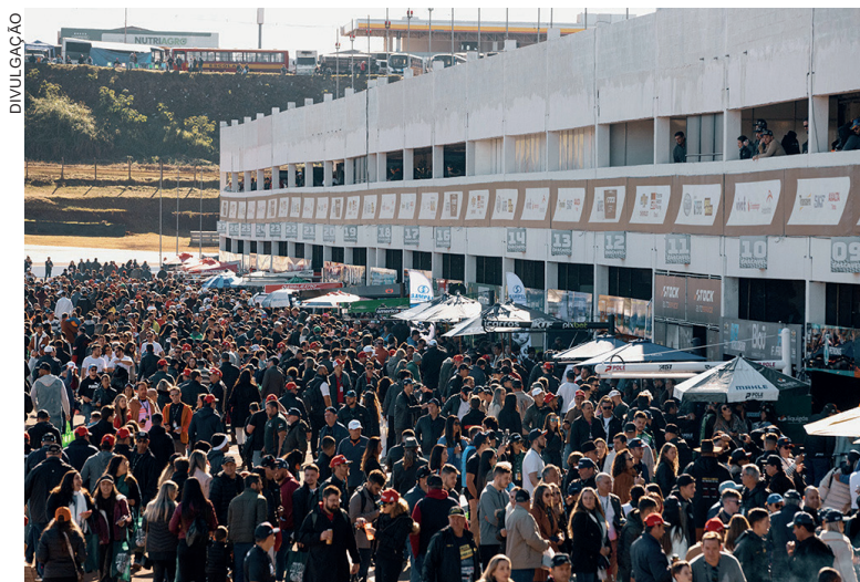
Visitação aos boxes: um dos mais aguardados momentos no fim de semana de Stock Car em Cascavel

A CBA (Confederação Brasileira de Automobilismo) anuncia neste sábado os estados e kartódromos que sediarão o Campeonato Brasileiro de Kart do próximo ano. Uma das fases deverá ser no Paraná, que poderá ser em Cascavel ou Londrina.