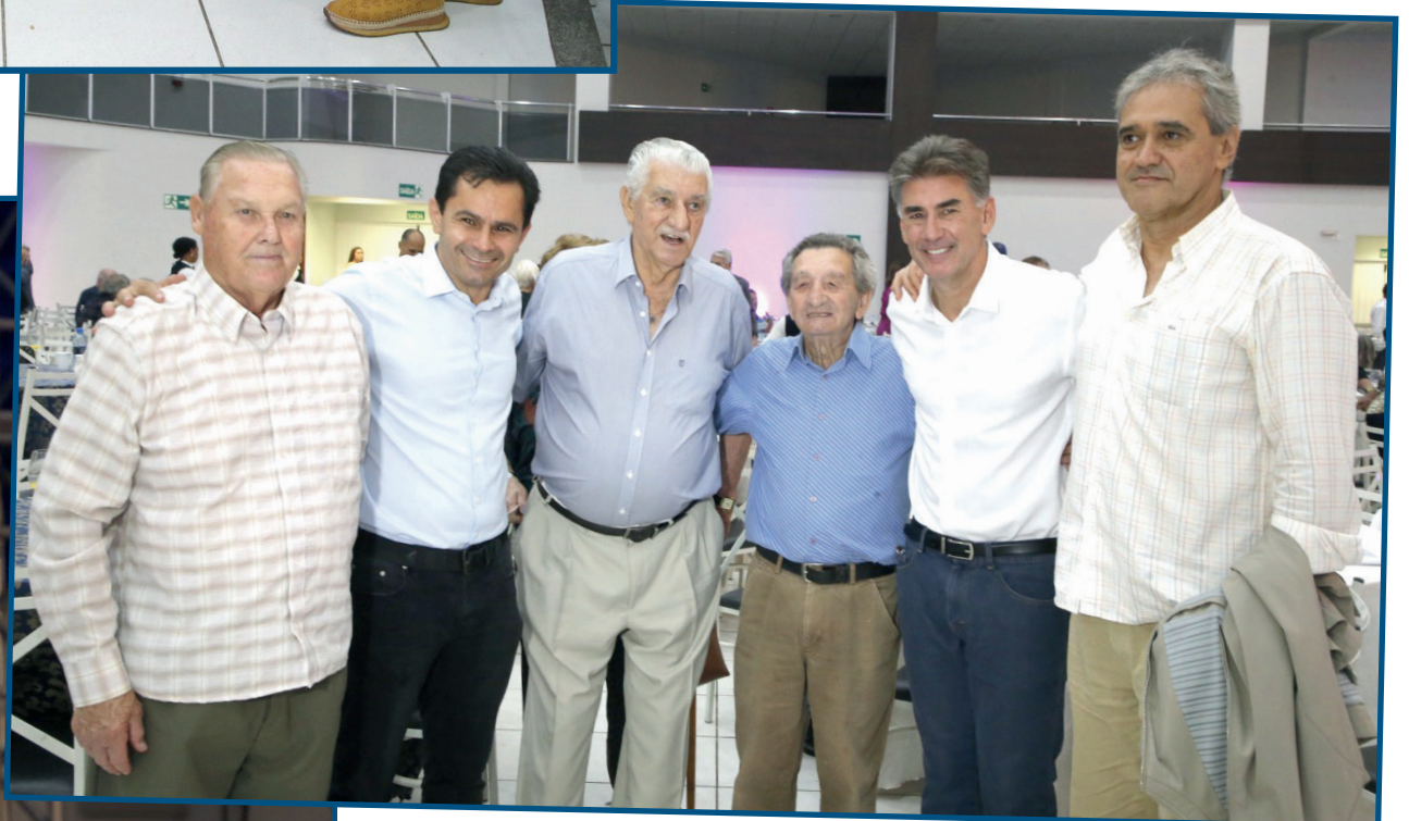
Pioneiros que comemoraram mais um ano da cidade