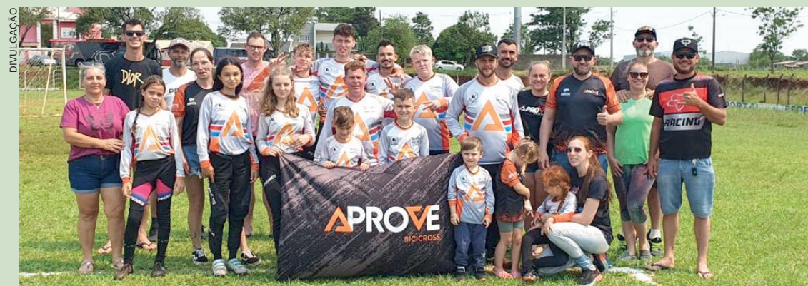
Mantendo a tradição, a equipe de bicicross de Marechal Cândido Rondon se destacou no Campeonato Paranaense. A Aprove terminou com o terceiro lugar após conquistar quatro medalhas de ouro, cinco medalhas de prata e uma de bronze. A competição aconteceu em Foz do Iguaçu e reuniu mais de 200 atletas de Marechal Rondon, Toledo, Palotina, Mercedes, Curitiba, Guarapuava, Cascavel, Foz do Iguaçu, Londrina, Apucarana, entre outros municípios. O próximo evento da equipe será o Campeonato Brasileiro, em Paulínia (SP).