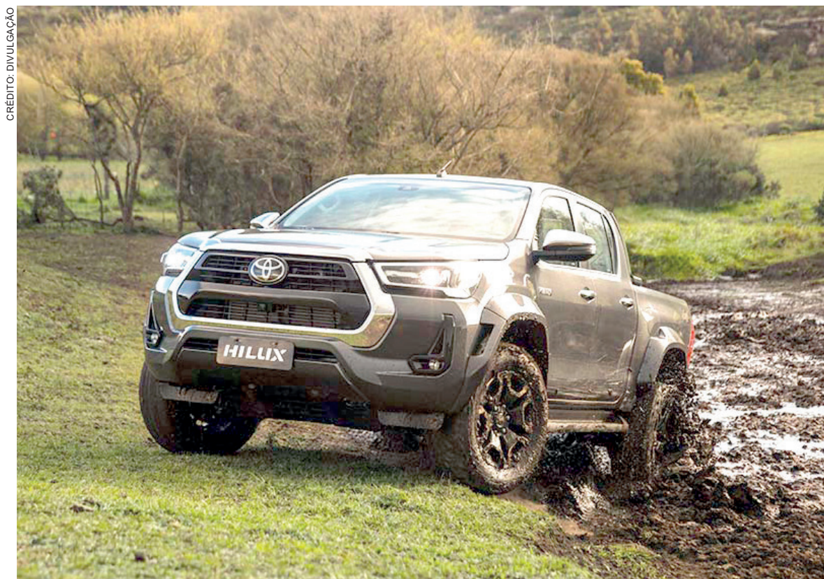
Nova configuração SRX Plus, topo de linha da picape líder de seu segmento no País, chega para complementar o já amplo portfólio da Hilux

A plataforma aprimorada dessa nova versão apresenta