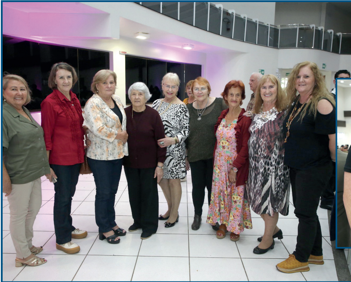
Pioneiras que estiveram presentes no Almoço que comemorou os 72 anos de Cascavel