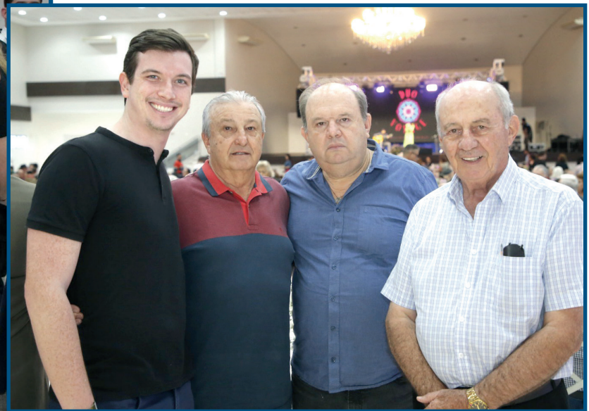
Autoridades também estiverem presentes

Cascavel completou na terça-feira, 14 de novembro, seus 72 anos e para comemorar a tão importante data, foi realizado no Clube Tuiuti, o tradicional Almoço dos Pioneiros. O evento abrilhantou a data e reuniu aqueles que aqui há décadas atrás chegaram e ajudaram a cidade a se desenvolver.