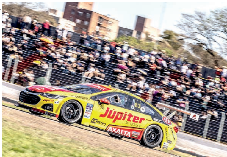
Líder com 31 pontos de vantagem, Gabriel Casagrande corre em casa em Cascavel, penúltima etapa da temporada

As atividades da Stock Car em Cascavel começam na sexta-feira