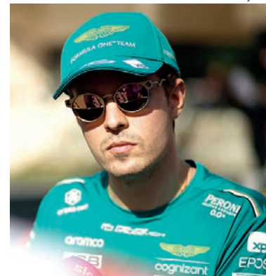
Felipe Drugovich fecha atividades em pista na terça-feira (28) nos treinos de pós-temporada, também em Abu Dhabi