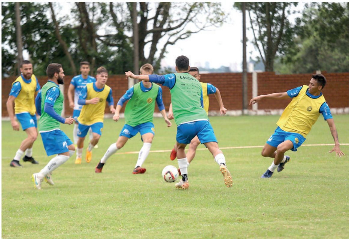
Elenco reforçado da Serpente segue preparação para o campeonato paranaense

Rio de Janeiro – A Argentina será o adversário do Brasil nas quartas de final do Mundial Sub-17, na Indonésia. A seleção argentina aplicou uma goleada sobre a Venezuela, por 5 a 0, nesta terça-feira, pelas oitavas de final, em Bandung. Balbo (contra), López, Echeverri e Ruberto (duas vezes) marcaram os gols do jogo. Brasil e Argentina vão se enfrentar na próxima sexta-feira (24), às 9h (horário de Brasília), em Jacarta. A seleção brasileira terá tido um dia a mais de preparação, já que jogou na segunda-feira contra o Equador. O vencedor do clássico sul-americano avança para a semifinal contra quem passar de Espanha x Alemanha.