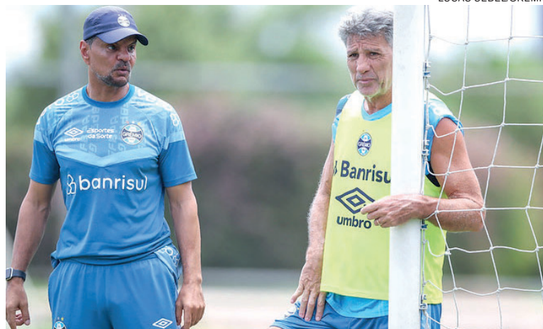
Grêmio abre reta final da rodada para definir se segue luta por vagas

Para fechar a rodada, o Bragantino também decide a sua vida nesta quinta. Com vaga garantida na Libertadores, o time está entre os candidatos ao título, pelo menos matematicamente. Apesar de depender de algumas combinações, o Fortaleza ainda tem uma pequena ameaça com a ZR e também precisa de vitória essa noite.