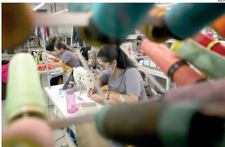
Setor têxtil é um dos beneficiados pela desoneração para manutenção dos postos de trabalho

A Frente Parlamentar do Empreendedorismo também se reuniu com membros da Confederação Nacional do Transporte, com o objetivo de unir forças aos deputados e senadores pela derrubada do veto. O presidente da FPE, deputado