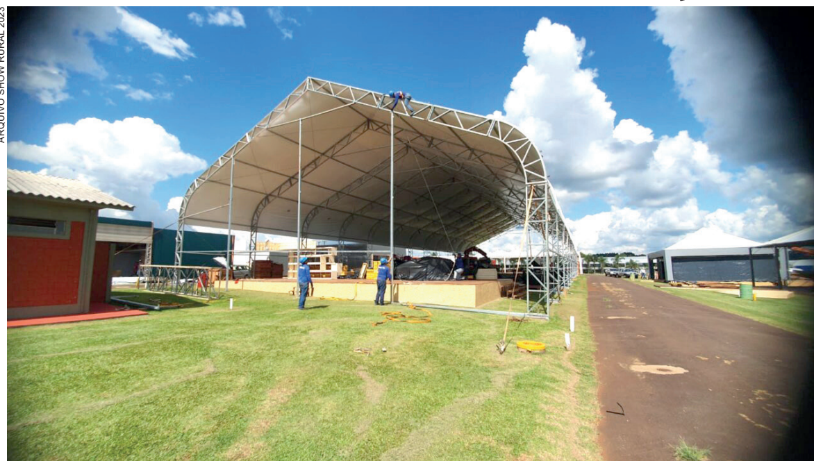
Montagem dos estandes é uma das etapas de preparação mais importantes do evento

Uma das boas notícias é que, pela primeira vez, todo o trecho de rodovia que co-