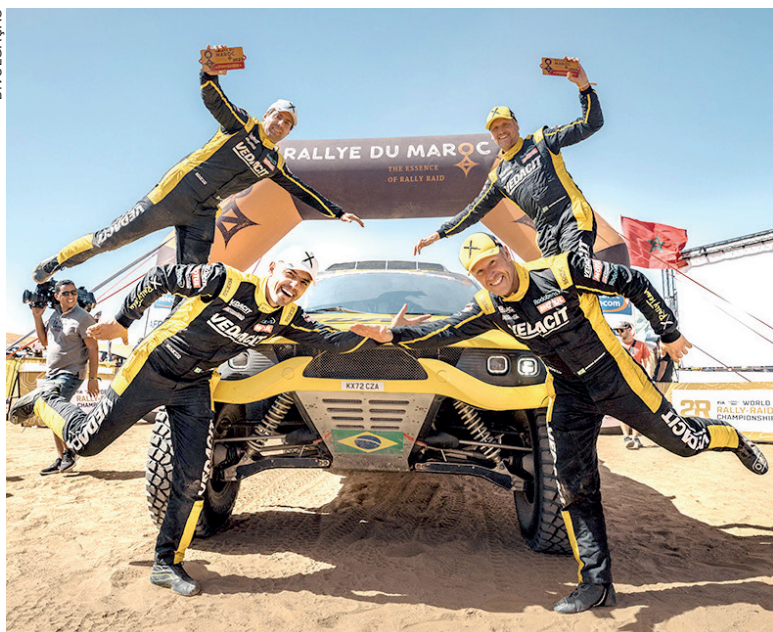
A equipe X Rally comemora 25 anos com disputa do Dakar na Arábia Saudita

pela primeira vez e terminei no pódio, algo inimaginável e muito além das expectativas”, relembrou o brasileiro. “Agora na equipe principal da TGR, quero retribuir a confiança que foi depositada em mim e fazer um bom Dakar. Quero estar à altura, e estou pronto para os desafios que estão por vir. Eu me preparei a vida toda para isso”, completou.