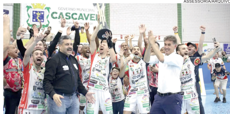
O último título estadual do Cascavel foi em 2021, quando conquistou a Série Ouro pela 7ª vez

A reapresentação do Cascavel Futsal será nesta quarta-feira (10), às 16h30. Os torcedores vão notar que a equipe está com 'caras novas' e bastante diferente em relação ao time que terminou a temporada passada. A Serpente anunciou a chegada e 11 reforços, sendo dez jogadores e um integrante