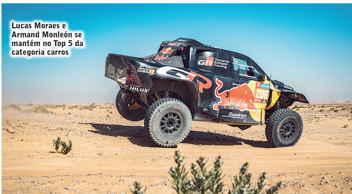
Lucas Moraes e Armand Monleón se mantém no Top 5 da categoria carros

Nesta terça-feira, o duo do time patrocinado pelas empresas Divino Fogão, Can-Am, Motul e Quadrijet chegou na sétima posição e subiu para o terceiro