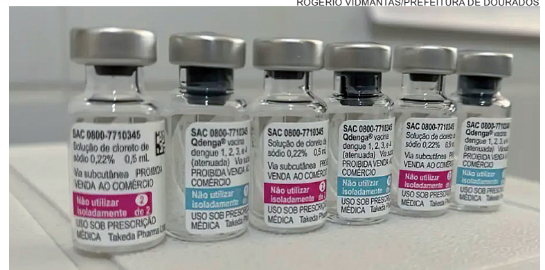
ROGERIO VIDMANTAS/PREFEITURA DE DOURADOS