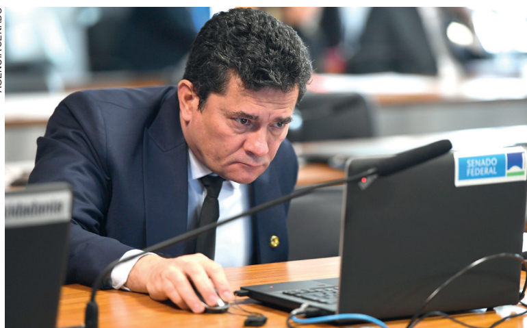
Se for cassado pela Corte paranaense, Sérgio Moro poderá recorrer ao TSE

Em 2021, Moro estava no Podemos e realizava atos de pré-candidatura à Presidência da República. Em seguida, ele deixou o partido e passou a fazer campanha para o Senado. De acordo com a acusação, houve “desvantagem ilícita” em favor dos demais concorrentes ao cargo de senador diante dos “altos investimentos financeiros” realizados antes de Moro se candidatar ao Senado.