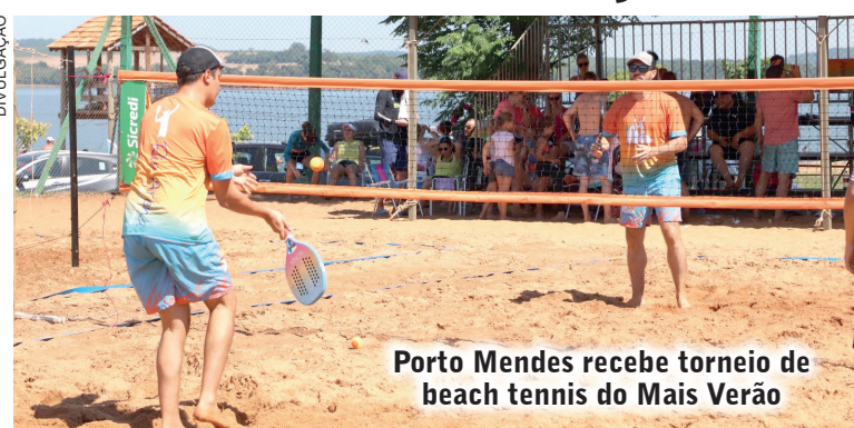
Porto Mendes recebe torneio de beach tennis do Mais Verão

No sábado de manhã as disputas serão na categoria