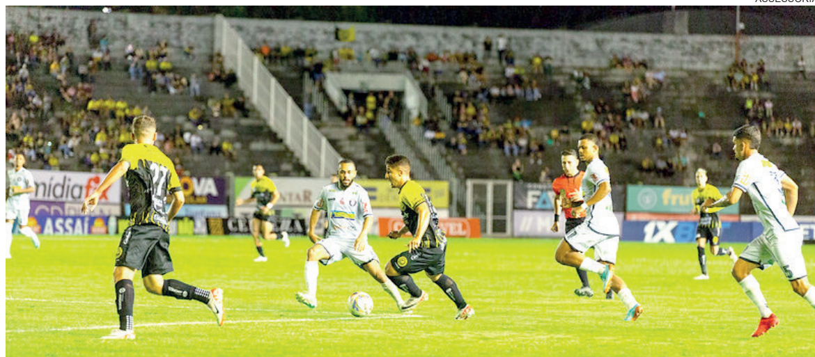
Cascavel decide posição na tabela diante do Coritiba

Os mesmos times que lutam pela última vaga também correm o risco do rebaixamento em caso de derrota. O atual lanterna, Galo Maringá, ainda pode se salvar deste que São Joseense, PSTC e Andraus não vençam seus jogos.