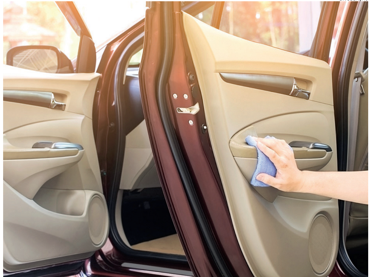
A limpeza profissional é crucial para preservar a durabilidade e aparência do interior do veículo

Atos preventivos podem auxiliar na durabilidade e evitar um estrago maior quando em contato com areia, água do mar e maresia. A blindagem atua nas tramas do tecido, protegendo as fibras e mantendo a cor, além de facilitar a manutenção diária já que não permite que a poeira se acumule com tanta facilidade, além de proteger contra a queda de líquidos e revitalizar a cor. O procedimento é realizado rapidamente, em torno de 30 a 40 minutos”, completa Fritz.