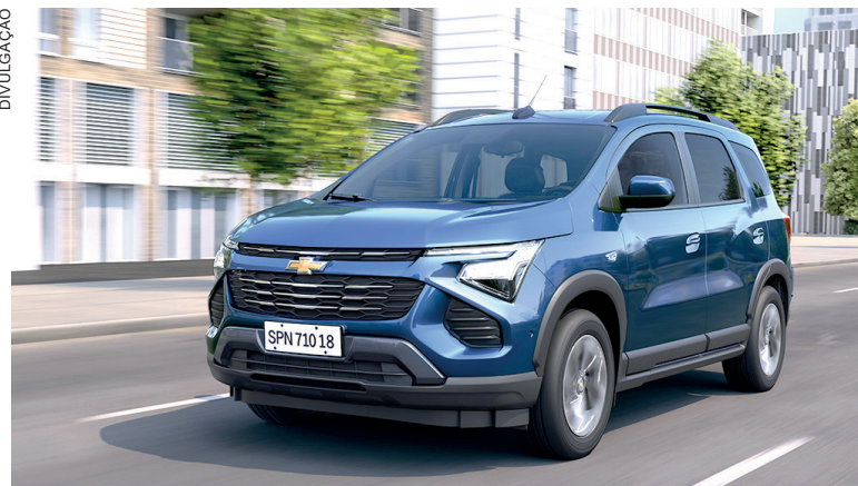
O Novo é o primeiro dos seis grandes lançamentos que a Chevrolet promoverá em 2024 no Brasil