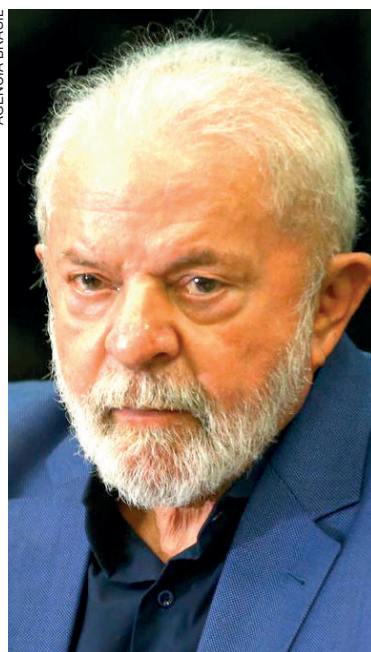
TRIBUNAL DE HAIA

Apesar das especulações de que o pedido teria “nascido morto”, em entrevista ao programa Braddock Show, Zambelli disse que o presidente da Câmara, Arthur Lira (PP-AL), recebeu o assunto com “com uma energia boa”, alimentando as expectativas de que o pedido tramitaria na Casa, lembrando que no processo contra a ex-presidente Dilma, o pedido demorou pelo menos um ano para ser protocolado.