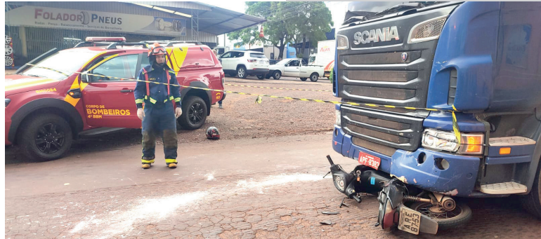
LUIZ FELIPE MAX/SOT

Prevenção e Controle de Acidente de Trânsito) de Cascavel, disse que nos próximos dias os membros do comitê estarão definindo as ações que serão traçadas como prioridade para 2024. Segundo Moura, desde janeiro até agora, somando as ruas do perímetro urbano e as rodovias, Cascavel já contabiliza um total de 5 mortes, sendo 2 na cidade e 3 na rodovia. Nos dois primeiros meses do ano passado, já são 6 mortes no trânsito. “O Cotrans vai analisar estes óbitos e fazer o nosso planejamento anual, mantendo sempre a missão de reduzir os sinistros e não ter o registro de óbitos”, frisou.