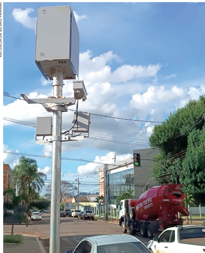
KATJUSCIA DA SILVA PARANÁ

registrados um total de 134.689 infrações em todos os pontos.