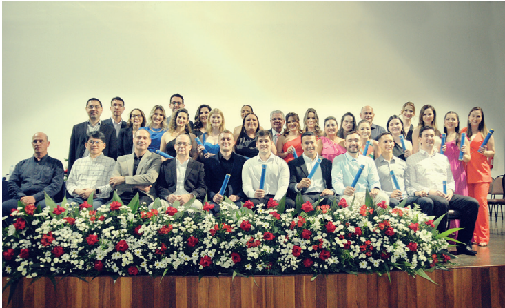
Foto geral com formandos de residência e seus professores

Na última sexta-feira (23), no Auditório da Unioeste, aconteceu a formatura de 26 novos médicos residentes.