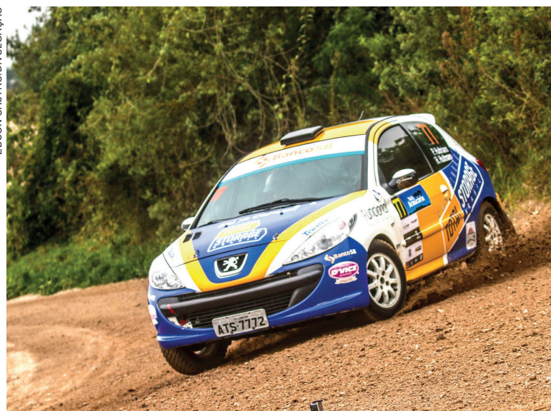
Guaratuba volta a sediar o Rali das Praias, tradicional competição nos anos 80 e 90

O Rally das Praias 2024 é uma realização do RPMC – Rallye & Pista Motor Clube, com apoio da Prefeitura Municipal de Guaratuba, Adetur, patrocínio da Total Storage Brasile e supervisão da FPrA (Federação Paranaense de Automobilismo). Mais informações no site www.rallyclube.com.br .