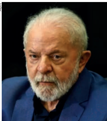
Para 45,78% dos entrevistados considera administração de Lula "ruim"

Diferente de Paranhos e Ratinho Junior, em Cascavel, o presidente Lula não teve uma votação expressiva nas eleições de 2022. No primeiro turno, por exemplo, Lula fez 31,92% dos votos, já no segundo turno, apenas 33,10% dos votos, ou seja, apenas 2% a mais no confronto direto com Bolsonaro. Assim como