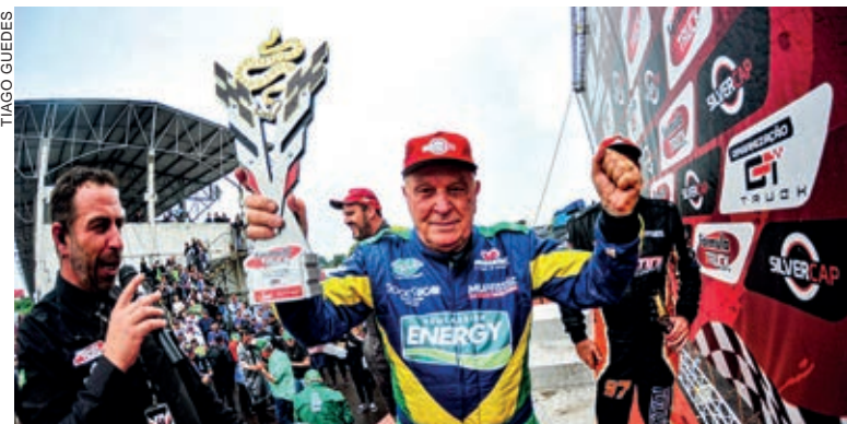
Pedro Muffato é o atual campeão da categoria GT Truck na Fórmula Truck

livres, que serão realizados nesta sexta-feira e sábado. “O caminhão se mostrou competitivo no único treino que realizamos em Cascavel. Mas ainda precisa de ajustes. O trabalho de desenvolvimento é árduo, mas estamos confiantes de que teremos muitas conquistas com este caminhão”, acentua Pedro Muffato, que aos 83 anos, busca o bicampeonato na Fórmula Truck.