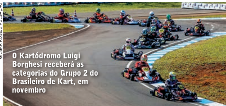
O Kartódromo Luigi Borghesi receberá as categorias do Grupo 2 do Brasileiro de Kart, em novembro

Os quatro primeiros colocados nas etapas classificatórias das categorias OK Júnior e OK estarão garantidos na Final, em agosto, em data e local a serem anunciados brevemente. Por fim, o vencedor da Final em cada categoria terá vaga para