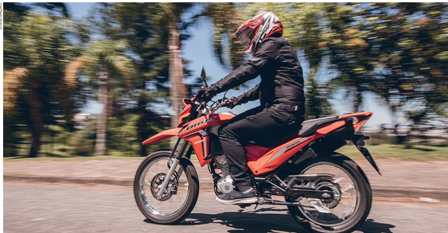
Ao viajar de moto, os cuidados devem ser redobrados, com distribuição equilibrada do conteúdo do bagageiro

“A direção defensiva deve ser priorizada e um ponto importante no caso de deslocamentos de média e longa duração são as paradas regulares para descanso. Somente essas pausas podem restabelecer as