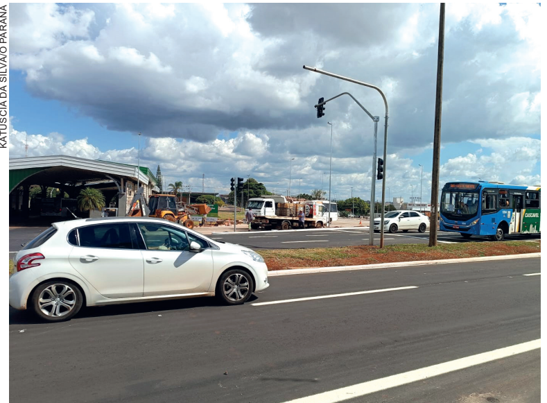
KATJUSCIA DA SILVA/OPARANÁ

Também continuam os trabalhos para abertura da