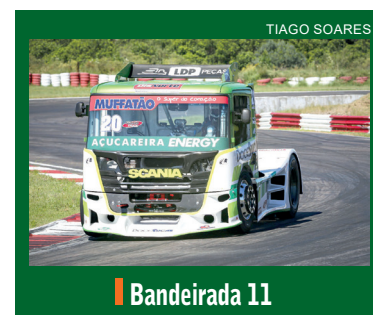
| Bandeirada 11

formatadas no Pacto Regional para Segurança Pública e Enfrentamento ao Crime Organizado, debatidas pelos governadores na 10ª reunião do Cosud. São quatro propostas para o endurecimento no combate ao crime organizado encaminhadas pelos governos do Paraná, Santa Catarina, Rio Grande do Sul, São Paulo, Rio de Janeiro, Minas Gerais e Espírito Santo. | Política 5