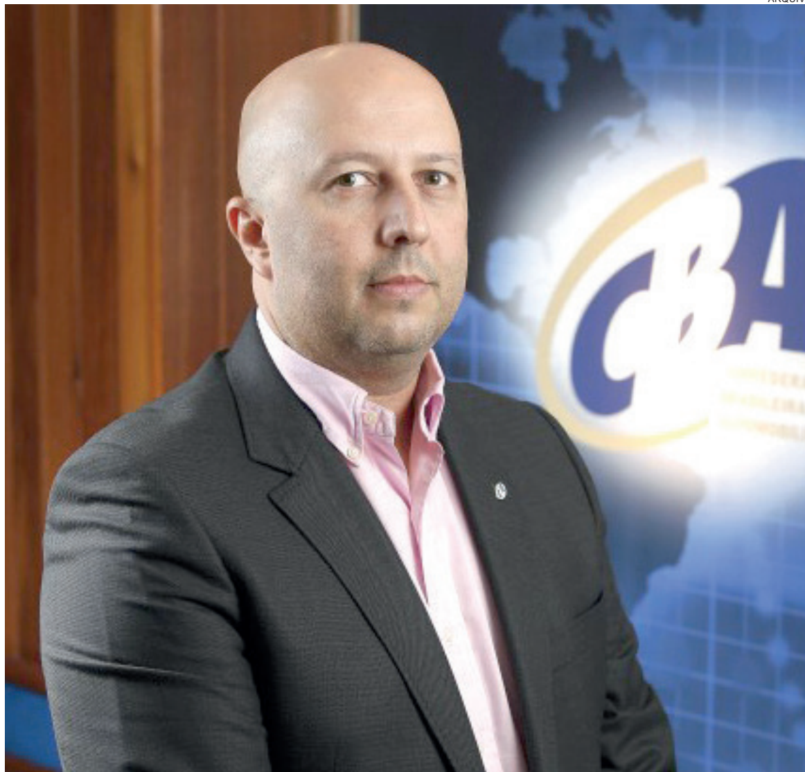
Dadai presidiu a CBA de março de 2017 e janeiro de 2021

Quando questionado que não se deve convidar o ex-presidente da CBA e o atual para a mesma festa ou corrida, ele é enfático. “Não tenho problema nenhum de estar no mesmo