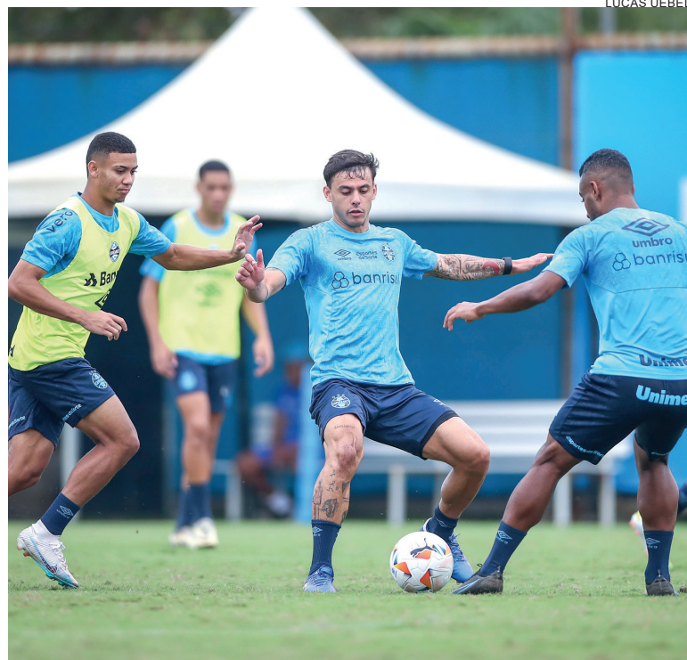
Grêmio precisa vencer para deixar a lanterna do grupo

O Grêmio é lanterna do grupo com zero ponto, enquanto o rival divide a liderança com o Huachipato, com quatro.