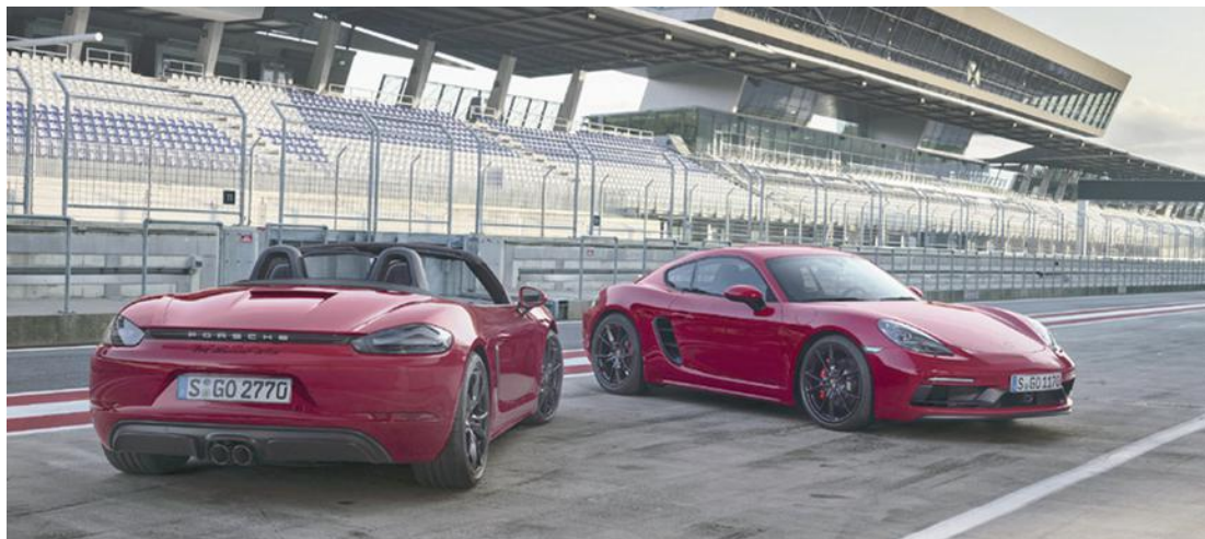
Visualmente, o 718 Cayman GTS se diferencia pelos faróis dianteiros e lanternas traseiras escurecidas

Visualmente, o 718 Cayman GTS se diferencia pelos faróis dianteiros e lanternas traseiras escurecidas, inscrições em preto e saídas de escape pretas centralizadas, entre outros detalhes. O sistema de escape esportivo faz o som do motor ser mais encorpado, enfatizando o caráter da ver-