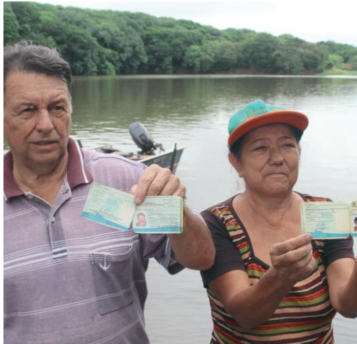
Orgulhoso, casal mostra carteirinha indicando cinco décadas de profissão