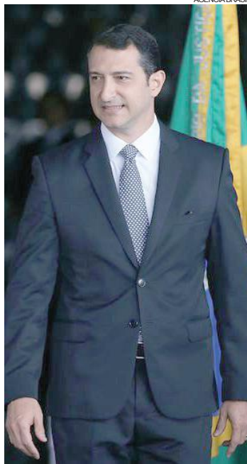
Galloro convoca especialistas em combate ao crime organizado para formar cúpula da PF

“Lisonjeado” com a presença de um presidente na cerimônia de posse, em sua primeira entrevista coletiva, Segovia criou sua primeira polêmica à frente do cargo ao