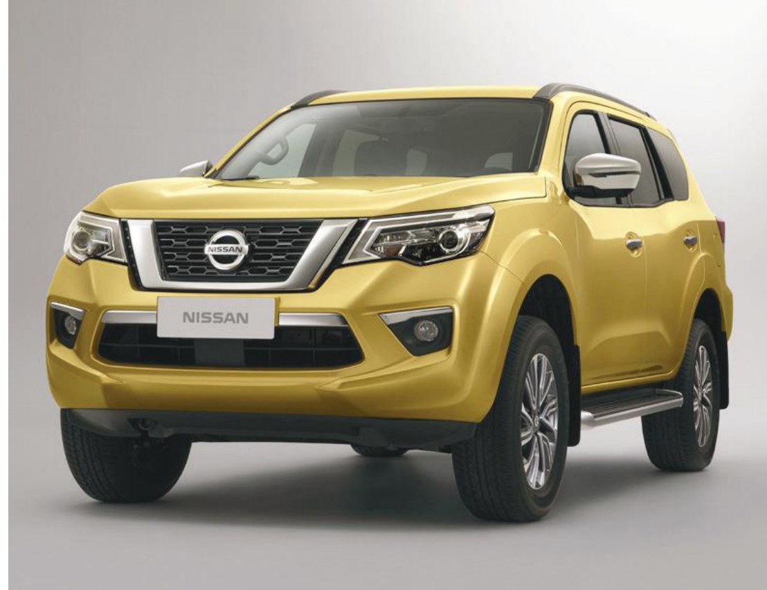
• O inédito Nissan Terra foi projetado para oferecer capacidades 4x4 robustas para a China e mercados selecionados em toda a Ásia

O inédito SUV sobre chassi Nissan Terra será o primeiro veículo da divisão de comerciais leves (LCV) da Nissan a ser lançado dentro do plano de médio prazo da empresa, o "Nissan M.O.V.E 2022", quando o veículo chegar ao mercado chinês nos próximos meses.