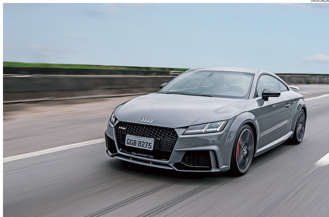
O esportivo Audi TT RS traz motor de cinco cilindros, que desenvolve 400 cv e acelera de 0 a 100 km/h em 3,7 segundos

Chega ao país o novo Audi TT RS Coupé, versão mais apimentada do TT Coupé. Equipado com motor 2.5 de cinco cilindros capaz de desenvolver 400 cv, o esportivo tem desempenho poderoso, dirigibilidade incrível e oferece boa estabilidade e segurança. Seu preço sugerido é de R$ 424.990.