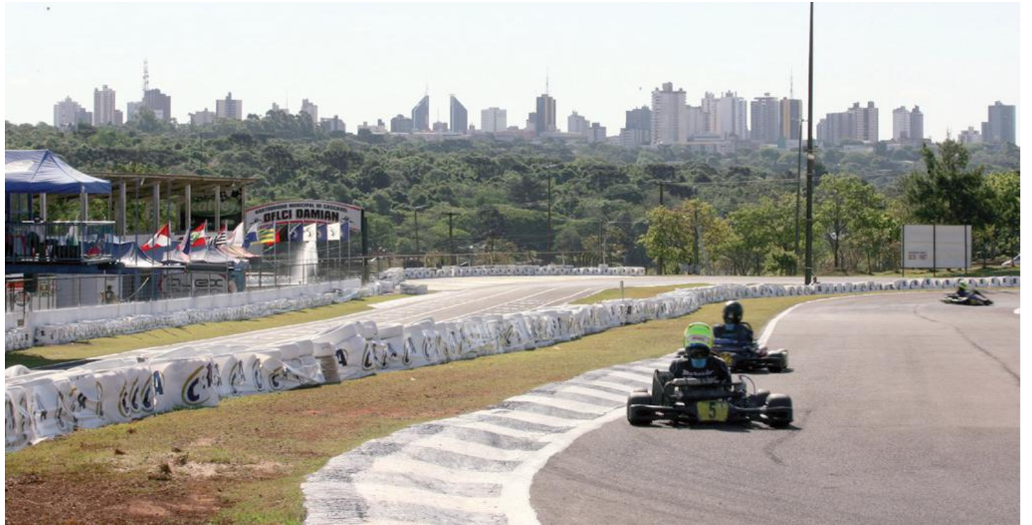
O Kartódromo Delci Damian recebe kartistas da região oeste para a etapa de abertura do Citadino de Cascavel

O Citadino de Kart de Cascavel será disputado em cinco etapas. Além da etapa de abertura, neste fim de semana, as demais serão realizadas em 5 e 6 de maio, 4 e 5 de agosto e 15 e 16 de setembro.