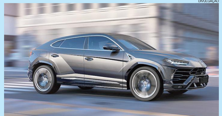
O Lamborghini Urus é o utilitário esportivo potente do mundo no segmento, equipado com motor V8 Biturbo de 4,0 litros

O veículo já encomendado chegará ao país no último trimestre do ano e as próximas unidades, quando encomendadas, podem ser entregues próximas do final de 2018. Com mais de 10 anos na área de importação independente a Direct Imports é conhecida por ser a primeira do Brasil a trazer exclusividades como o Corvette Stingray, Dodge Hellcat, entre outros. A loja está localizada na Av. Europa, 873.