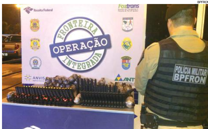
Apreensão de munições é recorde em apenas um mês

ensão de armas e munições no início deste ano, segundo o BPFron, tem como principal motivo a união das forças policiais. Com mais gente atuando na fronteira, a área de cobertura é maior e a fiscalização mais acirrada, principalmente para quem vem do Paraguai.