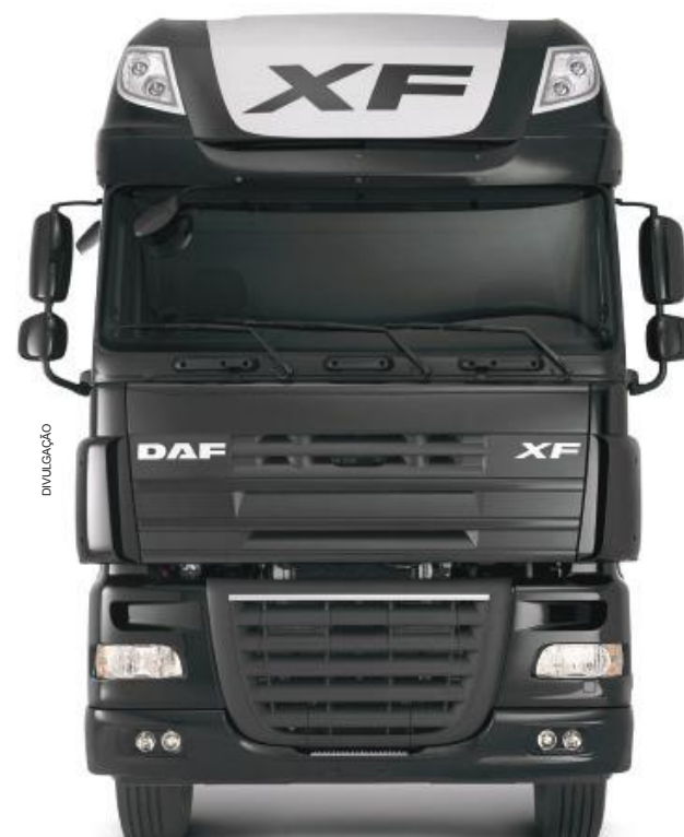
• No XF105, a cabine Space contará com o opcional de defletores laterais para atender as demandas do equipamento para diferentes implementos

As versões 2018 tanto do XF105 como do CF85 passam ainda a ser ofertados de série com desligamento automático do motor. O dispositivo funciona em caso de inatividade operacional de cinco minutos (marcha lenta) em todos os veículos. Com alta demanda de mercado, visa reduzir o consumo de combustível. O condutor é alertado previamente do estado ocioso prolongado e o sistema desliga automaticamente o motor.