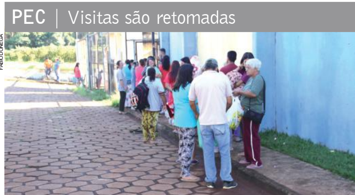
PEC | Visitas são retomadas Mesmo sob protesto dos agentes penitenciários e da Comissão de Direitos Humanos da OAB (Ordem dos Advogados do Brasil), as visitas aos detentos da PEC (Penitenciária Estadual de Cascavel) foram retomadas ontem e seguirão durante o fim de semana. Ontem, das 9h às 15h, familiares fizeram fila em frente à penitenciária, com sacolas nas mãos, para levar alimentos não perecíveis aos presos. As visitas foram separadas por galerias, para garantir a segurança, considerando que a unidade foi destruída na rebelião em novembro do ano passado. Desde então as visitas estavam suspensas, justamente por falta de condições do local.