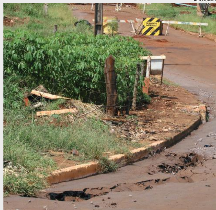
Depois da chuva intensa, ponte é reconstruída no Bairro Morumbi

Cascavel - A chuva que atingiu Cascavel na noite de quinta-feira (1º) assolou também outros municípios da região oeste do Estado. Foi muita água, revela o Instituto Meteorológico Simepar. Apenas em Cascavel choveu 103,2 milímetros, quase que o total da média histórica para todo o mês de março (117 mm).