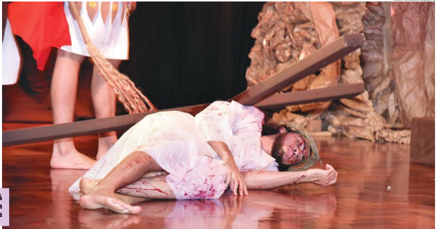
Paixão de Cristo será encenada durante a Cantata de Páscoa

A tradicional celebração do rito de lava-pés e o sacrifício de Jesus são alguns dos trechos bíblicos encenados durante o evento.