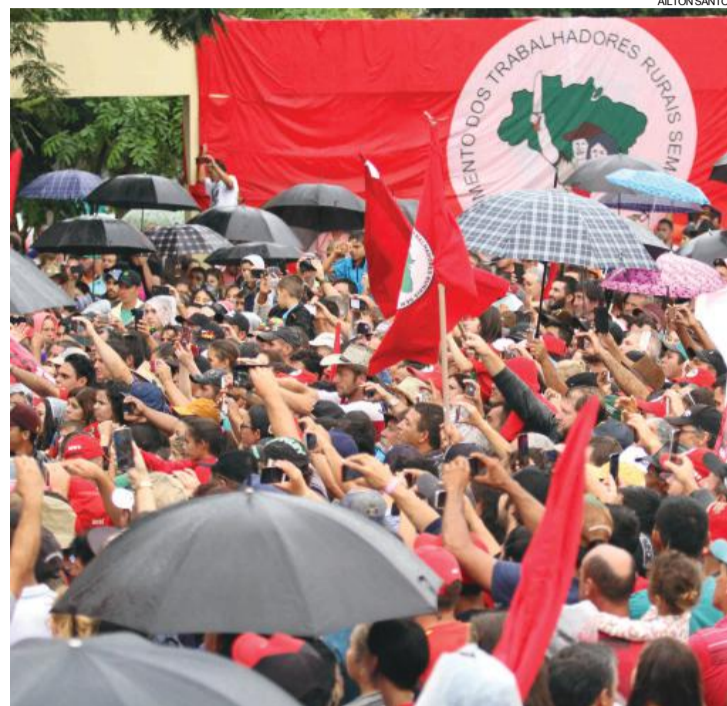
Debaixo de chuva, povo esperou quatro horas por início do ato de Lula

O evento começou com quase uma hora de atraso. De acordo com a senadora e presidente nacional do PT, Gleisi Hoffmann, o atraso aconteceu por precaução em função dos protestos que a caravana enfrentou na Região Sul. “Esse povo é de luto e de resistência