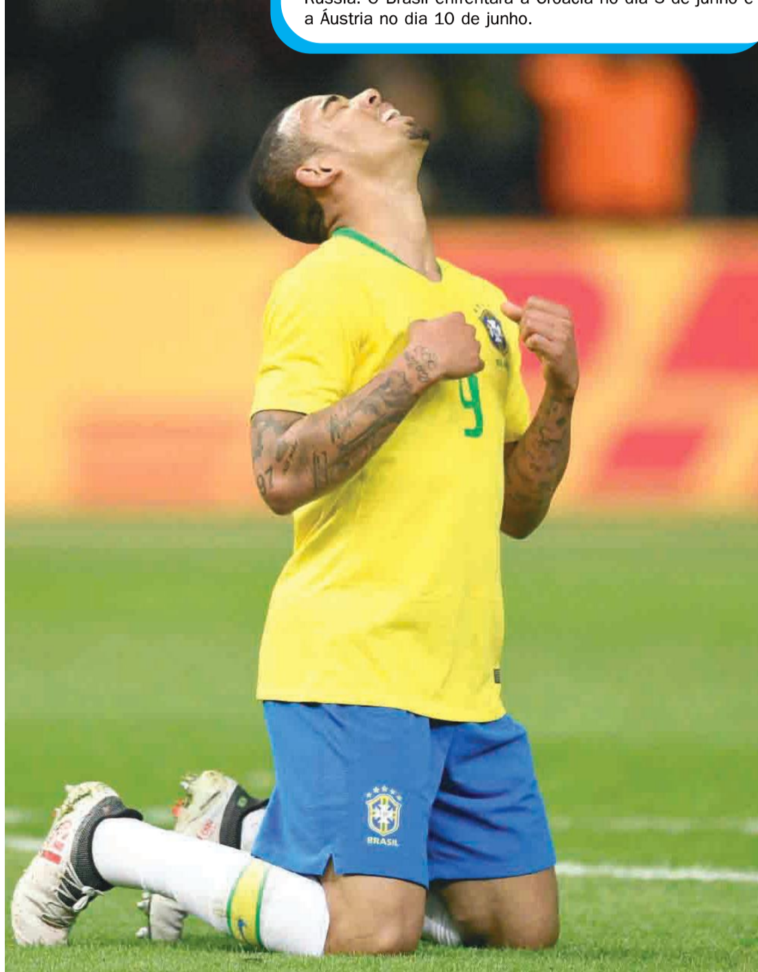
Gabriel Jesus comemora após ter marcado de cabeça contra a Alemanha