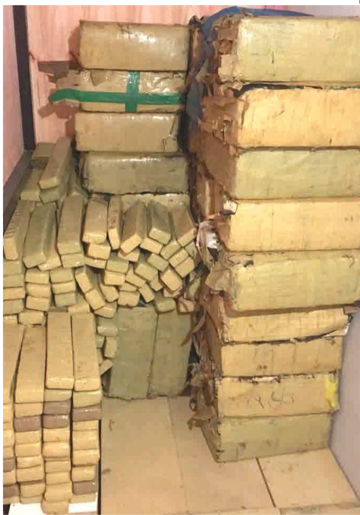
Maconha tinha como destino final Fortaleza