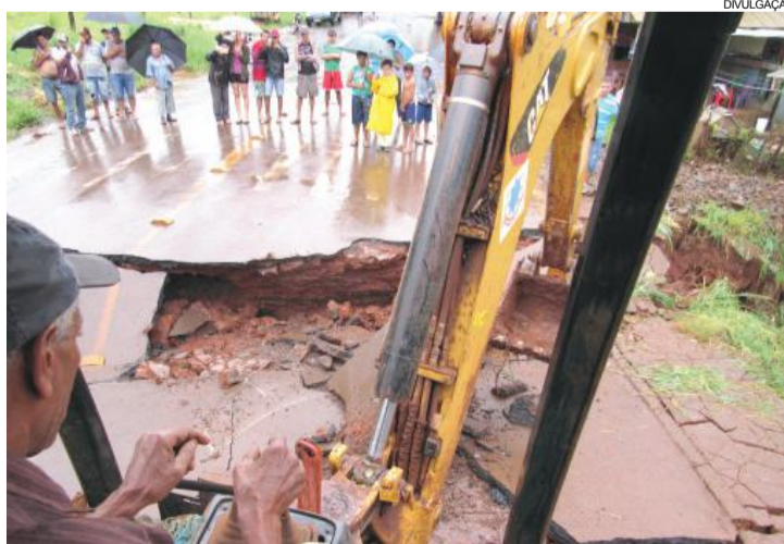
As equipes já estão trabalhando, mas a travessia está impedida