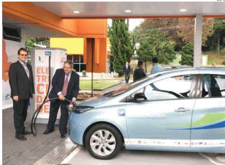
Previsão é instalar eletropostos em Foz, Medianeira, Cascavel, Laranjeiras do Sul, Guarapuava e Irati

O projeto da eletrovia é uma parceria entre a Copel e a Itaipu Binacional. O inves-