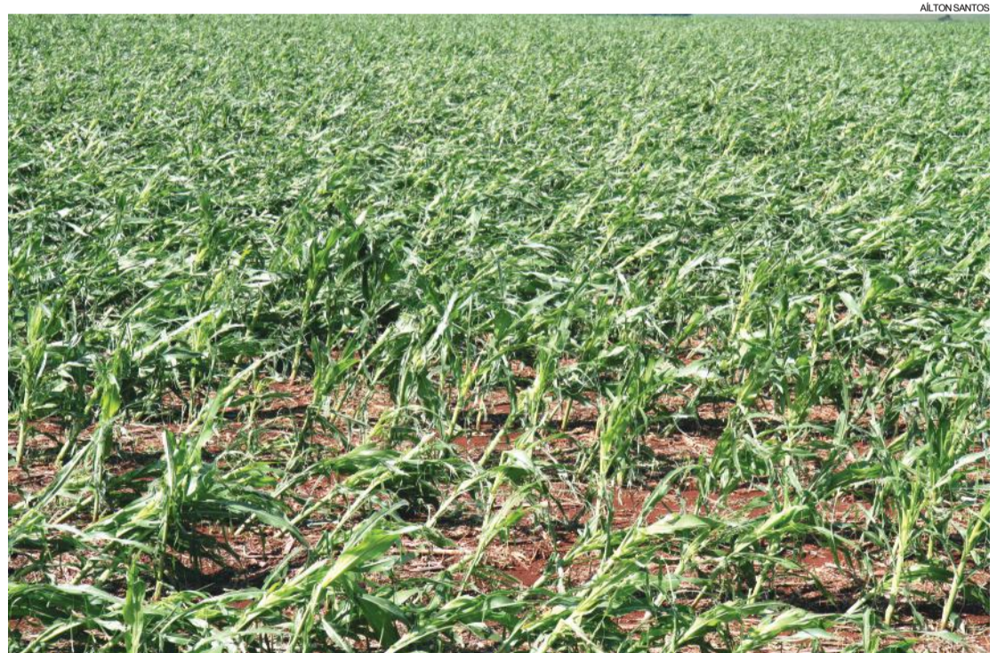
Excesso de chuva castiga o milho, que em muitas partes "tomba" devido à água e ao vento

Em todo o oeste a área destinada à produção de milho safrinha, a principal cultura de inverno, é de 734,5 mil hec-