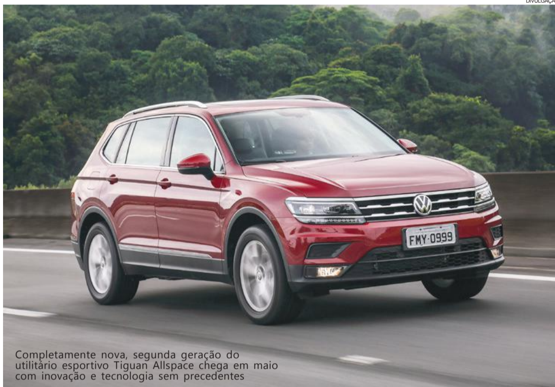
Completamente nova, segunda geração do utilitário esportivo Tiguan Allspace chega em maio com inovação e tecnologia sem precedentes

O Tiguan Allspace será fabricado na planta de Puebla, no México, e estará disponível nas configurações com cinco e sete lugares – trata-se do primeiro SUV da Volkswagen no Brasil com essa capacidade.