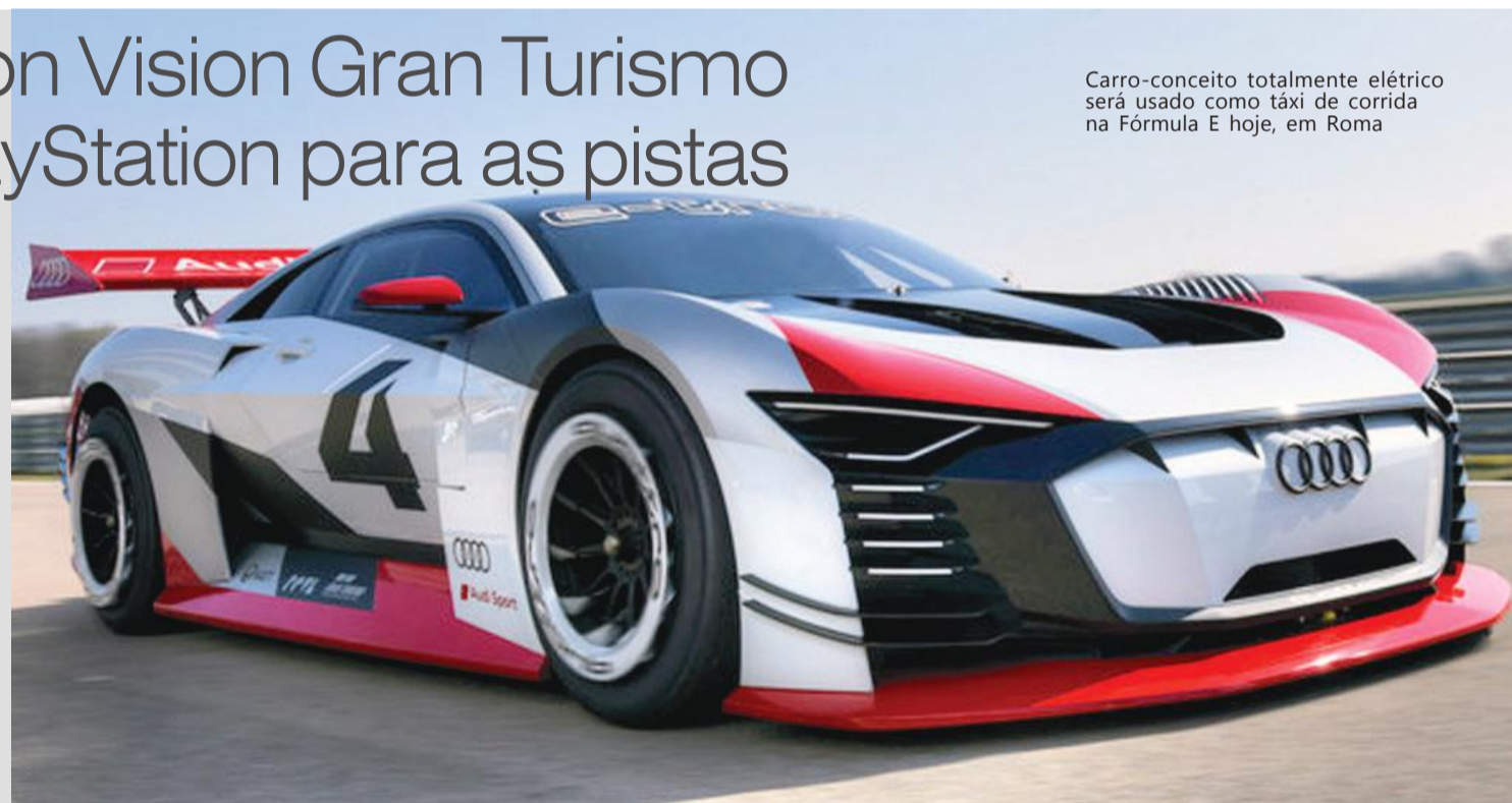
Carro-conceito totalmente elétrico será usado como táxi de corrida na Fórmula E hoje, em Roma