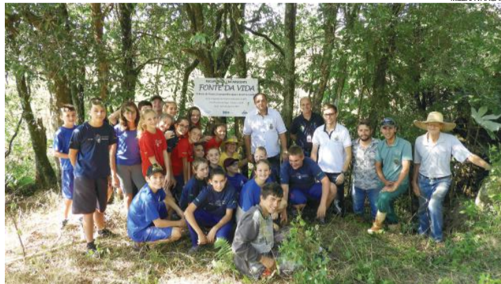
Poder Público, Itaipu e estudantes: união em prol da recuperação de nascentes no município quatropontense