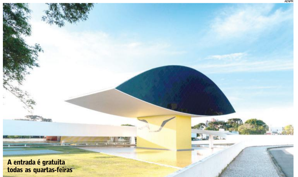
A entrada é gratuita todas as quartas-feiras

O MON (Museu Oscar Niemeyer), em Curitiba, realiza várias atividades na próxima semana, nos dias 15, 17 e 18 de abril. A entrada é gratuita todas as quartas-feiras.