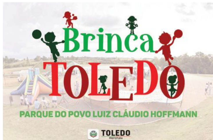
A criançada tem diversão garantida no domingo

mingo. É prazeroso tanto para os pequenos quanto para nós, já que todo o mundo tem aquela 'criança interior'", afirma. O Brinca Toledo vai estar no Parque do Povo a partir das 15h30 e funciona até as 18h30. Como os brinquedos são montados ao ar livre, caso o tempo esteja chuvoso será necessário cancelar a programação. Podem participar crianças até 13 anos. A realização é da Smel (Secretaria Municipal de Esportes e Lazer).