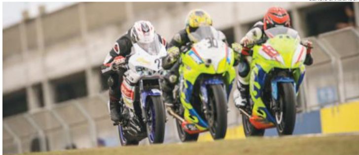
Equilíbrio é um dos pontos altos da Copa Paraná/Sul de Motovelocidade

A programação da segunda etapa da Copa Paraná/Sul de Motovelocidade terá início hoje no Autódromo Zilmar Beux. A promoção e a organização são de Orlei Silva, com supervisão da FPM (Federação Paranaense de Motociclismo) e da CBM (Confederação Brasileira de Motociclismo).