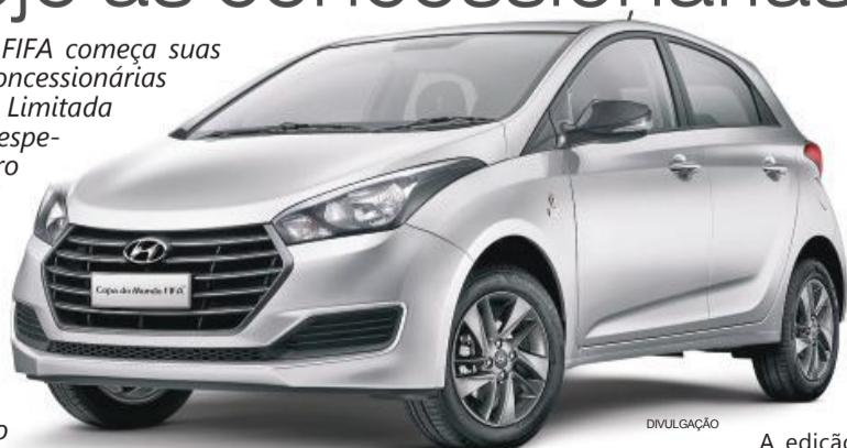
A edição comemorativa apresenta quatro versões, com preços entre R$ 49.990 e R$ 65.990

O HB20 Copa do Mundo FIFA será vendido nas carrocerias hatch e sedã, com motorizações 1.0l com câmbio manual e 1.6l com câmbio automático, sempre baseado na configuração Comfort Plus e acrescido de novidades tanto na parte externa quanto interna. Além de conteúdo exclusivo, todos os clientes que adquirirem a série especial ganharão uma Telstar 18, réplica da bola oficial da Copa do Mundo da FIFA Rússia 2018.