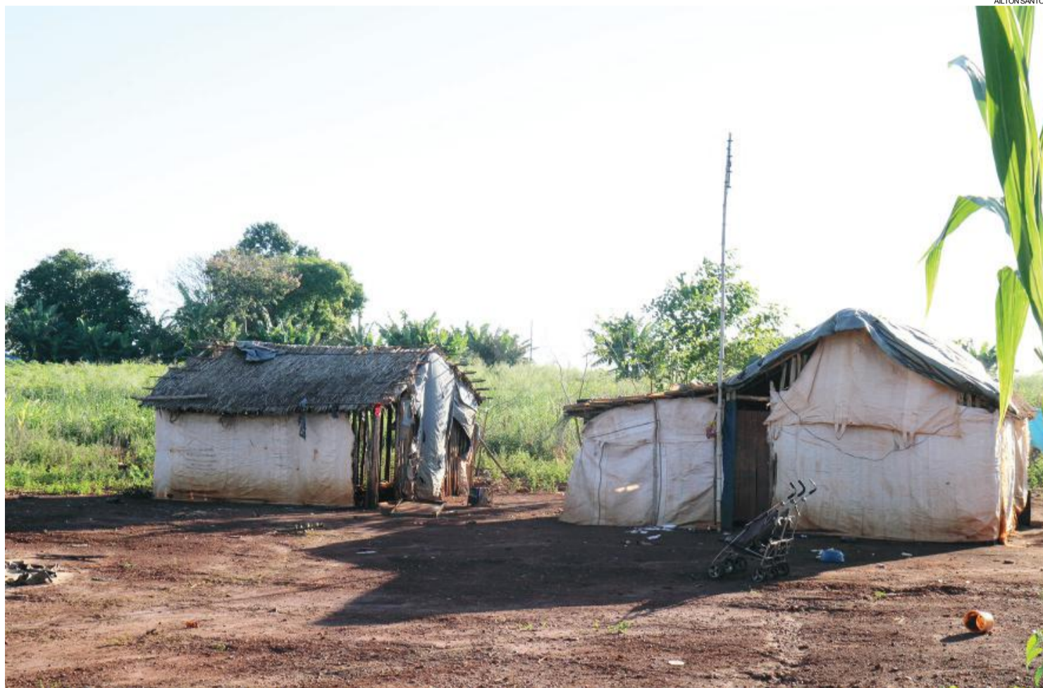
Levantamento feito pela Assistência Social nesta semana apurou que há hoje em Santa Helena 141 indígenas

Segundo relato de participantes do encontro, em momento algum os líderes dessas aldeias deram posicionamento favorável à mudança e afirmaram que essa decisão precisa ser tomada em consenso com a comunidade indígena. Dessa forma, foi agendada provisoriamente para o dia 23 de abril uma reunião em uma aldeia em Diamante.