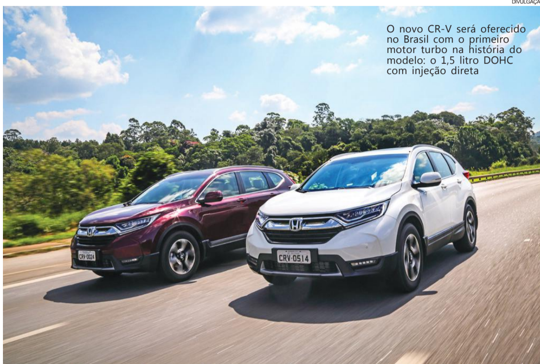
O novo CR-V será oferecido no Brasil com o primeiro motor turbo na história do modelo: o 1,5 litro DOHC com injeção direta

A dianteira com design como se fosse moldado pelo vento inclui exclusivos faróis full LED, bem como as luzes de neblina também em LED, o sistema inaugurado pela Honda Active Shutter Grille (fechamento ativo da grade) que reduz o arrasto aerodinâmico, rodas de alumínio de 18 polegadas, colunas A mais estre-