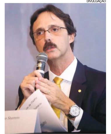
Stamm assumiu em março do ano passado e rapidamente imprimiu seu estilo agregador

Em seu comando também, a Itaipu e a Amop (Associa-