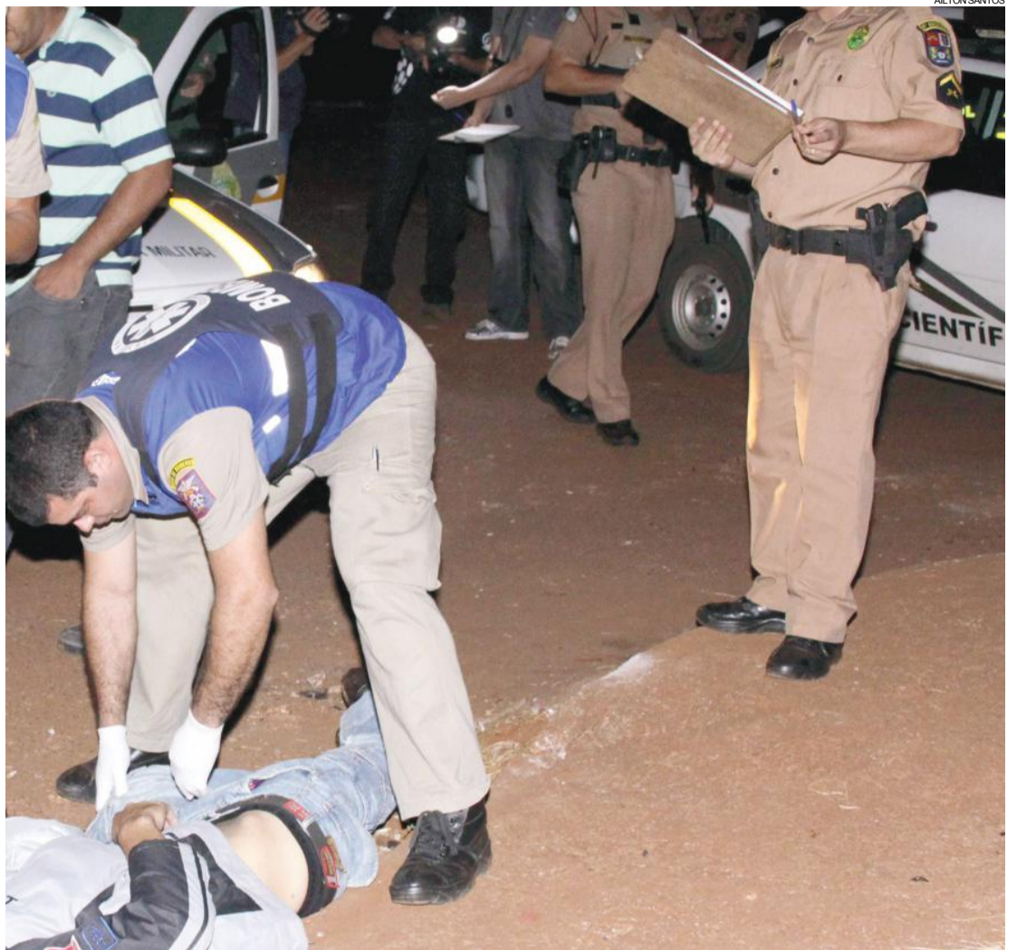
Militares atuam sem coletes em operações especiais e inclusive em ocorrências de crimes contra a vida