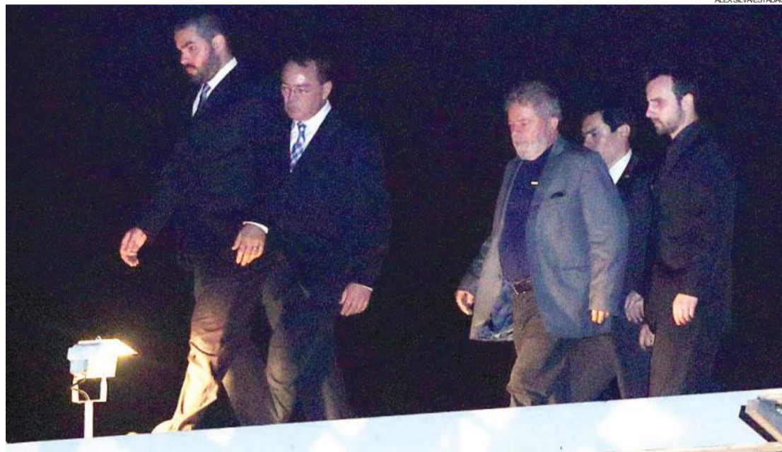
Lula chegou à sede da PF em Curitiba no último sábado, onde continua preso

Brasília - A Comissão de Direitos Humanos do Senado, presidida pela senadora Regina Sousa (PT-PI), marcou para a próxima terça-feira, 17 de abril, a fiscalização sobre as condições da “Sala Especial” em que o ex-presidente Luiz Inácio Lula da Silva está encarcerado para cumprimento da pena de 12 anos e um mês no caso triplex.