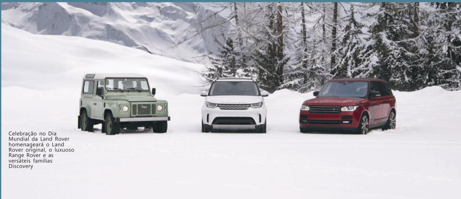
Celebração no Dia Mundial da Land Rover homenageará o Land Rover original, o luxuoso Range Rover e as versáteis famílias Discovery