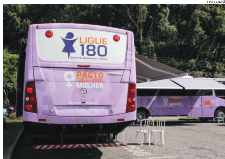
Diversos serviços serão oferecidos durante este sábado

cia contra as mulheres. No ônibus lilás serão realizados vários atendimentos e todos eles ocorrerão de maneira sigilosa, então caso você mulher esteja passando por qualquer situação de violência nos procure. E ainda convidamos toda a sociedade para prestigiar e apoiar esta causa, às 9h estaremos realizando a segunda edição do Assis em Movimento contra a violência contra a mulher com atividades de dança e às 14h uma aula de zumba venham todos participar", concluiu.