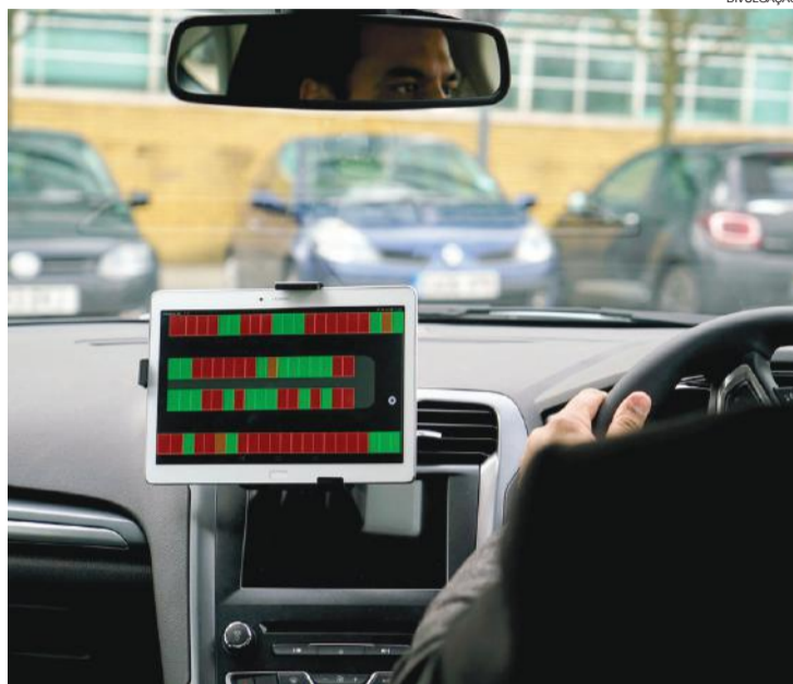
O “estacionamento colaborativo” funciona com base em dados de sensores ópticos instalados nos veículos

Os testes estão sendo realizados nas ruas e estacionamentos de Milton Keynes, cidade situada a cerca de 70 km de Londres. O “estacionamento colaborativo” funciona com base em dados de sensores ópticos instalados nos veículos, que fazem um mapeamento de temperatura do local enquanto rodam. Com essa informação, os carros “conversam” entre si e com a infraestrutura externa para estabelecer a dinâmica do tráfego de forma mais eficiente. Assim, quem está procurando uma vaga pode localizar os espaços disponíveis, no mapa exibido na