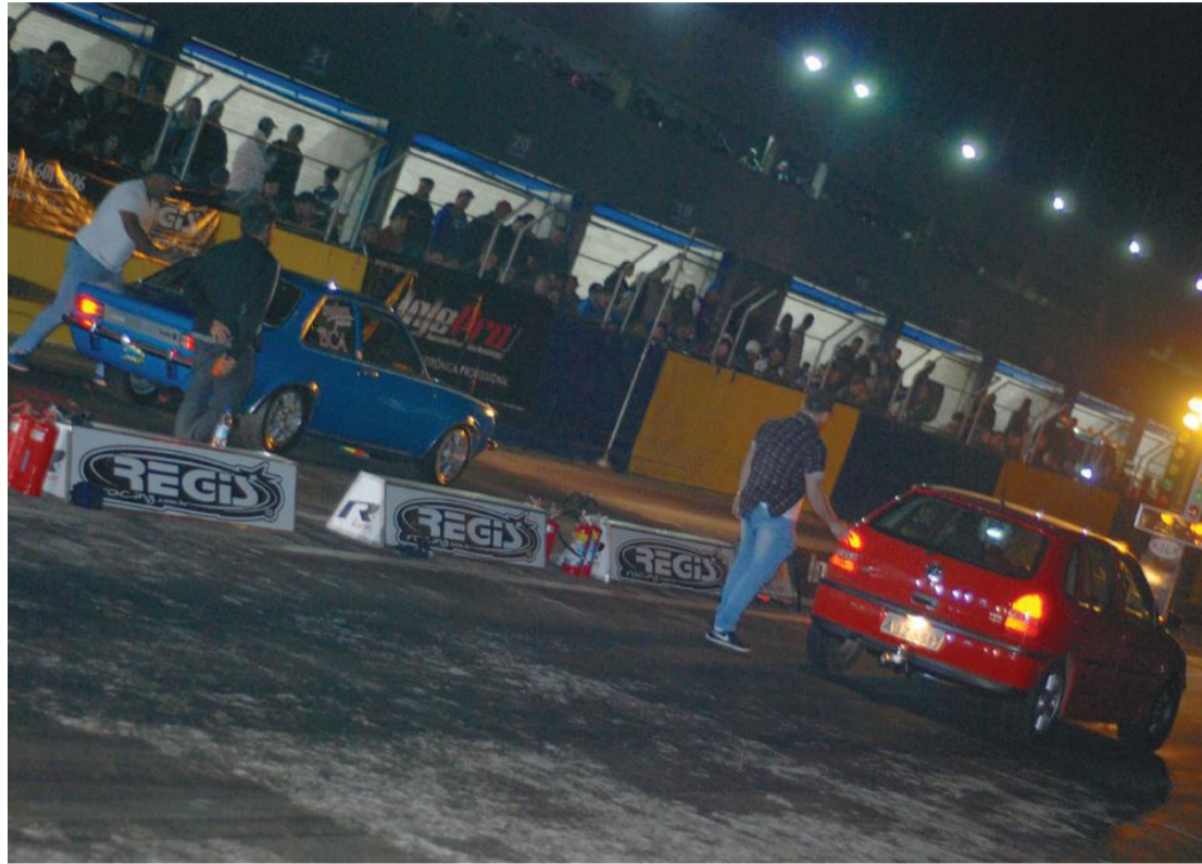
Nas provas do Racha é possível competir com o carro de uso no dia a dia

As competições de amanhã serão para motos das 12h às 18h. Já o Racha Noturno será das 19h até a meia-noite. As competições dos carros serão todas no domingo, das 9h às 18h.