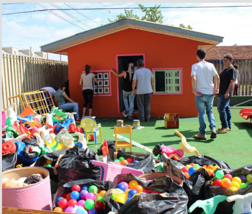
Gesto solidário envolve cerca de 100 acadêmicos

O Cmei (Centro Municipal de Educação Infantil) Professora Constantina Henkel, do Jardim Coopagro, foi o local escolhido pelo curso de Engenharia Civil da Unipar de Toledo para ser revitalizado.