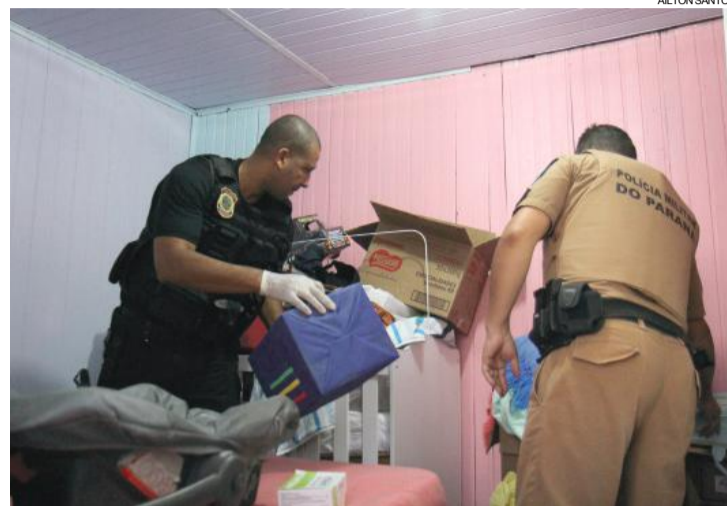
Polícia fez buscas em locais suspeitos de serem depósitos de drogas