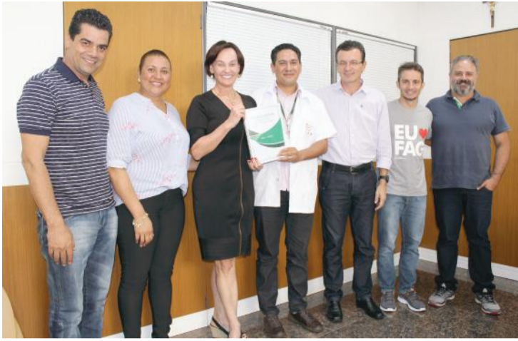
Direção da FAG já começa a planejar as próximas obras publicadas