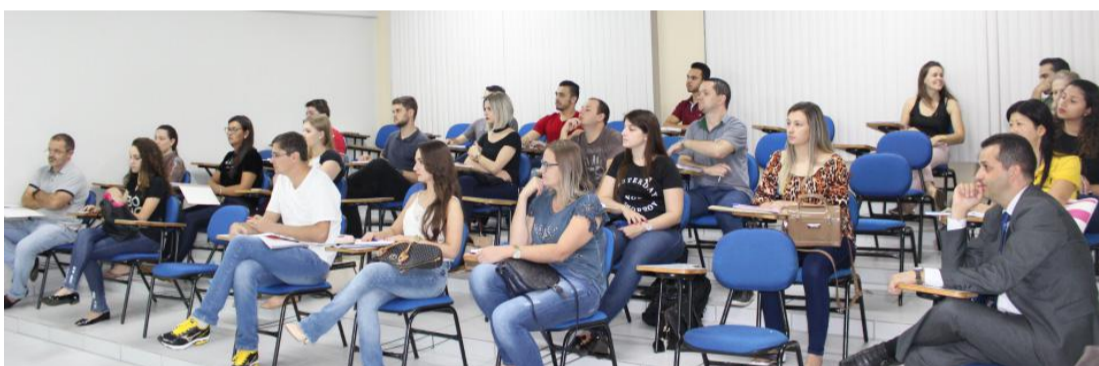
Profissionais de Cascavel e região ingressam em MBA