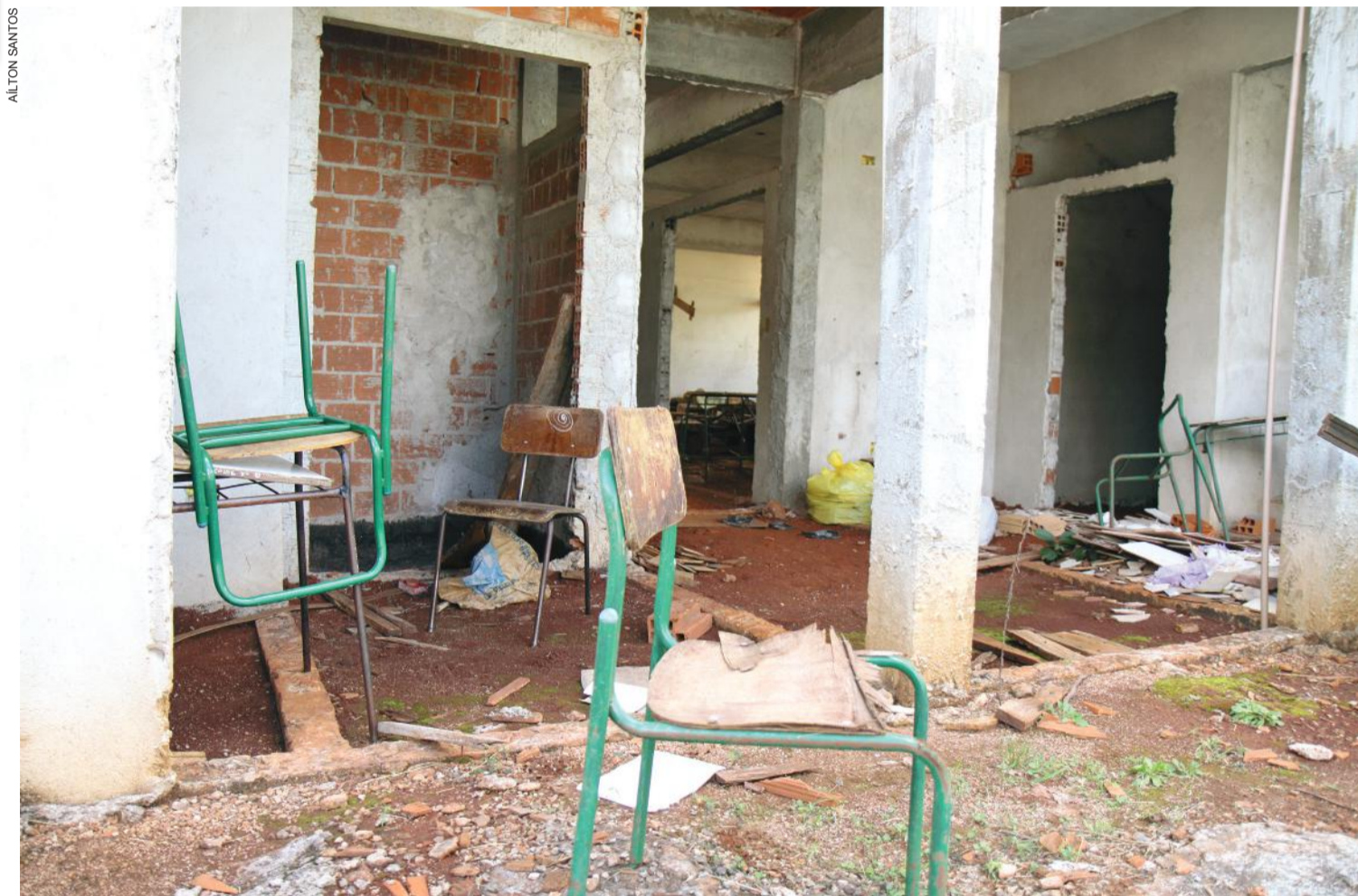
Construção no Colégio Wilson Joffre começou em 2014 e até hoje não foi concluída