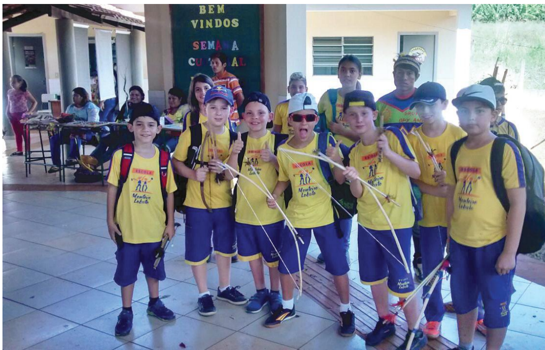
Os alunos do 4º e 5º anos da Escola Monteiro Lobato em visita à Aldeia Indígena Guarani, em Diamante d' Oeste. O dia foi de muito aprendizado sobre a história, a cultura e a valorização da arte indígena

A 1ª Feira de Inovação de Cascavel – TechnovAção / 10ª InnovaCities - Edição Invention Camp será realizada de 17 a 20 de maio no Centro de Convenções e Eventos de Cascavel. O evento contará com mostras de robótica, simuladores, drones show, veículo elétrico, entre outras atrações. Um festival de invenção e criatividade com arena gastronômica, esportes radicais, fóruns, seminários, área fitness, espaço kids e cosplay também fazem parte da programação. Mais informações no site fundetec.org.br .