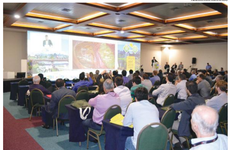
Evento supera expectativa dos organizadores pela grande participação dos profissionais do setor

Cerca de 500 cirurgiões vindos do Brasil e da América Latina participam desde ontem (19) do 5º Congresso Brasileiro de Hérnia e da 6ª Convenção Latino-Americana de Hérnia, que seguem até este