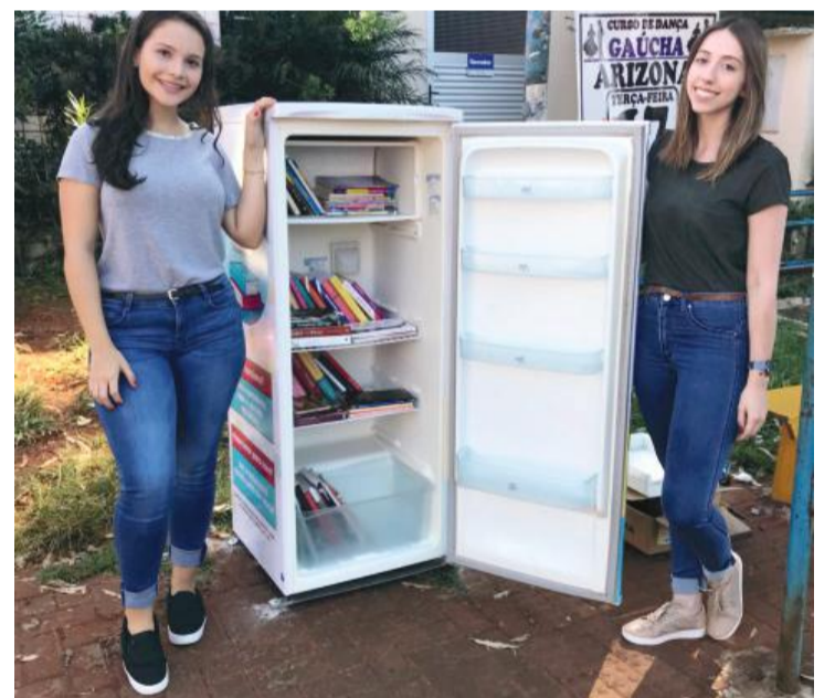
Cerca de 50 exemplares foram disponibilizados em um primeiro momento