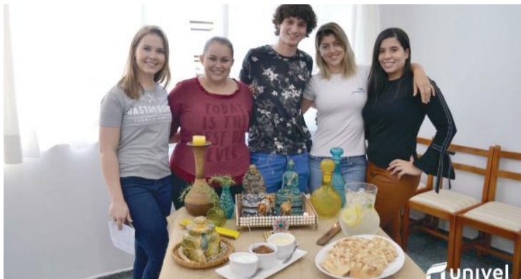
Alunos do curso de Gastronomia da Univel em aula prática na disciplina de História da Gastronomia Antiga e Medieval