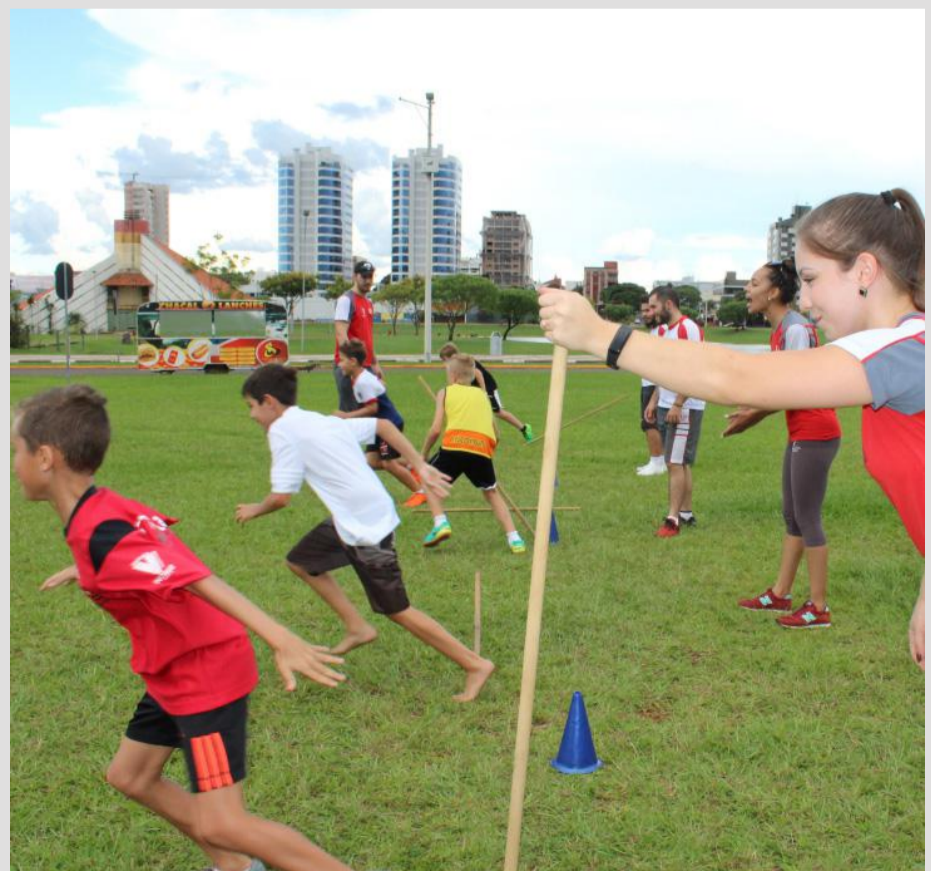
Evento comemora os 70 nos do Colégio Incomar

O evento marcou as comemorações de 70 anos de fundação do Colégio Vicentino Incomar. Os estudantes promoveram atividades recreativas e de lazer para as crianças da escola.