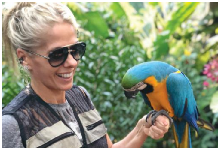
A atriz global visitou também o Parque das Aves

Focada em manter o físico em dia, ela acordou cedo e foi se exercitar na academia do hotel Belmond Cataratas, onde está hospedada. "Começou meu dia... Bora correr, bora agradecer, bora ser feliz!!!!", disse Galisteu em seu vídeo no Instagram. A apresentadora aproveitou a quarta-feira para conhecer as Cataratas no passeio do Macuco Safari, e depois foi ver de perto as belezas do Parque das Aves.