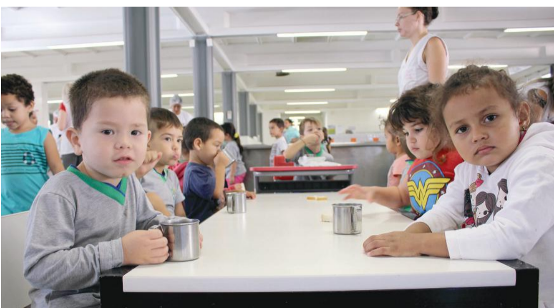
Crianças atendidas pela Escola Municipal Professora Dulce Andrade Siqueira Cunha, mais conhecida como Caic I, primeira escola de Cascavel a oferecer Educação em Tempo Integral