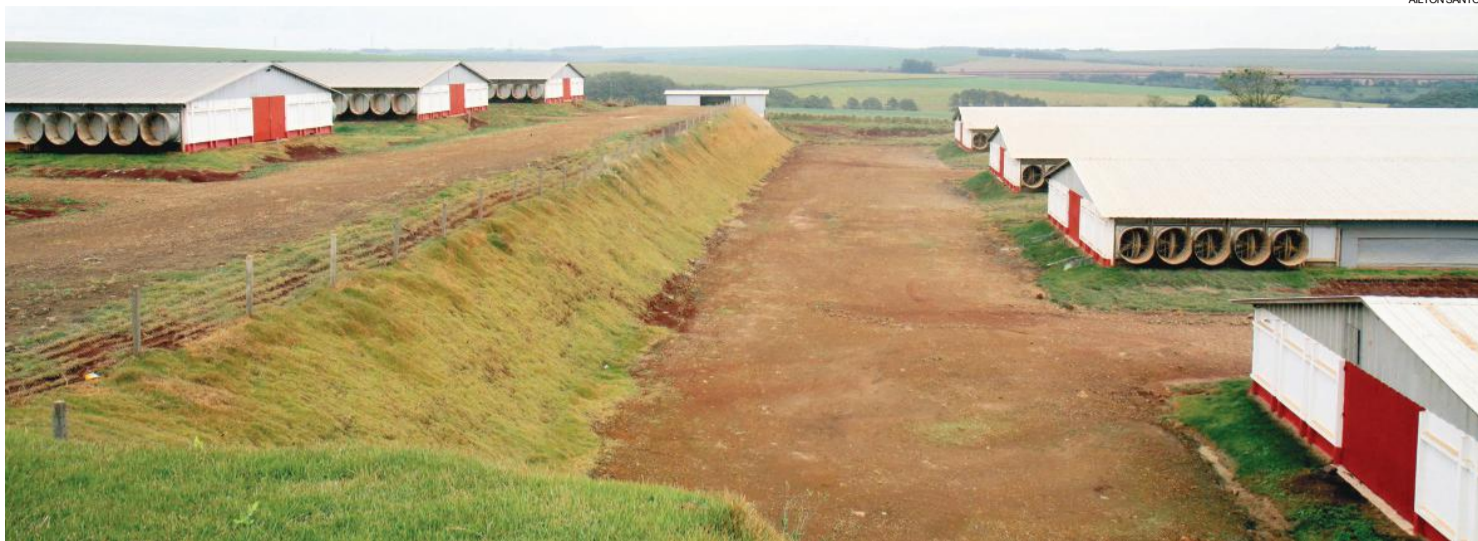
Complexo estava com quatro aviários lotados com 130 mil aves prontas para o abate

Adilson afirma que não deu para contabilizar as perdas e a justificativa é simples: as luzes dos aviários foram apagadas para que os animais comecem menos, e do lado de