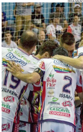
Jogo terá início às 19h no Ginásio da Neva