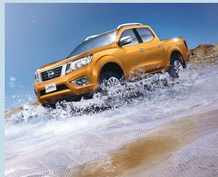
A Nissan Frontier teve 35.300 unidades comercializadas no ano fiscal 2017, finalizado em março, aumento de 5% em relação a 2016

Se considerarmos esse total de Nissan Frontier do último ano fiscal na região e multiplicarmos pela sua capacidade de carga de 1 tonelada, atingiremos 35.300 toneladas, o que significa que todas as picapes vendidas durante o período seriam capazes de carregar aproximadamente 706 baleias francas da Patagônia (peso unitário médio: 50 toneladas) ou 4 milhões e 706 mil troféus da Liga dos Campeões da UEFA (peso unitário médio: 7,5 quilos), a maior competição de clubes de futebol do mundo, a qual a Nissan é patrocinadora, ou ainda 882 mil fantasias de uma porta-bandeira de escola de samba do Carnaval do Rio de Janeiro (peso médio de 40 quilos).