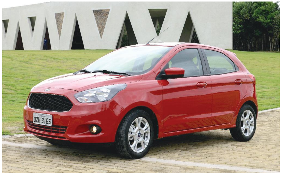
O Ford Ka foi o veículo que mais ganhou mercado entre os líderes comparado ao mesmo período do ano passado

Os utilitários esportivos foram o segmento que mais cresceu no período, superando pela primeira vez os 20% de participação no mercado latino-americano, com 22,5% das vendas. Acompanhando a tendência, o Ford EcoSport regis-