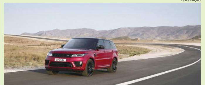
O Range Rover Sport foi o primeiro SUV da sua classe com uma estrutura de carroceria toda em alumínio

Está disponível, em toda a rede de concessionários da Jaguar Land Rover, a versão 2018 dos modelos Range Rover e Range Rover Sport. Com postura imponente, design renovado e uma poderosa e marcante linha de teto descendente, o veículo traz esportividade e elegância inigualáveis. Equipado de série com os novos faróis em LED ultrafinos e luzes de seta dinâmicas, o exterior ficou ainda mais moderno.