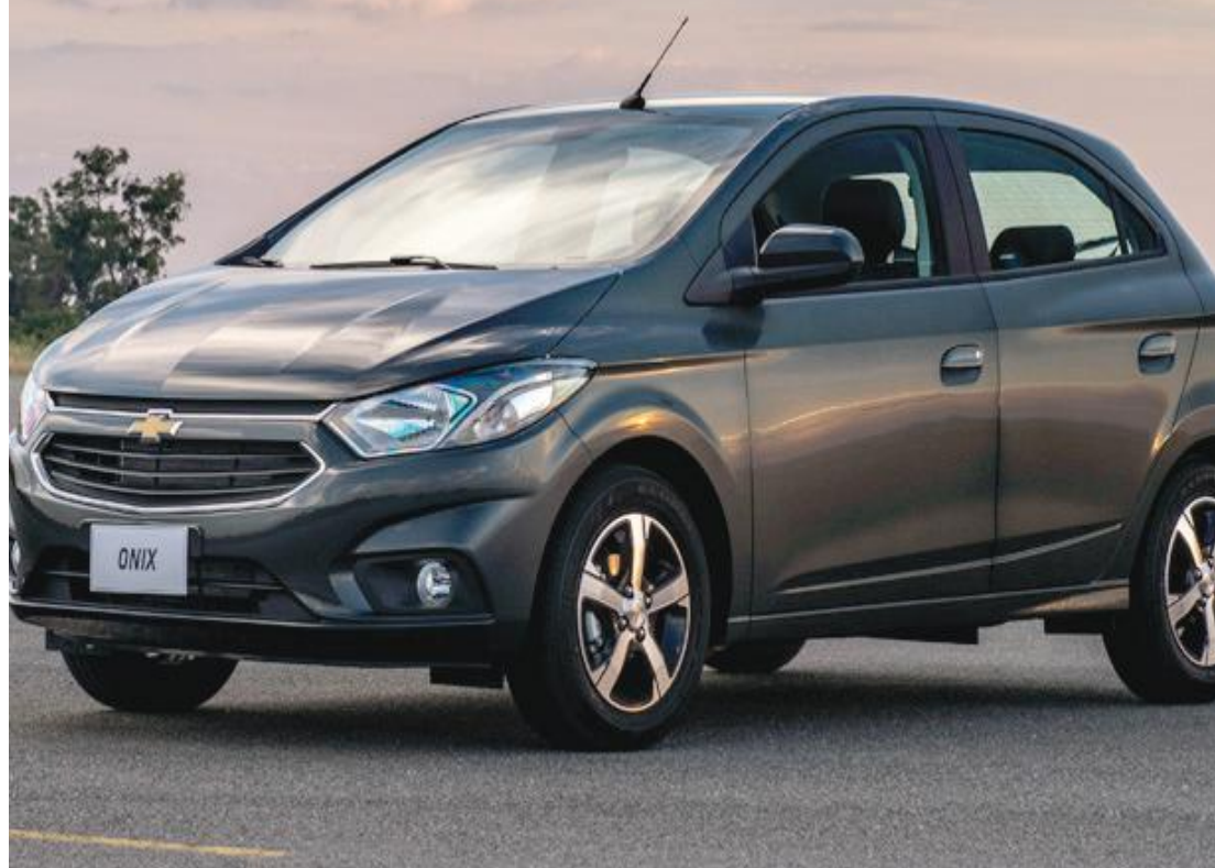
O Onix é o modelo mais vendido do mercado desde 2015

A Chevrolet vai apresentar 20 novos produtos e 10 novas versões e séries especiais até 2022 no Mercosul.