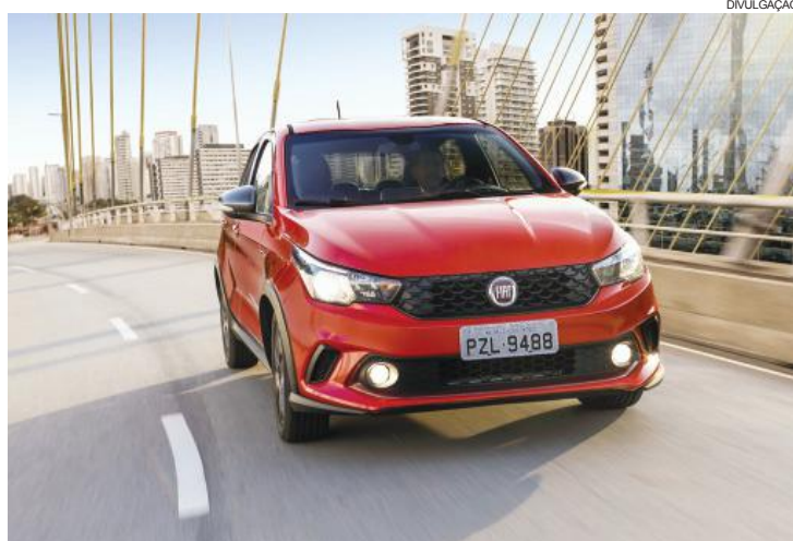
Com o lançamento do Argo 1.0, a Fiat passa a oferecer uma gama ainda mais completa no segmento de hatches compactos

Com o lançamento do Argo 1.0, a Fiat passa a oferecer uma gama ainda mais completa e com alta representatividade em cada faixa de atuação no segmento de hatches compactos. Mesmo em se tratando de uma versão de entrada, o novo Argo 1.0 traz itens de série muito interessantes como ar-condiciona-