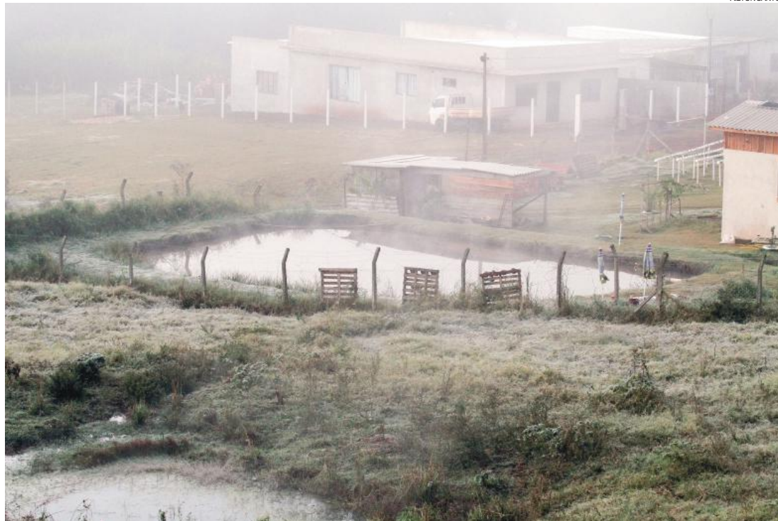
Geada ontem foi considerada de fraca intensidade

O dia ainda amanhece gelado hoje, com previsão de 5°C, sem riscos de geada no oeste, mas a amplitude térmica vai ser bastante eleva-