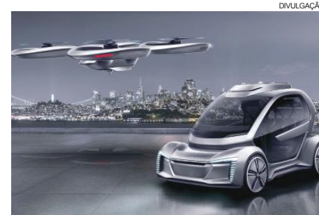
Operação já está disponível em São Paulo e na Cidade do México