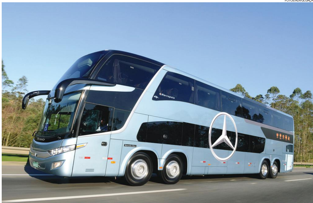
O Pacote “Fuel Efficiency” reforça o posicionamento da linha de ônibus da Mercedes-Benz como a mais tecnológica do País

O Pacote “Fuel Efficiency” reforça o posicionamento da linha de ônibus da Mercedes-Benz como a mais tecnológica do País, destacando-se por 21 avançados itens que garantem