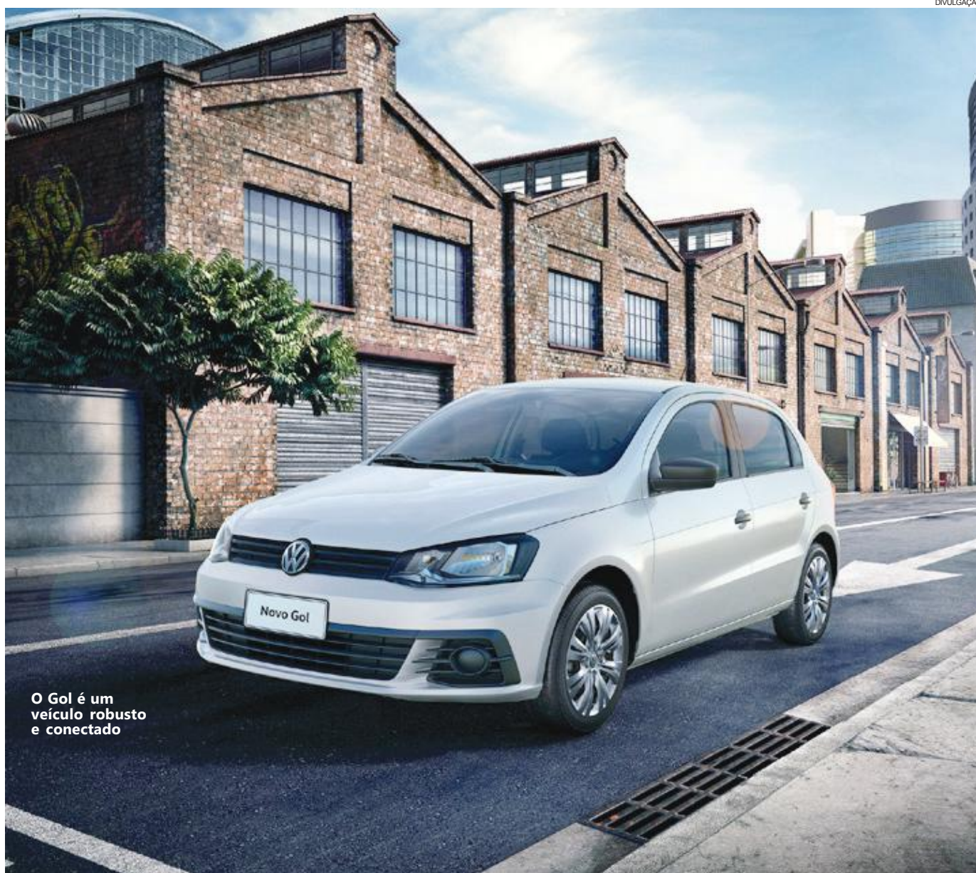
O Gol é um veículo robusto e conectado

O modelo também é referência em termos de conforto e design interior, com painel desenvolvido com base na premissa "driver oriented" (todos os botões e comandos estão posicionados voltados para o motorista).