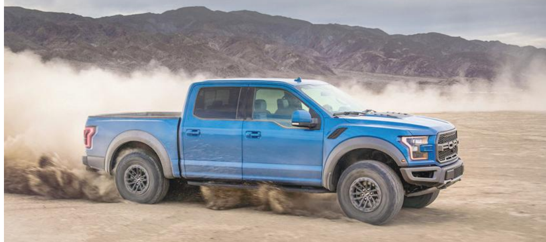
A Ford F-150 Raptor 2019 tem como novidades amortecedores com controle eletrônico e sistema de rodagem para trilhas

A Ford apresentou a F-150 Raptor 2019 que chega ao mercado norte-americano no final do ano, com aprimoramentos que ampliam ainda mais a capacidade da picape off-road de alto desempenho. As novidades incluem amortecedores com tecnologia de controle eletrônico, um sistema de controle de rodagem para trilhas e bancos esportivos Recaro, reforçando aspectos que contribuíram para tornar a Raptor a referência da categoria.