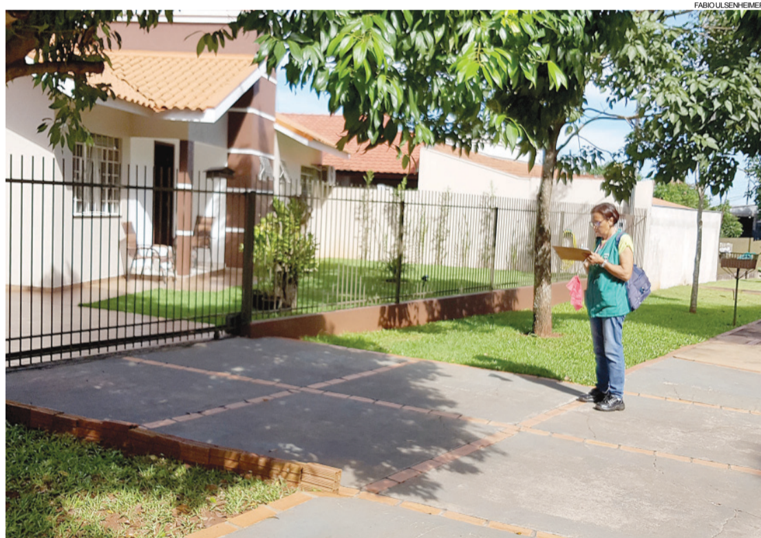
Agentes percorreram 1.890 residências

Toledo - A Coordenadoria de Combate às Endemias de Toledo divulgou nessa segunda-feira (10) os índices de infestação por Aedes aegypti do 5º LIRAA de 2018. As visitas apontaram o menor índice de infestação do ano que foi de 0,1 %.