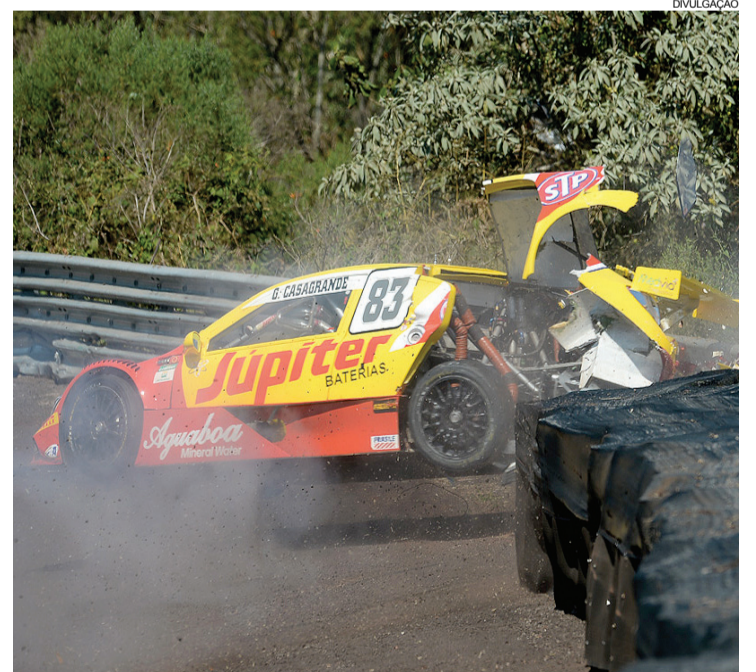
Casagrande bateu de ré no guard-hail do Curvão

Com a quinta posição obtida na primeira prova em Cascavel, Casagrande manteve a 12ª posição no campeonato.