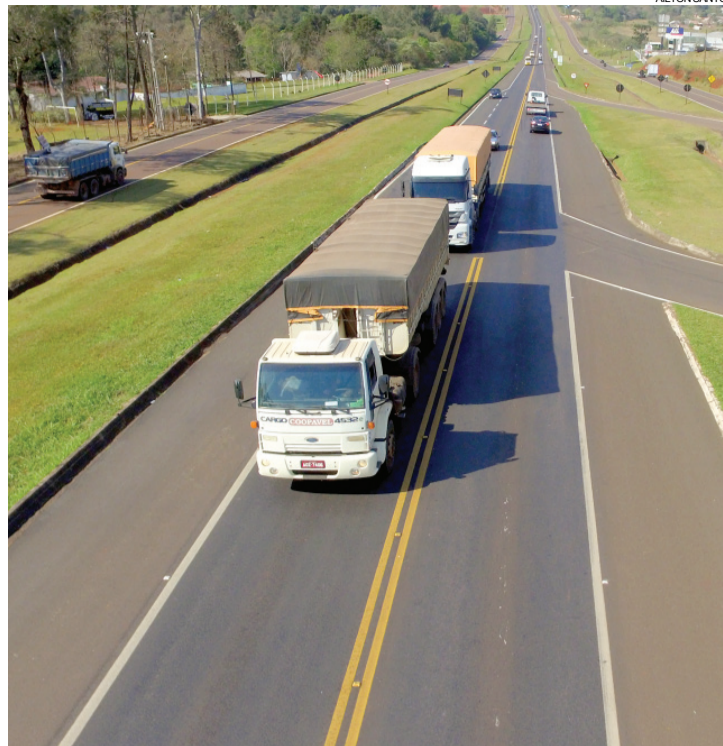
Para sindicato dos autônomos, lei só vai funcionar se fiscalização for feita em parceria com a PRE e a PRF

Cascavel - Após a sanção da Lei 13.703/2018, que determina o preço mínimo do transporte de cargas no Brasil, a ANTT (Agência Nacional de Transportes Terrestres) anunciou início de fiscalização quanto ao cumprimento da tabela.