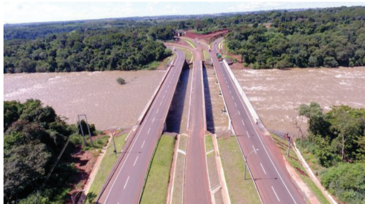
Terceira ponte vai ligar Foz a Hernandárias

íses e as diretorias da Itaipu também envolvem a construção da terceira ponte ligando o Brasil ao Paraguai.