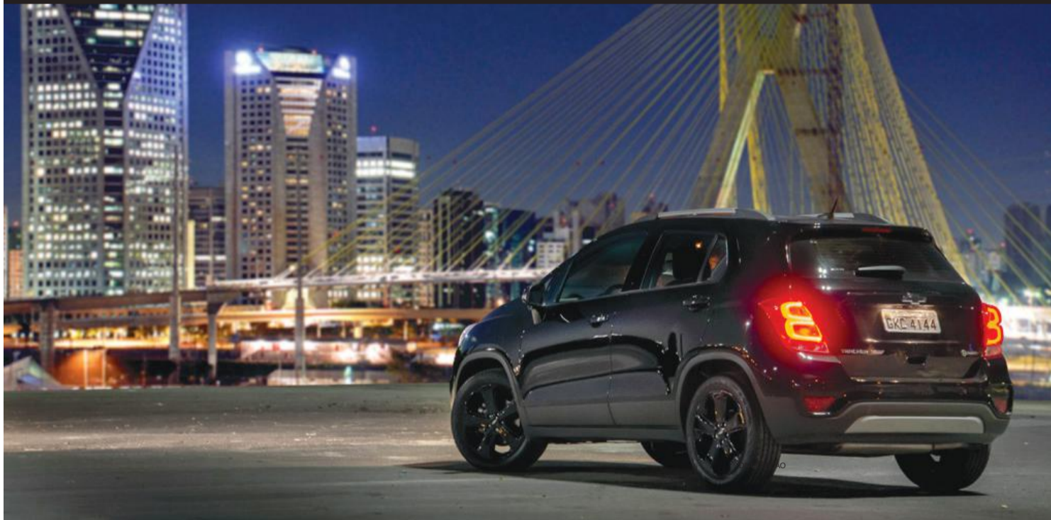
Tracker Midnight aposta em visual marcante e na ascensão da cor preta

A Chevrolet está expandindo no Brasil a oferta de produtos com a grife Midnight. Depois da picape S10, é a vez do SUV urbano da marca ganhar o estilo "todo preto" que deixa o veículo com aspecto mais esportivo e provocador, típico de carros customizados.