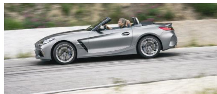
Considerada a reinterpretação do clássico conceito de roadster, a nova geração do BMW Z4 exibe design externo puramente emocional