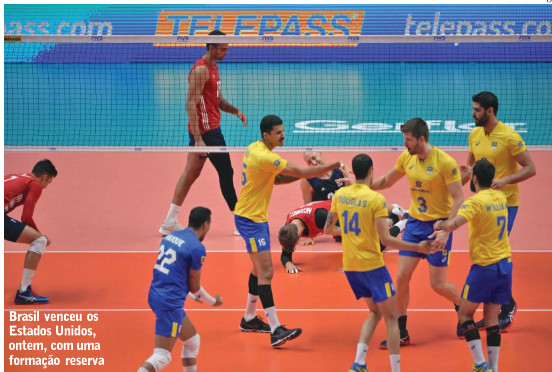
Brasil venceu os Estados Unidos, ontem, com uma formação reserva

Próximos rivais dos brasileiros, os sérvios haviam sido superados por 3 a 0 pelos poloneses na quinta-feira, mas na quarta estrearam na terceira fase com um surpreendente triunfo por 3 a 0 sobre a Itália.