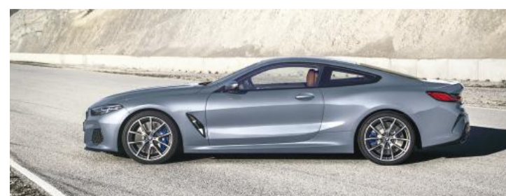
O novo BMW Série 8 Coupe representa a ofensiva da BMW no segmento de luxo