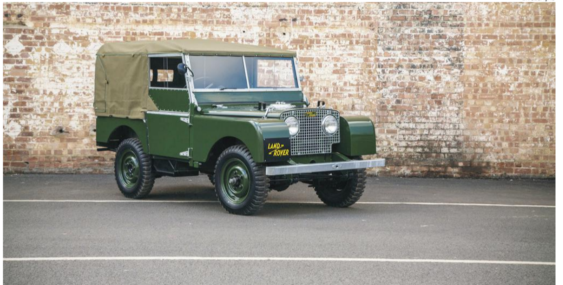
Land Rover apresenta um novo "centro de operações móvel" para a Cruz Vermelha em seu 70º aniversário

Inspirado no carro-conceito original Project Hero e como resultado de mais de 18 meses de colaboração entre a Divisão de Operações de Veículos Especiais da Land Rover e a Cruz Vermelha Austríaca, o Discovery feito sob medida tem um avançado equipamento de comunicação nunca antes visto. Ele funcionará como um centro de operações móvel em caso de desastres, como uma base para que os especialistas possam dirigir as operações de resgate remotamente sem risco, mas como se estivessem assistindo a tudo ao vivo através de um