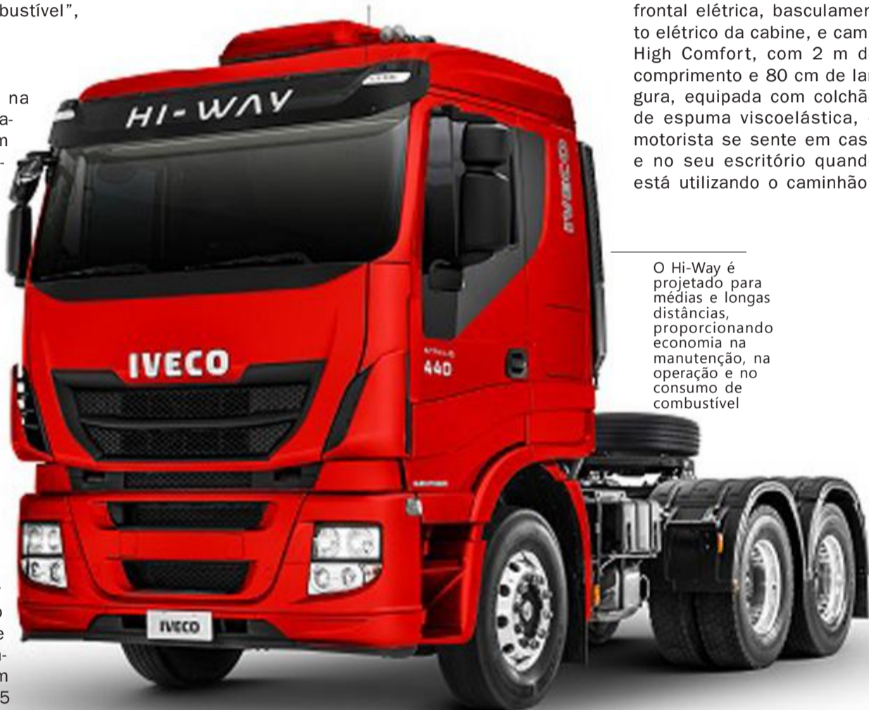
O Hi-Way é projetado para médias e longas distâncias, proporcionando economia na manutenção, na operação e no consumo de combustível

O Hi-Way é projetado para percorrer médias e longas distâncias, e ainda assim proporcionar economia na manutenção, na operação e no consumo de combustível. Com equipamentos de última geração, itens de longa durabilidade e recursos exclusivos, o modelo garante uma direção segura e confortável. Além da tecnologia, o veículo também se destaca pelo conforto. Com banco do passageiro e do motorista pneumático, de alto conforto, geladeira de 24 litros, cortina frontal elétrica, basculamento elétrico da cabine, e cama High Comfort, com 2 m de comprimento e 80 cm de largura, equipada com colchão de espuma viscoelástica, o motorista se sente em casa e no seu escritório quando está utilizando o caminhão.