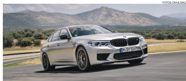
O novo BMW M5 será revelada pela primeira vez em Paris

A mostra francesa também marcará a estreia mundial do novo BMW X5. A quarta geração do fundador da família BMW X destaca-se com propriedades de condução garantidas e inúmeros recursos de equipamentos inovadores. A nova linguagem de design exterior enfatiza claramente a presença, autoridade e robustez do novo X5. O interior, entretanto, combina generosos níveis de espaço com design moderno e um ambiente luxuoso. A gama aprimorada de motores, a última geração do sistema de tração inteligente BMW xDrive e uma série de tecnologias de chassis integrados em um modelo BMW X proporcionam, pela primeira vez, uma combinação de atributos como conforto de condução, desempenho fora de estrada e dirigibilidade esportiva; e que são ressaltadas pela presença de equipamentos como suspensão a ar nos dois eixos, direção ativa integral e pacote off-road.