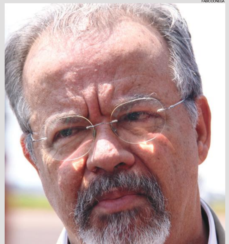
Ministro esteve ontem em Cascavel e visitou a fronteira do Brasil com o Paraguai

O projeto que, segundo o ministro, não deverá custar menos de R$ 100 milhões, não cabe exatamente ao combate ao crime organizado na fronteira do Brasil com o Paraguai. De acordo com forças de segurança que atuam no entorno, a chamada rota caipira, por usar aviões conhecidos como sertanejos bimotores, deixaram de ser uma prática constante por aqui quando o cerco