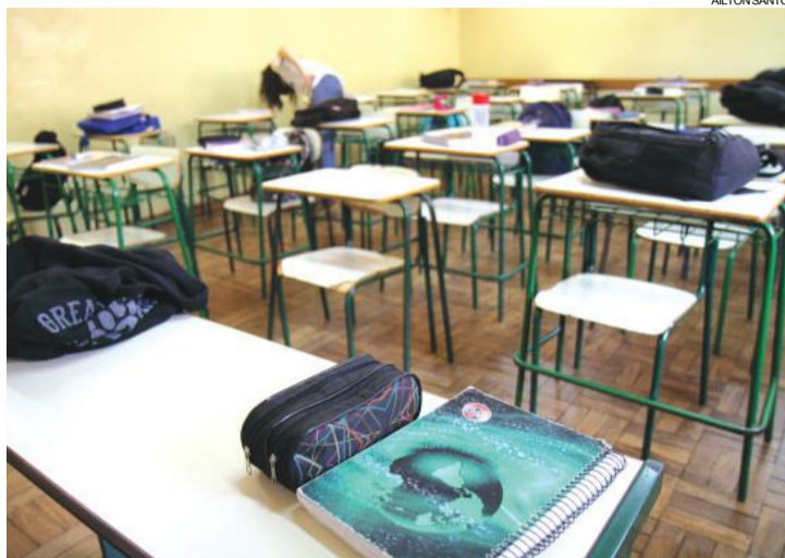
Alton Santos Materiais ficaram na sala de aula depois do crime

A Polícia Civil também teve acesso a uma foto que mostra o adolescente autor dos dispa-