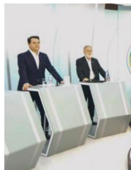
Corrupção, ataques e "piadinhas" foram a marca do debate