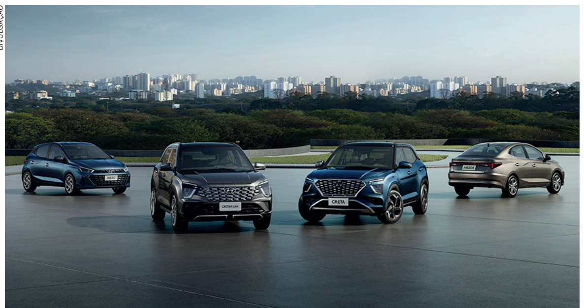
O HB20 e o Creta têm como novidades na linha 2024/2025 itens de conveniência e conforto

A Hyundai anuncia ontem (quinta-feira) a chegada das versões ano-modelo 24/25 do HB20 e do Creta em toda sua rede de concessionários no Brasil. Entre as novidades, itens de conveniência e conforto foram acrescentados em diversos modelos, em linha com a estratégia da marca de atender diferentes faixas de preço com veículos ainda