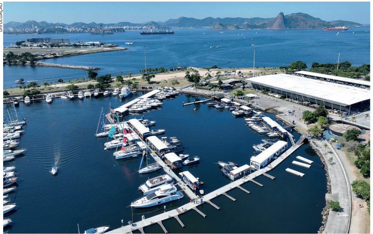
O Rio Boat Show reúne mais de 90 barcos em exposição e 200 marcas e segue até domingo, na Marina da Glória