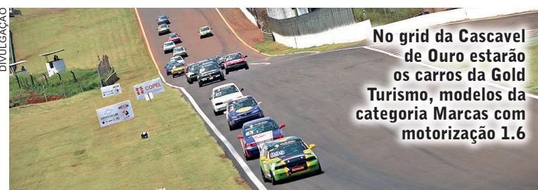
No grid da Cascavel de Ouro estarão os carros da Gold Turismo, modelos da categoria Marcas com motorização 1.6

As inscrições podem ser requisitadas pelo e-mail cascaveldeouro2024@gmail.com ou pelo telefone (45) 9 9134-5760, também disponível para mensagens via WhatsApp.