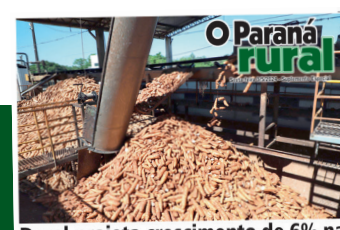
Deral projeta crescimento de 6% na produção de mandioca no Paraná