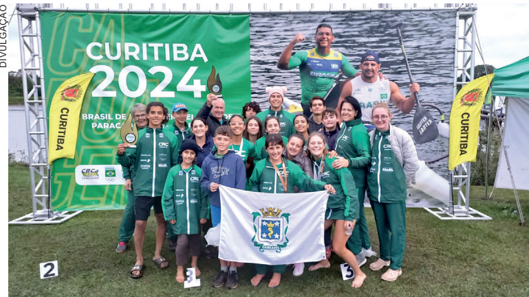
Clube de Regatas Cascavel conquistou o título geral da Copa do Brasil