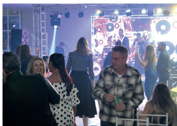
O encontro foi animado