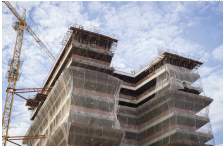
Obras de construção da Unila foram paralisadas em 2014

O TCU concedeu 90 dias para que a universidade adote providências “no sentido de verificar a possibilidade de supressão do contrato de doação do terreno para construção de sua futura sede a cláusula que impõe reversão da doação em caso de não conclusão da obra em cinco anos ou em caso de adoção de projeto não aprova-