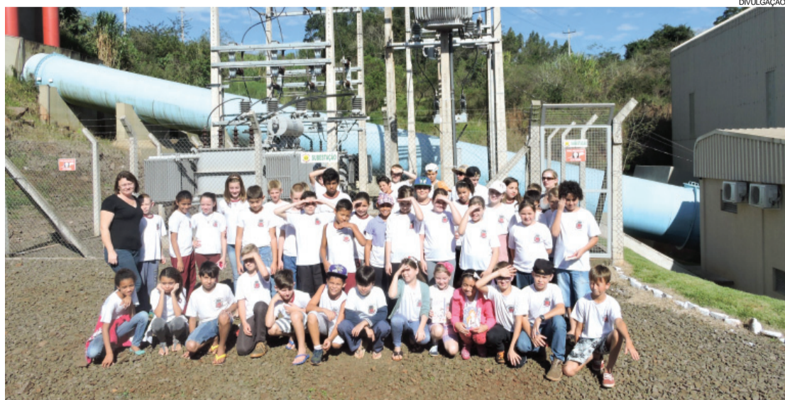
Visita teve a presença de alunos do 5º ano das escolas municipais de Nova Santa Rosa

Nova Santa Rosa - A Prefeitura de Nova Santa Rosa, por meio do Departamento de Agricultura e Meio Ambiente, acompanhou os alunos dos 5º anos das escolas municipais do município em visita na Usina Hidrelétrica Cercar. A visita foi uma expedição investigativa com o objetivo de desenvolver o projeto do Programa “A União Faz a Vida”. Além da expedição os alunos realizaram plantio de mudas de árvores frutíferas e nativas fornecidas pela Itaipu Binacional no espaço próximo a usina. Os alunos foram acompanhados das professoras, do encarregado de operação e manutenção da PCH, Giliard, dos ges-