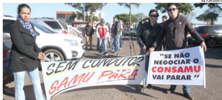
Funcionários do Consamu se reuniram em manifestação em frente à Prefeitura de Cascavel