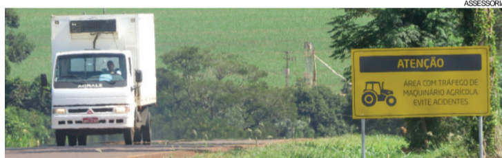
A campanha sobre o trânsito nas rodovias é uma iniciativa da Prefeitura de Palotina