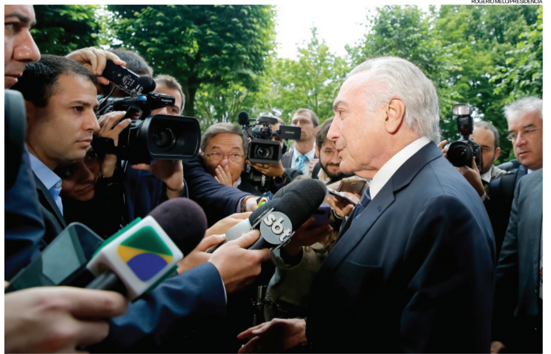
Na Alemanha, presidente diz que dados mostram crescimento da economia

Mês passado, o Ministério do Trabalho anunciou que, em maio, a abertura de vagas formais de emprego superou as demissões em 34,2 mil postos. Foi o segundo mês seguido em que houve criação de postos de trabalho com carteira assinada no País. Contudo, o IBGE diz que o Brasil ainda tem 13,8 milhões de desempregados.