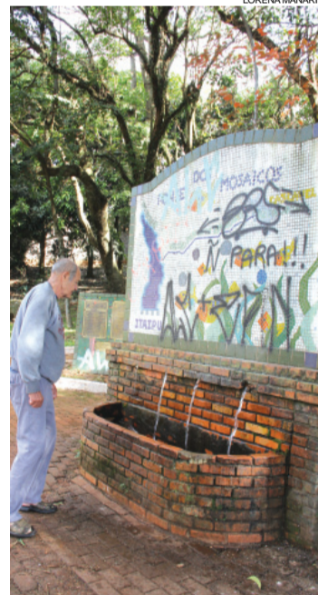
Fonte dos Mosaicos no centro de Cascavel é uma das 22 fontes contaminadas

Em fevereiro de 2014, a prefeitura informou que havia realizado exames nas 23 fontes existentes à época e que a análise considerou a água potável