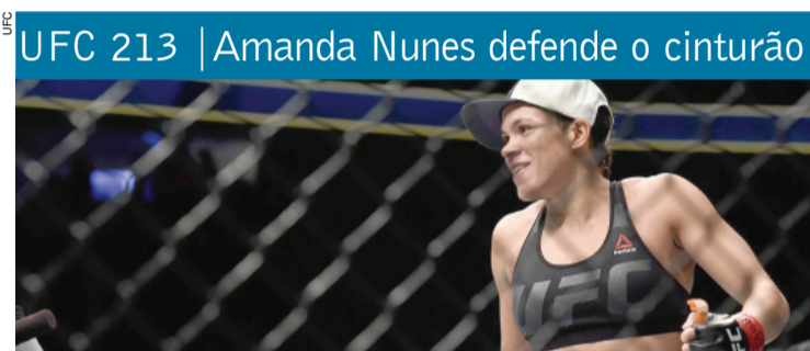
UFC 213 | Amanda Nunes defende o cinturão A baiana Amanda Nunes coloca seu cinturão do peso galo em jogo na luta principal do UFC 213 neste sábado, contra a russa Valentina Shevchenko. O card principal está marcado para iniciar às 23h (de Brasília) e conta também com o duelo de peso pesado entre o brasileiro Fabrício Werdum e o holandês Alistair Overeem. No card preliminar, a partir das 20h, destaque para Thiago Marreta x Gerald Meerschaert e Rob Font x Douglas D'Silva.