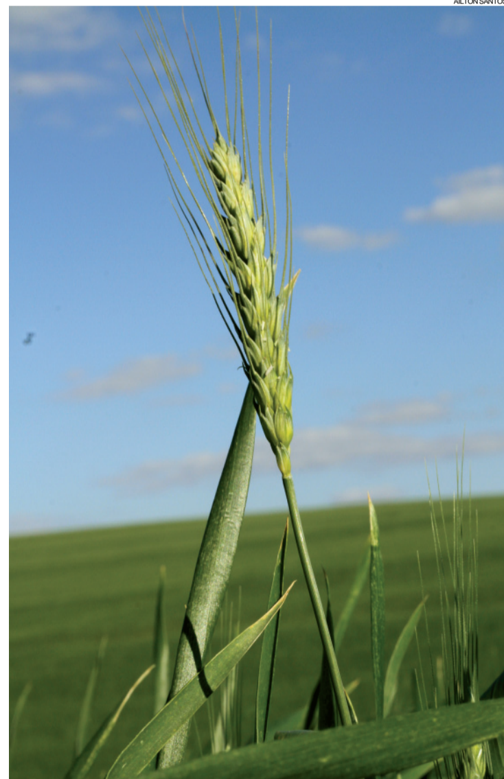
Área de plantio na safra de trigo neste ano na região oeste é de 117 mil hectares

Conforme o técnico do Deral, J. J. Pertille, o trigo presente