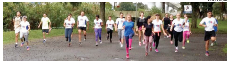
Corrida Legal está presente em sete cidades do Estado

O projeto iniciou em Curitiba, em 2015. “No momento em que comemoramos o segundo aniversário deste projeto encantador, temos a felicidade de expandi-lo e oferecê-lo aos advogados da Subseção de Foz do Iguaçu. É motivo de orgulho para mim e para toda a dire-