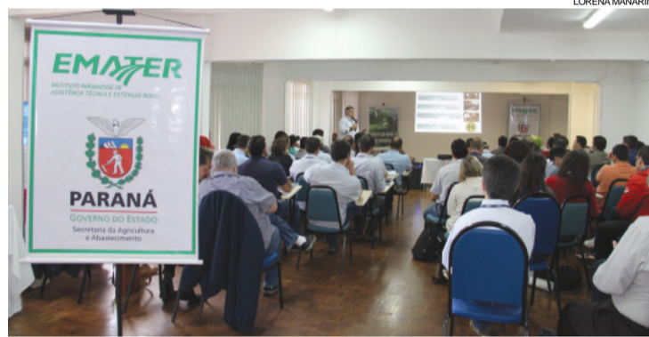
Dezoito novos profissionais integram a partir de agora o quadro do Emater de Cascavel e Toledo