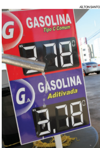
Aumento dos combustíveis não agradou os motoristas de Cascavel; reajustes foram repassados já na sexta-feira