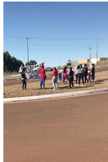
Protesto reuniu mulheres de presos ontem em Catanduvas