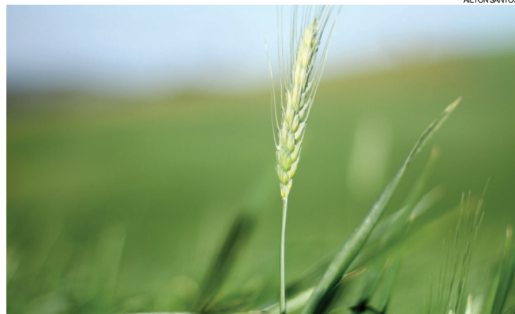
Levantamento de perdas nas lavouras começa a ser feito depois do registro de geadas

O diagnóstico das perdas deve ser concluído em duas semanas. “Por enquanto é pouca coisa que se pode notar, ainda é muito cedo para avaliar estas perdas, mas