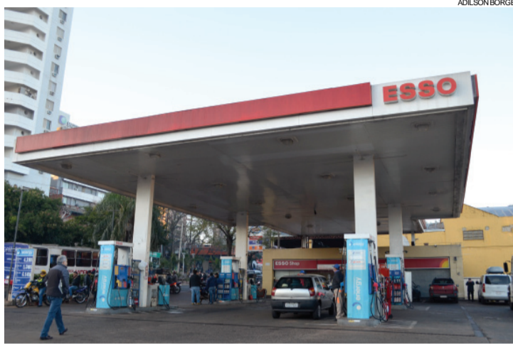
Postos funcionam 24 horas para atender demanda de brasileiros

A pureza dos combustíveis do país vizinho divide a opinião de especialistas em veículos no Brasil. Segundo eles, os veículos equipados com motor flex são menos suscetí-