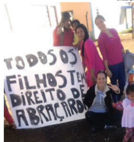
Mulheres e crianças protestaram ontem em frente ao Presídio de Catanduvas