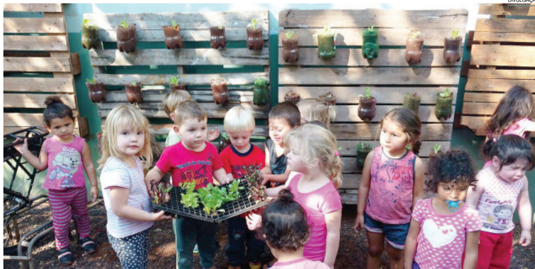
Alunos participam do plantio de mudas em hortas suspensas