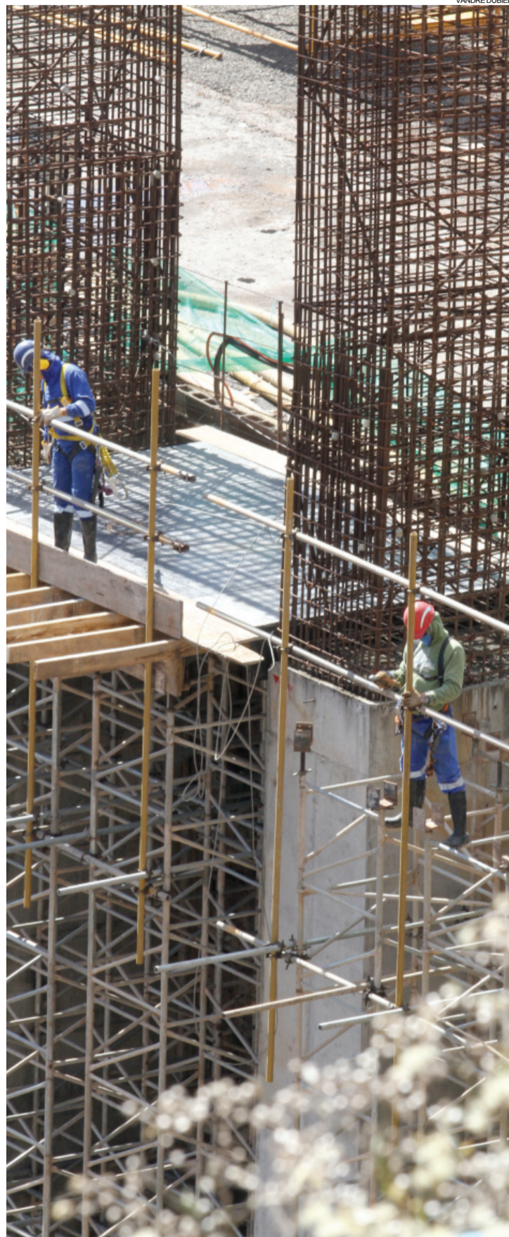
Segundo o Consórcio, usina deve entrar em operação no segundo semestre de 2018