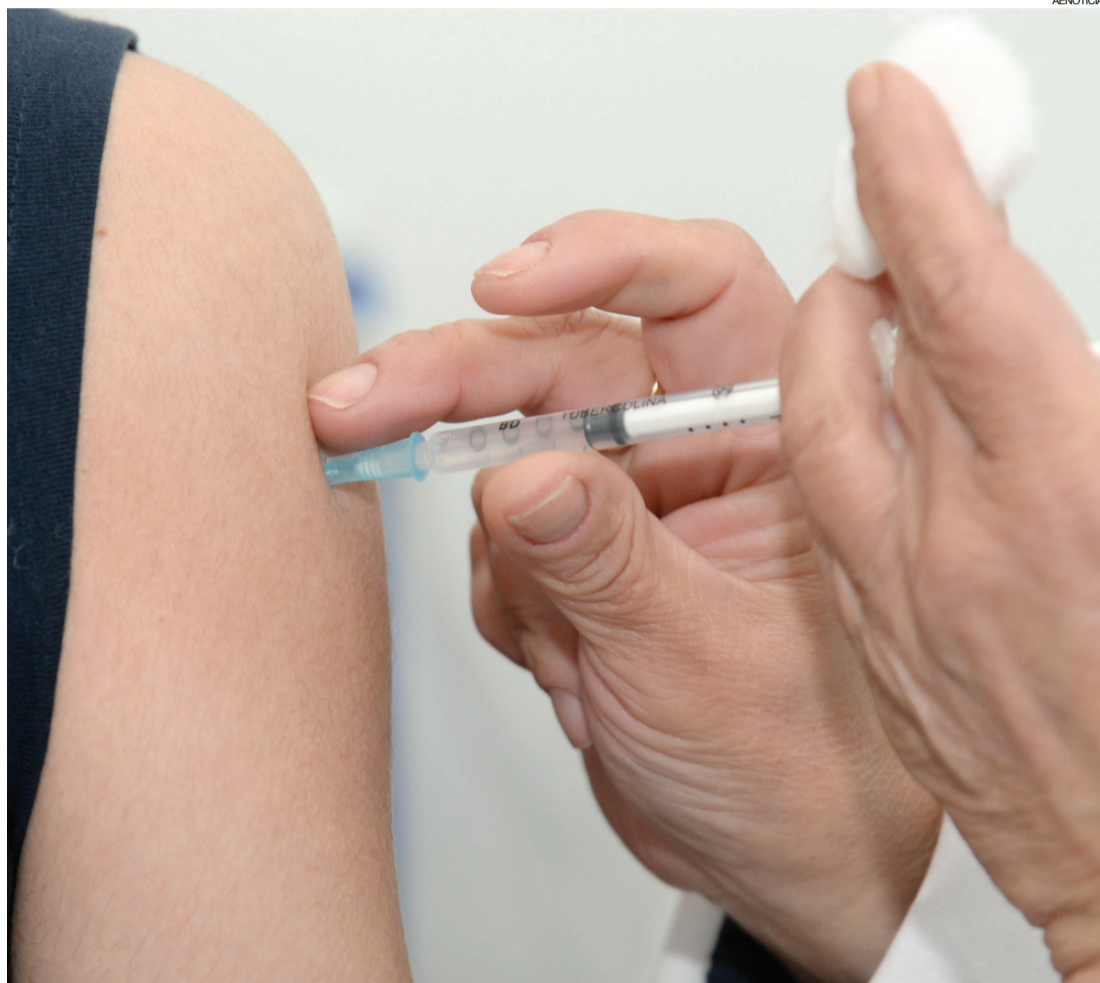
A Secretaria Estadual de Saúde alerta os municípios a ficar atentos ao calendário de vacinação desse público

Ele chama a atenção dos gestores municipais de saúde para coberturas muito desiguais no Paraná. Como exemplo, cita a campanha de vacinação contra a gripe em que alguns municípios não atingiram a meta de vacinar 90% do público-alvo. Uma cidade paranaense não chegou a 50% de imunização em crianças e seis não alcançaram o mesmo percentual com gestantes. Quanto às vacinas que estão no calendário vacinal do SUS, a baixa procura pode interferir na redução de doenças preveníveis.