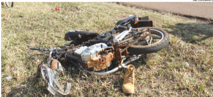
Jovem de 26 anos foi fechado por condutor de caminhonete, que fazia uma ultrapassagem