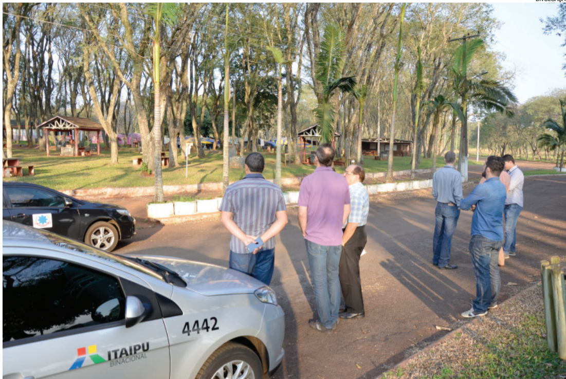
Representantes da Itaipu participam de vistoria feita no Terminal Ipiranga