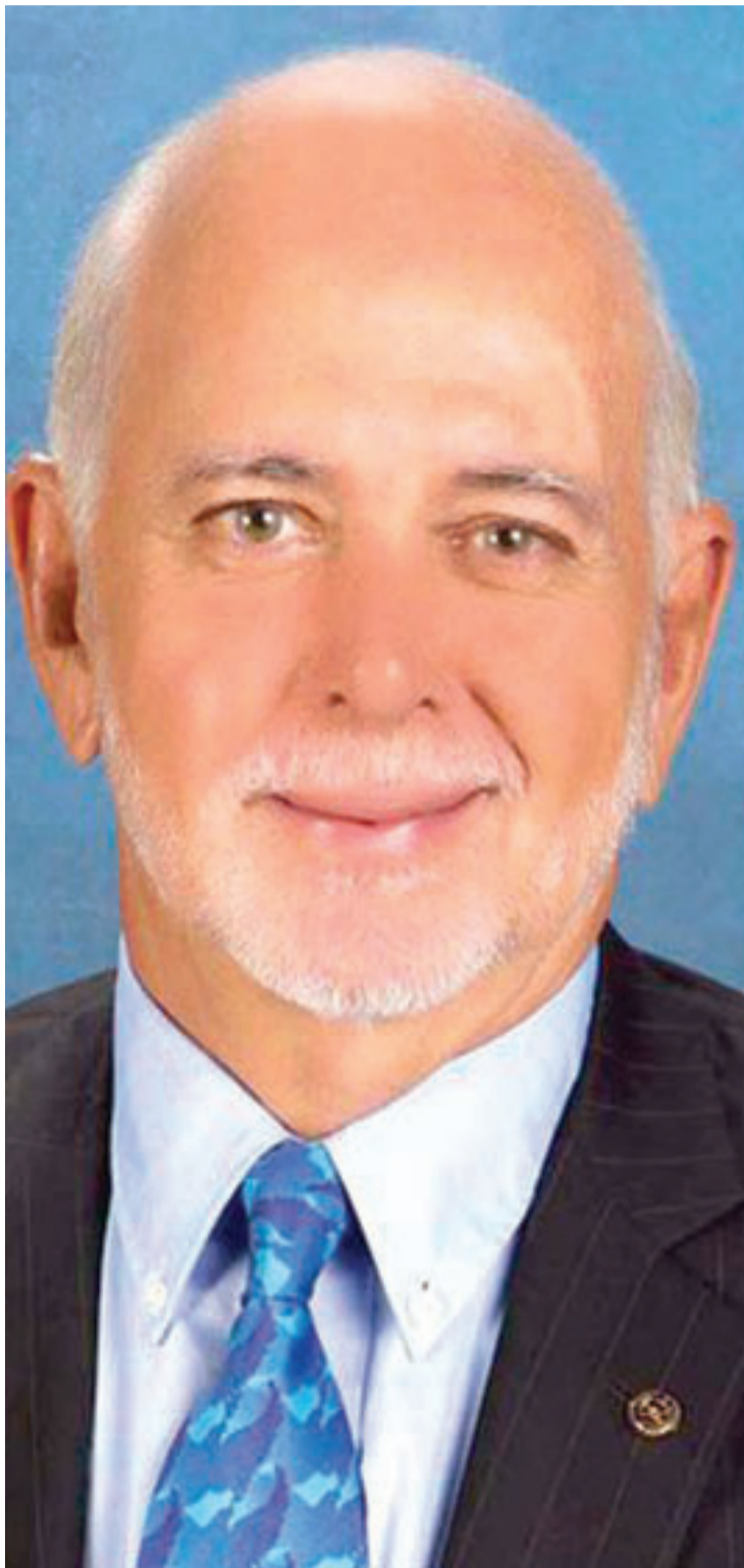
PRESIDENTE DO ROTARY INTERNATIONAL 2018 19