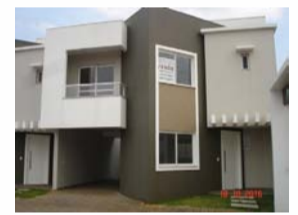
LINDO SOBRADO condomínio fechado PARQUE SÃO PAULO - Cond. Villagio - Rua Quintino Bocaiuva - Excelente acabamento (110m² privativos) - "01 suíte, 01 quarto com closet, 01 quarto, sala estar, sala jantar, lavabo, cozinha, lavanderia, chur., 02 vagas..... R$ 330.000,00.