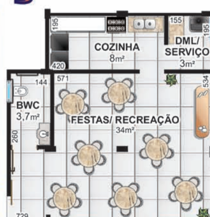
36 unidades residenciais 2 SALÕES DE FESTAS - 50m² + 50m²