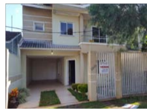
SOBRADO TROPICAL - Rua Flamboyant - com 199,85 m² com suíte 2 quartos, sala estar, jantar, cozinha, lavanderia, 2 vagas, sobra terreno nos fundos R$ 650.000,00. Aceita Imóvel em Pato Branco na negociação.