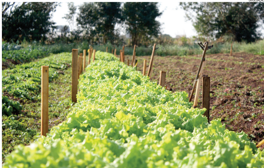
Hort do Centro de Atendimento à Criança: produção abastece cardápio da merenda de entidades

Marechal Cândido Rondon - Desativada até o fim do ano passado, a horta do Centro de Atendimento à Criança voltou a produzir muitos frutos em Marechal Cândido Rondon.