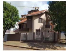
LINDO SOBRADO NO CENTRO - com terreno de 800 m² e sobrado com 276 m² 1 suíte 3 quartos, sala com lareira, mais 2 salas de estar e de jantar, cozinha, lavabo, escritório, lavanderia, dep de empregada, 2 vagas. R$ 1.350.000,00.