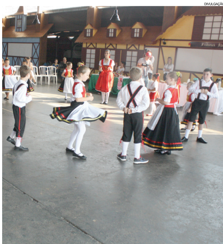
O destaque ficou por conta do “Grupo Folclórico Kleine Kinder”, da Escola Municipal de Artes

tes. Os termos “Kleine Kinder”, traduzidos do alemão para o português, significam “crianças pequenas”.