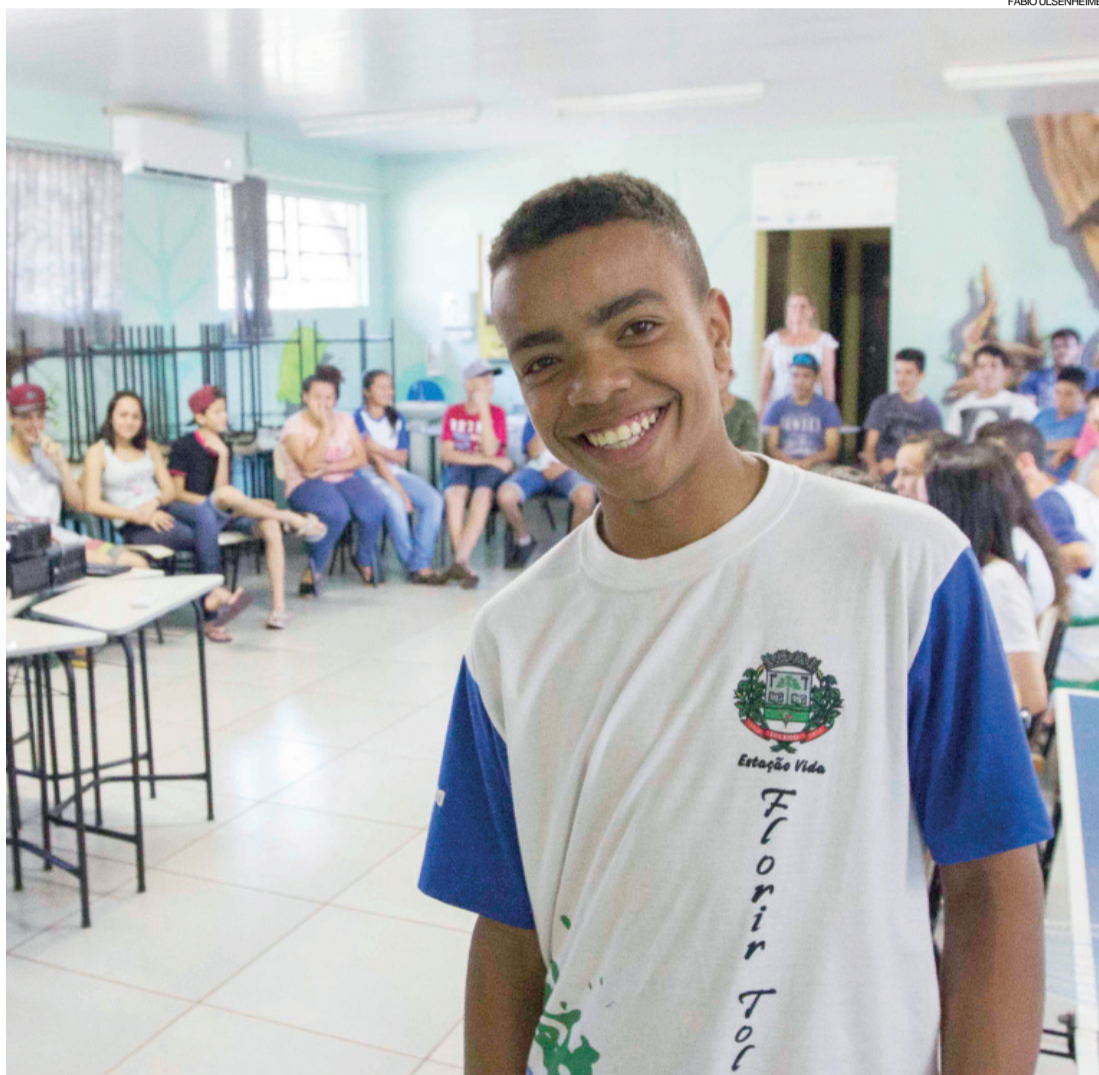
Palestra beneficiou adolescentes atendidos pelo projeto Florir, em Toledo