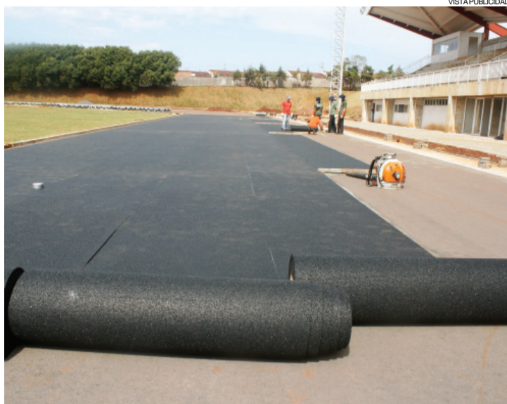
Pista emborrachada já está sendo montada no Centro de Atletismo

Cascavel - O CNTA (Centro Nacional de Treinamento em Atletismo) de Cascavel começa a receber o seu mais significativo investimento estrutural: a pista emborrachada importada da Alemanha, primeira estrutura do gênero a ser instalada no Sul do Brasil. Com custo de aproximadamente R$ 4 milhões, a pista servirá para competições nacionais e internacionais de atletismo, tanto em corridas de curta como longa duração. O investimento total no CNTA é de R$ 16,3 milhões, sendo R$ 13 milhões do Governo Federal e R$ 3,3 milhões de contrapartida do Governo do Paraná. O terreno, que fica na Avenida Amazônia s/n, Bairro FAG, tem 86 mil metros quadrados. A área construída é de 7.948 metros quadrados. O complexo esportivo contará com uma pista de atletismo de 400 metros, com certi-