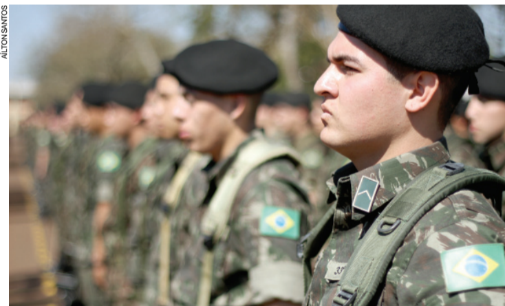
Autoridades municipais e centenas de militares foram ao evento