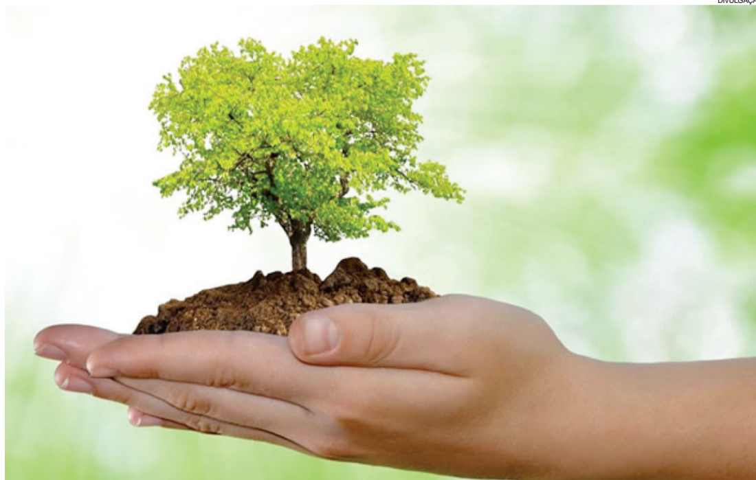
Evento começa dia 27 e vai reunir pelo menos mil pessoas

O WRI (World Resources Institute) estima que os US$ 1,15 bilhão já destinados à Iniciativa 20x20 poderiam resultar em retornos