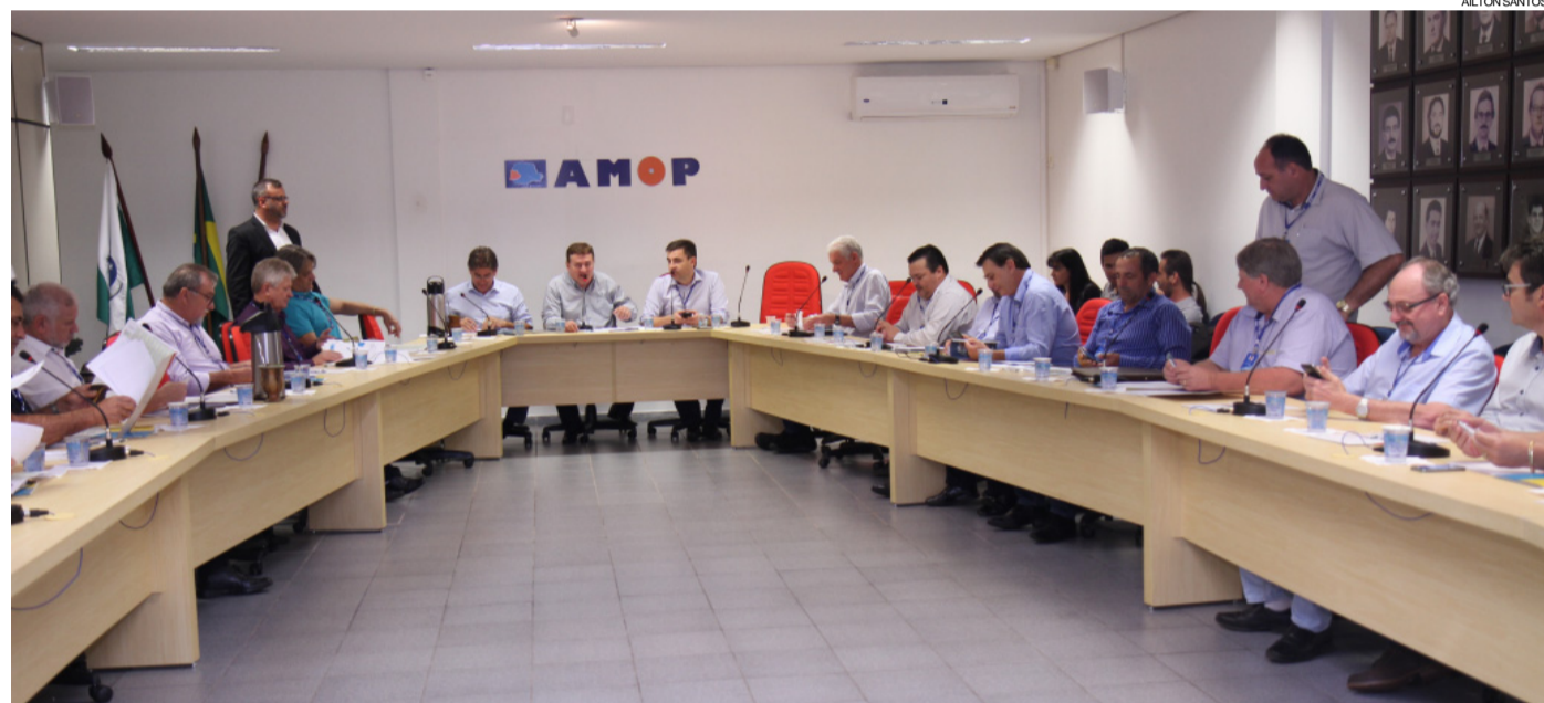
Prefeitos discutem alternativas para equilibrar os cofres públicos