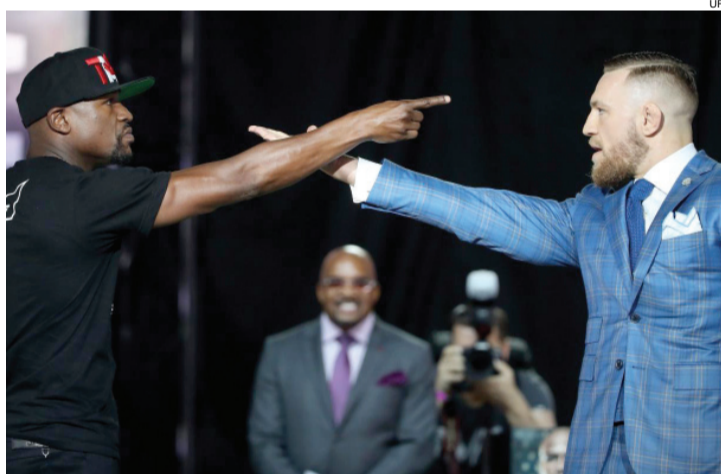
Floyd Mayweather e Conor McGregor fizeram da luta um espetáculo que já movimenta milhões de dólares

são de 4 onças. Apesar de toda a expectativa para o combate entre "Money" e "The Notorious", a luta tem tudo para não agradar o espectador que está acostumado com os eventos do UFC. Já para quem acompanha o boxe o duelo deverá ser mais interessante. Isso a julgar pela Superluta realizada há dois anos entre Mayweather e Pacquiao. Na oportunidade, o estadunidense venceu por pontos ao desferir golpes certos no filipino, que buscou mais o combate.