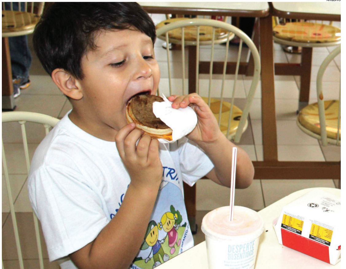
Para participar, basta comprar um Big Mac, que custa só R$ 15,50

O projeto é realizado sempre no mês de agosto em alusão ao Dia do Economista, celebrado no último dia 13. Hoje, aproximadamente 40 pessoas vão atender a população.