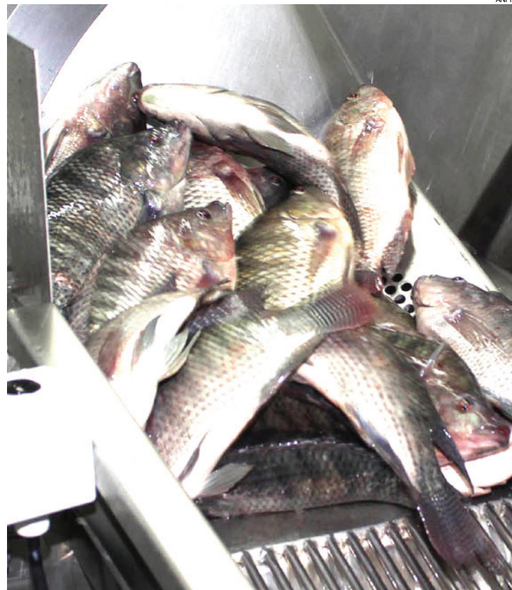
Unidade pretende abater 75 mil tilápias por dia

A previsão da C.Vale é inaugurar o novo empreen-