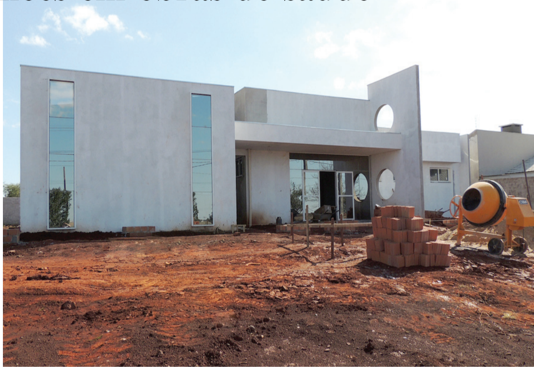
Unidade de Saúde da Família em construção em Palotina

As duas unidades de saúde estão nos Bairros Osvaldo Cruz e Parque das Glicínias. Atualmente, esses bairros são atendidos em um imóvel alugado e em um espaço cedido pela Secretaria Municipal de Educação. "Os dois bairros estão se desenvolvendo e essas novas unidades de saúde servirão para