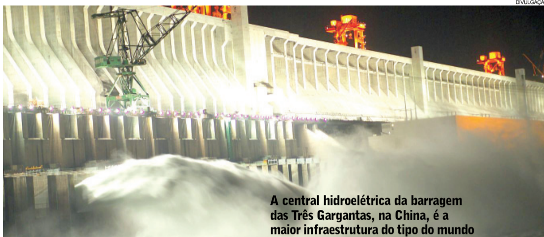
A central hidroelétrica da barragem das Três Gargantas, na China, é a maior infraestrutura do tipo do mundo

brasileiro participará do seminário sobre Oportunidades de Investimento nos Setores de Infraestrutura, Transportes, Energia e Agronegócio promovido pela Apex-Brasil (Agência Brasileira de Promoção de Exportações e Investimentos). O encontro reunirá líderes empresariais chineses que investem ou têm interesse em investir no Brasil.