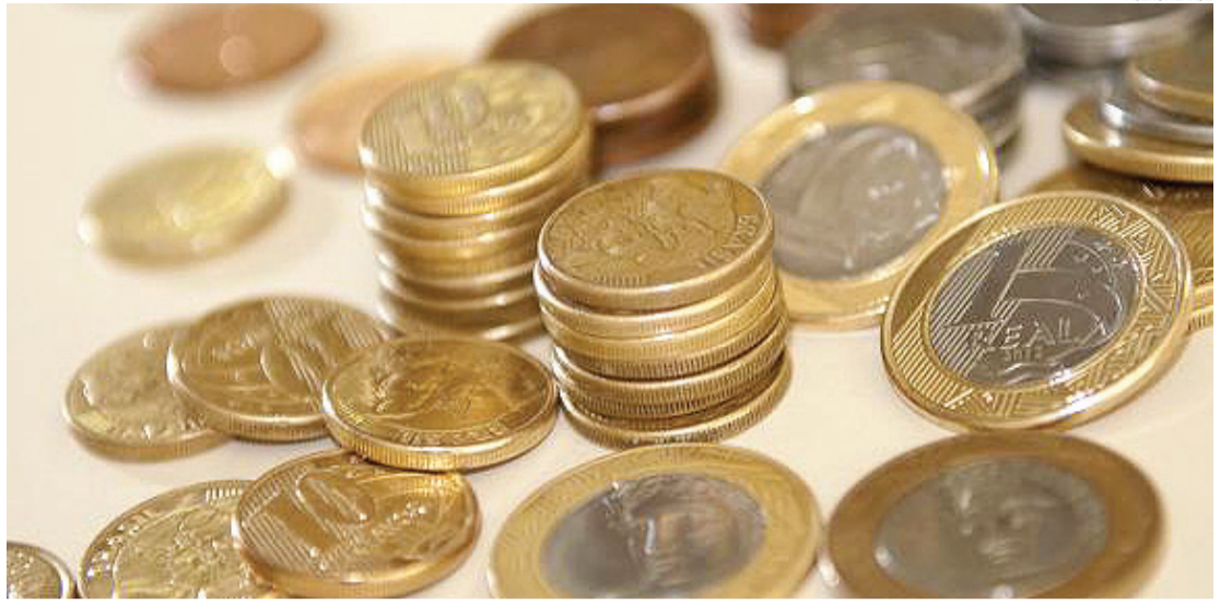
Desde 1994, foram produzidas 8,7 bilhões de moedas

A CNI (Confederação Nacional da Indústria) informou que avalia novas propostas para o setor industrial e que vai apresentá-las após a decisão final da OMC.