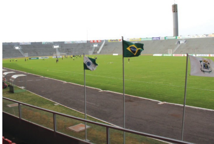
Equipe cascavelense realizou o treino de ontem no Estádio Olímpico

Cascavel - Num confronto que é uma espécie cria x criador, guardada as devidas proporções da comparação, FC Cascavel e Operário medem forças com os portões do Estádio Olímpico abertos ao público neste feriado de Sete de Setembro, em Cascavel. A partida, válida por duelo atrasado da 3ª rodada, está marcada para as 15h.