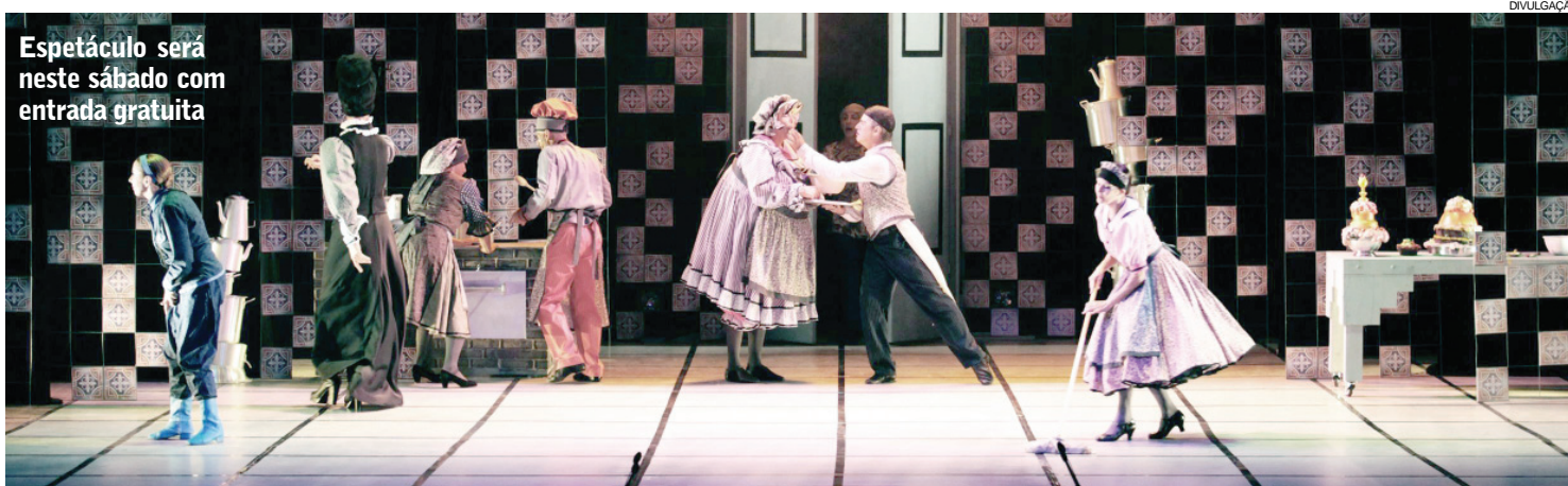
Espectáculo será neste sábado com entrada gratuita

Além da apresentação, o departamento técnico e de produção do Centro Cultural Teatro Guaira fará oficina básica