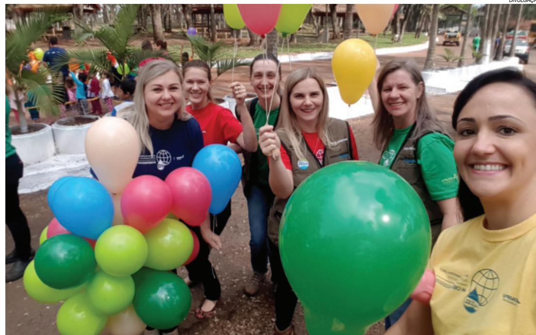
Para marcar o lançamento, grupos soltaram balões coloridos

A organização do Encontros e Caminhos CAB é feita em conjunto pelo Conselho de Desenvolvimento dos Municípios Lindeiros ao Lago de Itaipu, administrações municipais e Itaipu Binacional. Nesta edição, o projeto deve se estender até novembro. “Foram destinados R$ 700 mil para dar suporte às iniciativas realizadas em cada município”, observa o assessor especi-