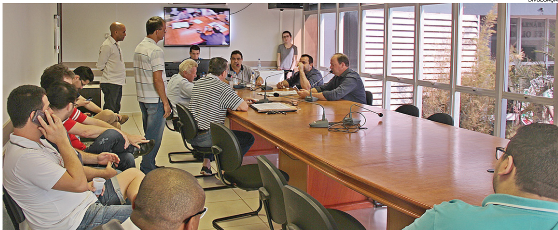
Comissão organiza plano de trabalho