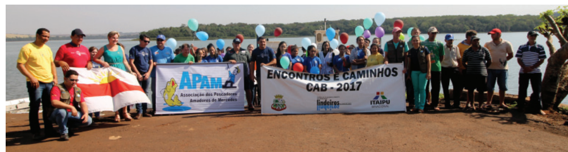
Evento reúne cerca de 5 mil pessoas em 58 pontos da região