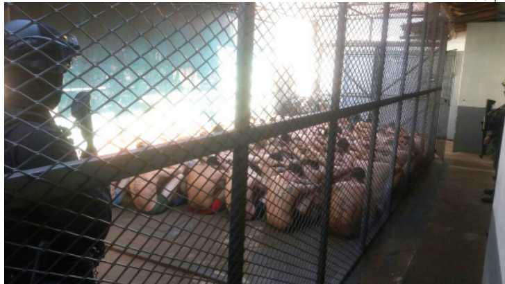
Presos foram levados para o solário após nova tentativa de fuga em Marechal Rondon

Este pode ser o reflexo de um sistema fragilizado e em ruínas. Em Marechal Cândido Rondon são quase 100 presos em espaço para apenas 25. Achou alarmante? Tem situação ainda pior. A mais crítica continua sendo a de Toledo onde a cadeia teve há cerca de três meses uma interdição, muitos presos foram transferidos para a PEC, por exemplo, mas contava nesta quarta-feira com 175 internos. Eles estão em seis celas, inclu-