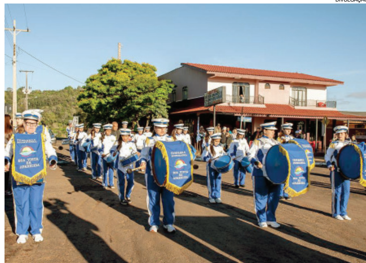
Desfile será comandado pela fanfarra municipal

O Colégio Estadual Paulo VI e a Casa Familiar vão representar a construção da usina. O pelotão da Apae vai contar a história da escola. Também participarão o pelotão da Ação Social, Cras e Creas com o clube da terceira idade representando os baileiros.