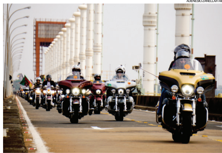
ADENÉSIO ZANELLA ITAIPU

Cerca de 1,2 mil pessoas em 800 motocicletas participaram de um passeio promovido pela Harley-Davidson