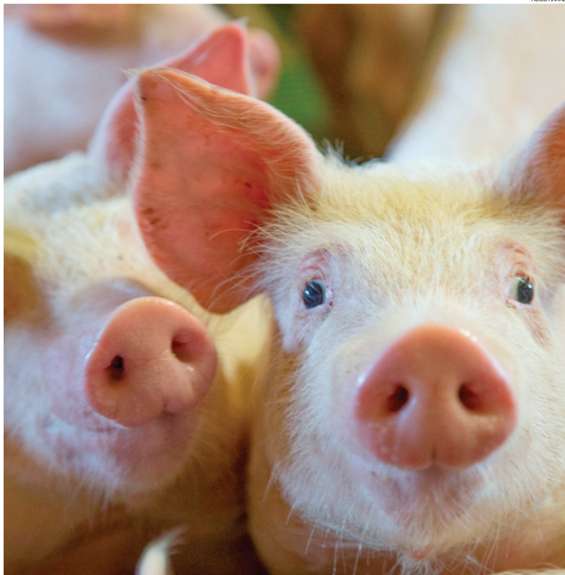
A suinocultura nacional aumentou em cem mil toneladas a produção de carne no ano passado