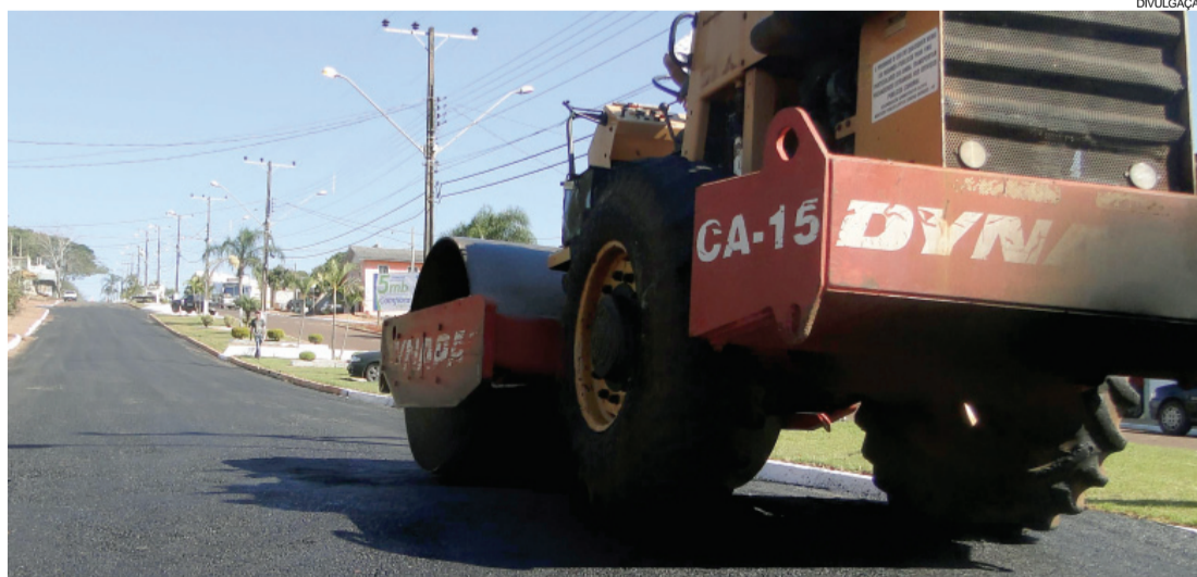
A equipe também refez um trecho de asfalto na avenida principal da cidade

Há meses a Avenida Tancredo Neves, no trecho em frente à Igreja Matriz, estava com um buraco no asfalto. Por ser rota de caminhões, o asfalto foi afundando, formando uma cratera extensa onde não se conseguia passar de carro, fazendo com que os motoristas tivessem que desviar pelo trecho destinado ao estacionamento, que foi desocupado, tudo isso devido ao estrago no asfalto. Na primeira semana de setem-