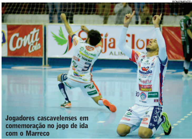
Jogadores cascavelenses em comemoração no jogo de ida com o Marreco

O Fantasma, aliás, é quem mais terá que colocar a tabela em ordem, por causa de compromissos pela Série D. O duelo pela 7ª rodada será em Irati, neste domingo (17) e o jogo pela 8ª rodada com o Rio Branco será no dia 20 (quarta-feira), em Ponta Grossa.