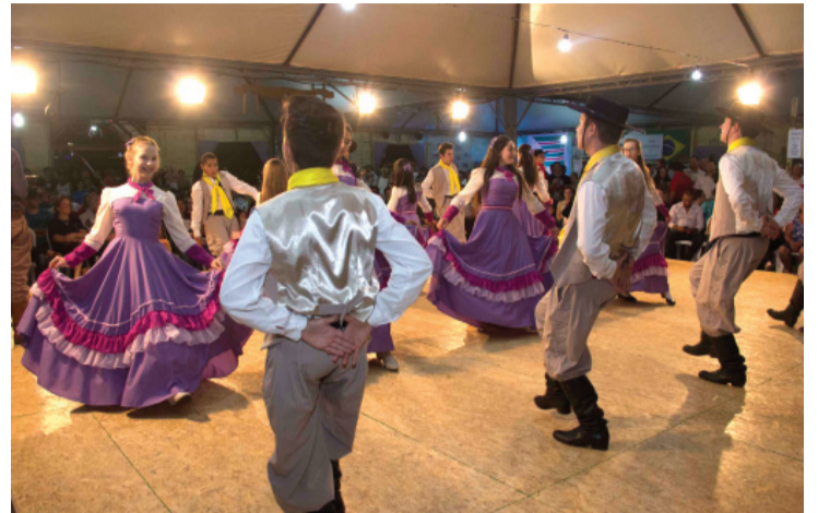
Semana Farroupilha de Toledo contou com várias atrações

Toledo - A 9ª Semana Farroupilha teve seu encerramento nesse domingo com o show do gaúcho Nenito Sarturi. O evento idealizado para exaltar a cultura gaúcha ocorreu entre os dias 6 e 10 de setembro em Toledo. O Galpão, onde tudo aconteceu, foi montado no Parque Ecológico Diva Paim Barth. Nem bem acabou e a "gauchada" já está com saudades.