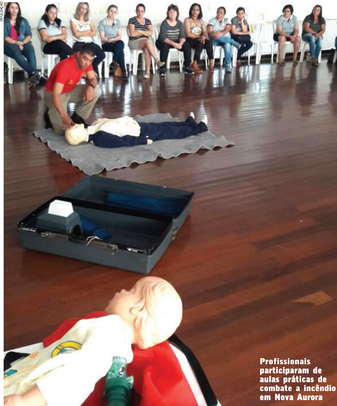
Profissionais participaram de aulas práticas de combate a incêndio em Nova Aurora