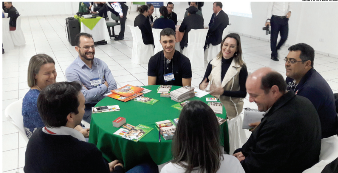
A procura de empresários e instituições interessadas em promover novos encontros se intensificou.

Dias após a realização das primeiras Sessões de Negócios no Território Cantuquiriguaçu, a procura de empresários e instituições interessadas em promover novos encontros se intensificou.