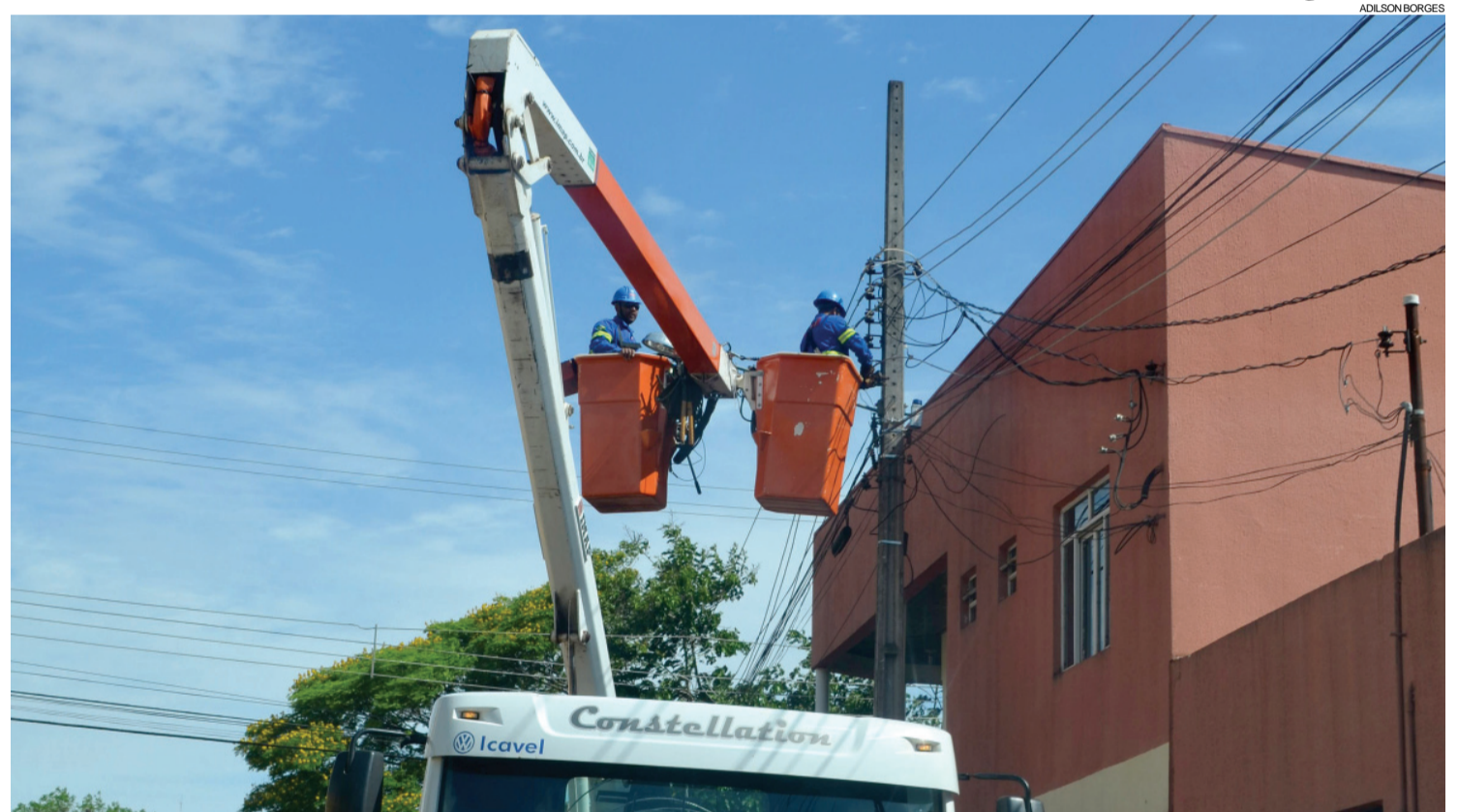
Copel realiza reparação na rede elétrica danificada pelo temporal em Foz do Iguaçu

Já a Copel conseguiu restabelecer a energia na maior parte da cidade três horas e