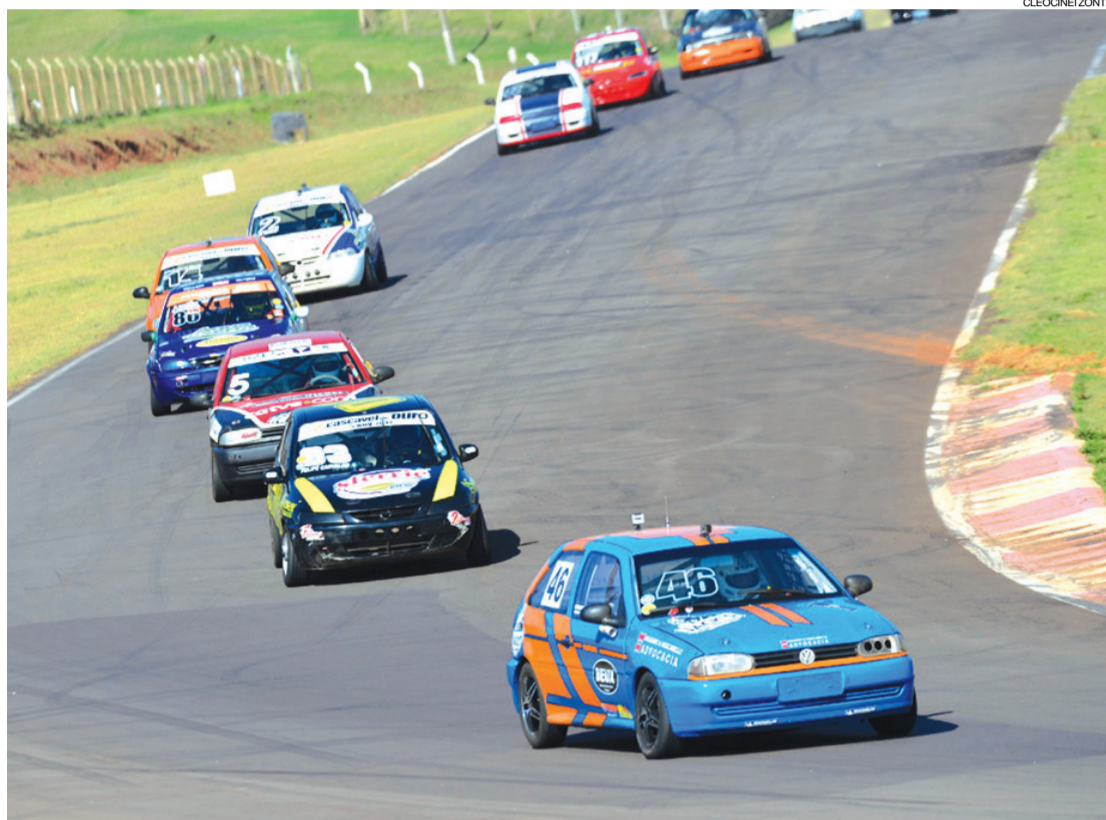
O Autódromo de Cascavel terá um "Festival de Decisões" no próximo fim de semana

O automobilismo do Paraná terá uma semana agitada com a decisão de dois campeonatos. No próximo fim de semana o Autódromo Zilmar Beux, em Cascavel, região oeste do Estado, será palco das etapas finais dos Campeonatos Paranaense de Velocidade e do Metropolitano de Marcas de Cascavel. As provas serão válidas também pela sétima etapa dos metropolitano