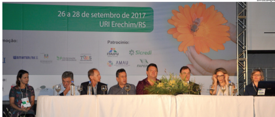
Comitê Gestor do Programa Cultivando Água Boa incentiva a cadeia produtiva de plantas medicinais

Santa Helena - Um grupo composto por 53 pessoas provenientes de 15 instituições da região oeste do Paraná, Mundo Novo (MS) e Paraguai participou da 11ª Reunião Técnica Estadual de Plantas Bioativas em Erechim, no Rio Grande do Sul.