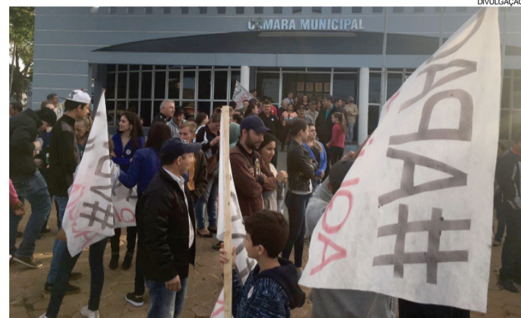
Protesto em frente a Câmara reuniu moradores do distrito ontem