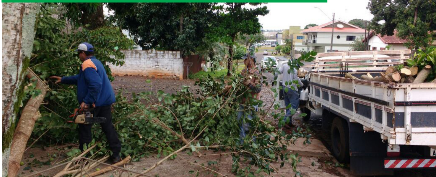
Equipes da prefeitura de Santa Terezinha de Itaipu retiram galhos das calçadas

Santa Terezinha - O temporal que atingiu Santa Terezinha de Itaipu e região na noite de domingo não trouxe grandes prejuízos aos moradores. De acordo com levantamento feito pela Secretaria de Agropecuária e Meio Ambiente, houve apenas queda de